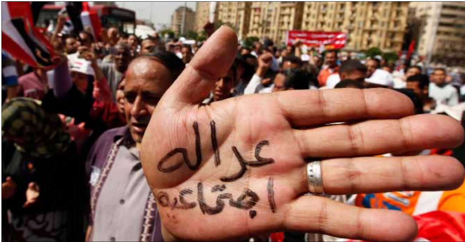
مطلب تحقيق العدالة الاجتماعية يتوحد خلفه المصريون

الاحتجاجات وصلت للمرة الأولى إلى داخل مشروعات الجيش