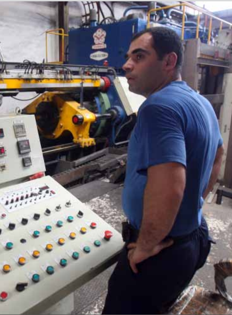
الدعم الذي ستلقاه صناعة الألمنيوم سينسحب مبدئياً على صناعات أخرى مشابهة

فريخ صابونجيان: نعد ملفات لدعم المعامل وحمايتها