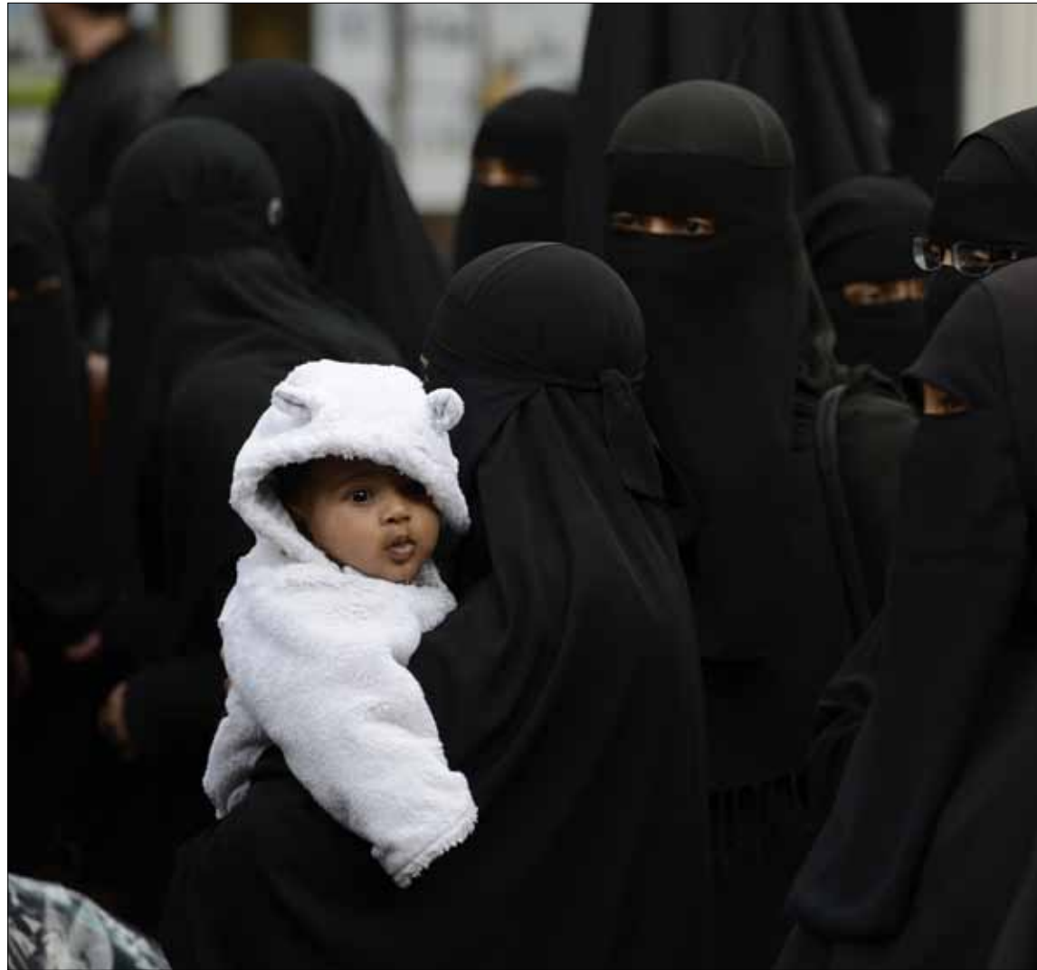
تظاهرات خارج السفارة الفرنسية في لندن أمس

من جهتها، دعت السلطات الباكستانية إلى الهدوء واستدعت أرفع دبلوماسي أميركي لديها لتطلب من واشنطن اتخاذ إجراءات فورية من أجل سحب فيلم «براءة المسلمين» من موقع «يوتيوب». وكانت السلطات قد أطلقت على هذا يوم الجمعة اسم «يوم عشاق الرسول»، كي يتمكن الناس من التظاهر دفاعاً عن الإسلام وعن النبي. واستنفرت الأجهزة الأمنية، خصوصاً في العاصمة اسلام آباد، حيث أقيمت حواجز للحؤول دون شن أي هجوم على الحي الدبلوماسي الذي يضم سفارات أجنبية.