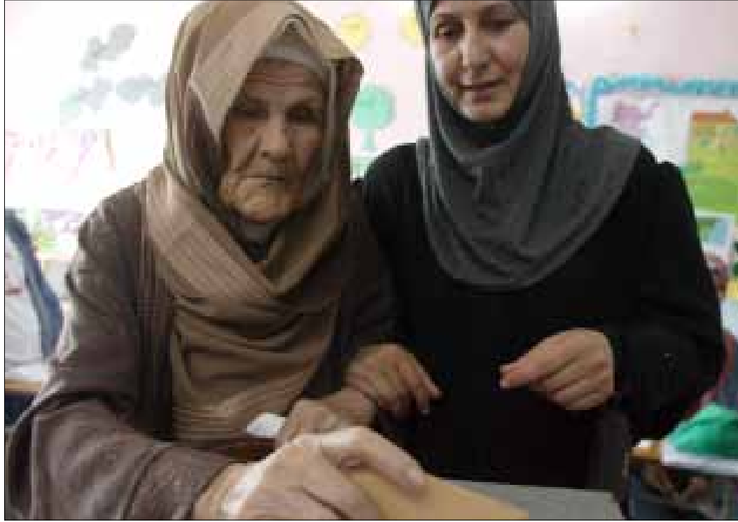
مجد العائلة كان قد ضاع مع بداية الحرب الأهلية

يستطيع الخليل أن يجلس تحت شجرة التوت المعمرة في بستان العائلة في الحمادية قرب العباسية، ويروي لساعات طوال بصمات أفراد العائلة في تاريخ جبل عامل. يمكنه أن يعرض لمجلسه عشرات الزعماء والرؤساء والشخصيات الذين تنزهوا في هذا المكان تحديداً، وأن يستعين بعشرات