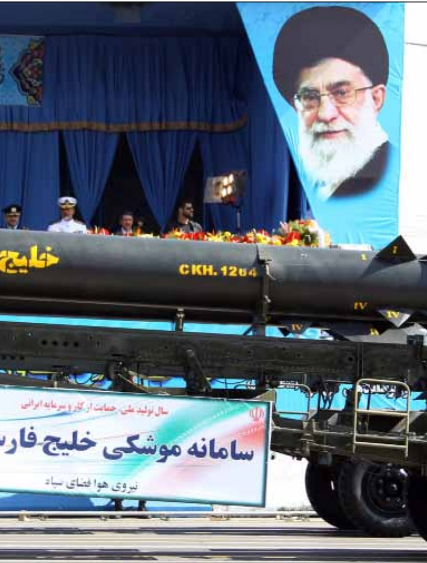
صاروخ «خليج فارس» المضاد للسفن خلال عرض عسكري في طهران أمس