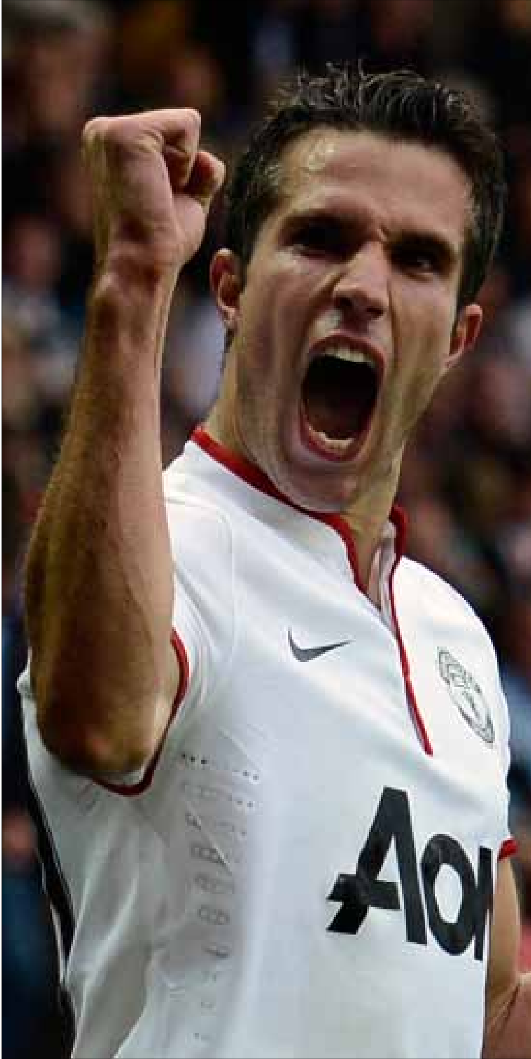
يعول مانشستر يونايتد على نجمه الهولندي روبن فان بيرسي

لن يكون واين روني موجوداً أمام ليفربول؛ إذ صرح مدرب مانشستر يونايتد، الاسكوتلندي أليكس فيرغيسون، بأن «الولد الذهبي» المصاب قد يعود إلى المشاركة الأسبوع المقبل. وقال فيرغيسون: «قرأت أنه قد يشارك في المباراة ضد غلطة سراي التركي (الأربعاء الماضي في دوري أبطال أوروبا)، لكن الأمر لم يكن كذلك. الأسبوع المقبل قد يصبح ذلك ممكناً.»