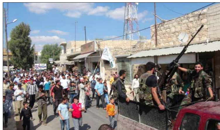
عناصر من «الجيش الحر» يتقدمون تظاهرة في ريف حلب امس