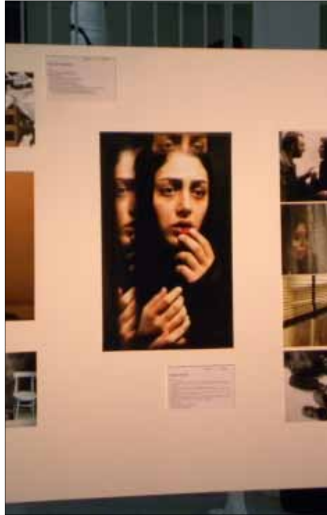
من فيلم «انفصال» للمصور حبيب مجيدي

المصورون اللبنانيون هم الأكثر حضوراً، مع غياب ملحوظ لأسماء عدد من المخضرمين في فن الصورة. غياب غير مبرر ربما، لكنه فتح المجال أمام مواهب جديدة كي تعرض أعمالها لأول مرة إلى جانب مصوريين محترفين، وبين هؤلاء الهواة فنانون قادمون من خلفيات متعددة، مثل قطاعات السياحة، والتجارة، والأعمال. في جولة على المعرض، يمكن الانتباه إلى تمييز عدد من اللبنانيين، كما في أعمال المصور وليد رشيد الذي زار مناطق