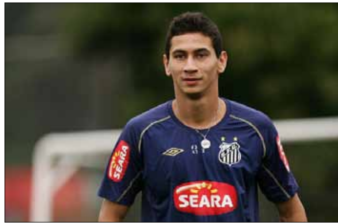
ارتبط غانسو بساو باولو لمدة خمس سنوات

وقال هيسكي لموقع جتس على شبكة «الإنترنت»: «إنها حقبة جديدة ومثيرة في مسيرتي وأنا أتطلع لكي اساهم بشكل مميز في نجاح الدوري الأسترالي وتحديداً فريق نيوكاسل جتس». وأضاف: «انطلاق الموسم ليس بعيداً وبالتالي سأنضم إلى نيوكاسل قريباً جداً والاستعداد