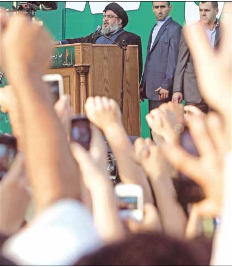
هولندا هي الدولة الأوروبية الوحيدة التي تصنف حزب الله إرهابياً