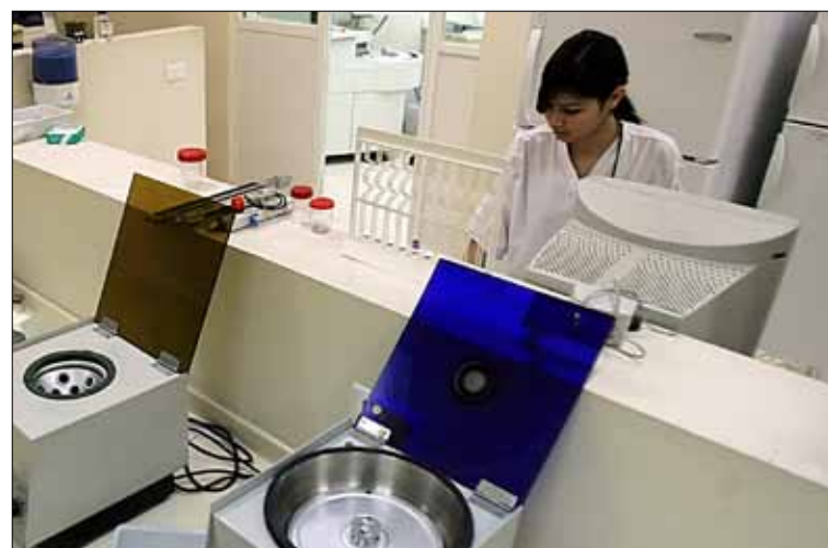
استغرقت العملية ساعة بكلفة لم تتجاوز المئة ألف ليرة

ليس رضوان وصديقه وحدهما من تجرأ على هذا الأمر. هذه أم خالد الستينية، التي لم تستطع أن تدخر مبلغاً لتصلح أسنانها عند طبيب «رسمي»، لأن «كاترة الأسنان ما يشبعوا، معقول أنهم يطلبون مقابل كل سن مائة دولار أو أكثر؟». لذلك لجأت إلى «الحكيم المتجول» على الرغم من أنها تعرف مخاطر معالجة أسنانها من دون أدوات معقمة (على الأقل) كما يفعل الطبيب. تقول: «لم أعد قادرة على التحلّل، بدأت معدتي تؤلمني بسبب أسناني». صبرت أم خالد على حالها أكثر من سبع سنوات، تنتظر تحسّن ظروف زوجها الاقتصادية السيئة. صبر كان سيطول أكثر «على شو بدنا نلحق؟ مدارس أو مستشفيات؟ كل سنة منقول هناك ما هو أهم من الأسنان».