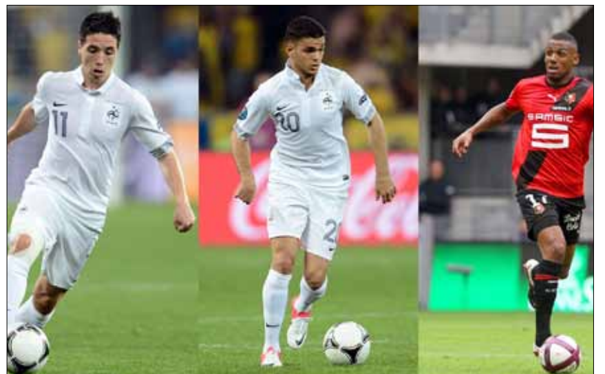
لم تكن عقوبات إيقاف اللاعبين المخالفين بحجم التوقعات

بدأت العقوبات التي اقترتها اللجنة التأديبية التابعة للاتحاد الفرنسي لكرة القدم أمس على اللاعبين الدوليين «المشاغبين» في كأس أوروبا 2012 خفيفة جداً، إذ تم وقف سمير نصري وجيريمي مينييز لثلاث مباريات ومباراة واحدة على التوالي، بينما اكتفت اللجنة بتأنيب الثنائي الآخر حاتم بن عرفة ويان مفيللا وطلبت منهما الانضباط. ورفض رئيس الاتحاد الفرنسي نويل لو غرايه التعليق على قرار اللجنة التأديبية، مكتفياً بالتوضيح أن هناك «احتمالاً للاستئناف، وما دام الإجراء مستمراً فلن أدلي بأي تعليق». وفي سياق متصل، كان المشكلة التي واجهها بن عرفة بسبب تصرفه تجاه مدرب المنتخب الوطني لوران