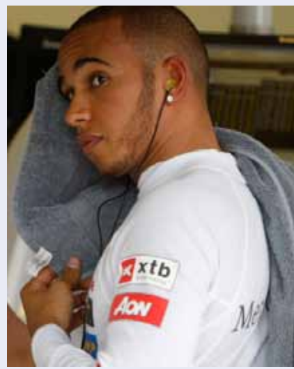
لويس هاميلتون بعد انتهاء التجارب الحرة

وعند توقف الامطار واستئناف فترة التجارب، لم يتمكن اي من السائقيين من تحسين وقته بسبب بقاء اجزاء كبيرة من الحلبة مبللة. وتقام التجارب الرسمية اليوم الساعة 15,00 بتوقيت بيروت، والسباق غداً في التوقيت عينه.