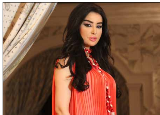
ميساء مغربي في «العبة المرأة رجل»