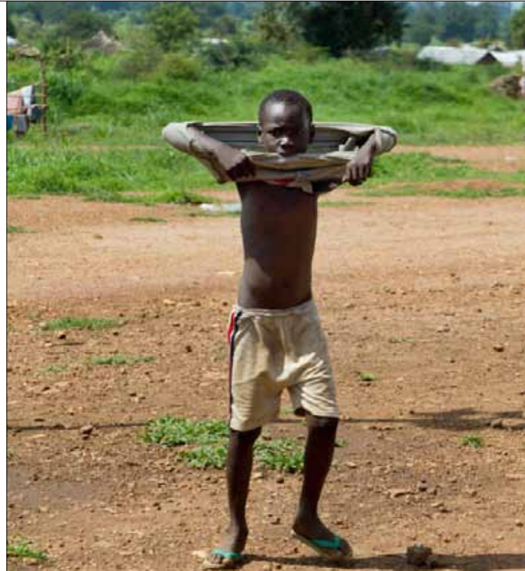
مشاريع التنمية في جنوب السودان تنتطلب زيادة معدلات استهلاك المياه

العراق، ووضعهم في مناطق نائية خشية أن يسربوا ما لديهم من معلومات، أو يحولوا تلك المعلومات إلى منظمات أو دول معادية. وأسفرت هذه المغريات عن زيارة عدد من العلماء العراقيين للكيان الصهيوني، أبرزهم أستاذ علم الفيزياء النووية الدكتور طاهر لبيب، والمتخصص في مجال التكنولوجيا الدكتور محمود أبو صالح.