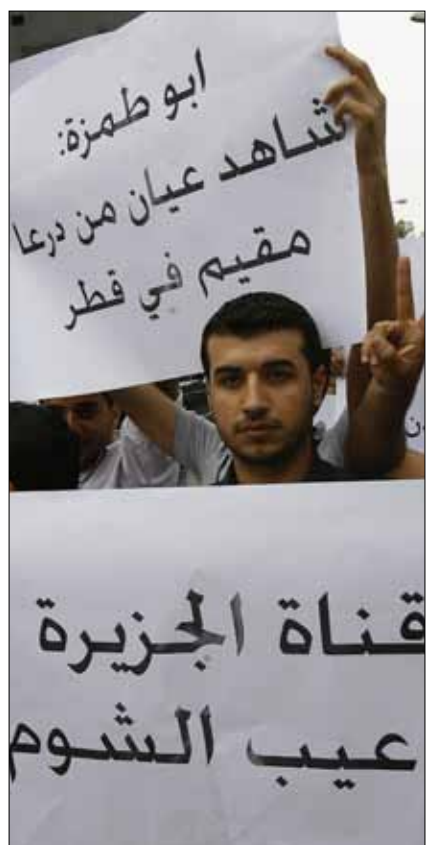
من تظاهرة منددة بـ«الجزيرة» في بيروت

لم تكن هذه الواقعة مجرد كبوة في أداء «الجزيرة»، بل إنها أصبحت واحدة من سلسلة طويلة من الوقائع المشابهة، في أماكن وساحات أخرى من ساحات الربيع العربية. ففي تونس، أصبحت «الجزيرة» لسان حال حركة النهضة، ولم تحظ الحركات الديمقراطية واليسارية الأخرى بأي نوع من العدالة في الاهتمام والتغطية. الأمر ذاته تكرر في مصر، حيث وضعت القناة ثقلها إلى جانب الإسلاميين «الإخوانيين والسلفيين»، مع استثناء طارئ أبدته حين أحرز المرشح الانتخابي «الناصرى» حمدى صباحي نتائج طيبة في الجولة الأولى من انتخابات الرئاسة، إذ يبدو أن القناة سمحت للقوميين الناصريين في كابنتها بفسحة أوسع من العمل والحركة لمناصرة صديقهم