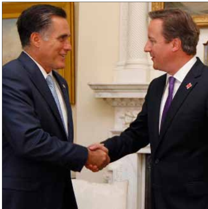
رئيس الحكومة البريطانية ديفد كامبرون مستقبلاً رومني في لندن

قد سعى خلال حملته الانتخابية إلى إظهار نفسه صديقاً مخلصاً لإسرائيل بإزاء منافسه الديموقراطي أوباما، إلا أن عاملي التاريخ والخبرة قد علما الشعب الاسرائيلي عدم التسليم بالوعود ومظاهر التعاطف التي يبديها لهم أي مرشح لانتخابات الرئاسة الأميركية. وقالت «لوس أنجلوس تايمز» إنه على الرغم من التشكك والحذر الذي يبديه الشعب الاسرائيلي لوعود رومني، يخشى البعض من أن رئيس الوزراء الاسرائيلي بنيامين نتنياهو قد ذهب بعيداً في دعمه لرومني والوقوف إلى جانب الحزب الجمهوري بنحو عام. ونقلت الصحيفة عن الخبير في الشؤون