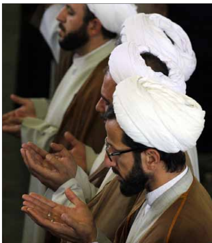
خلال صلاة الجمعة في جامعة طهران امس

وقال التقرير، الذي جاء بعنوان «التقرير السنوي حول القوة العسكرية لإيران»، إن البحرية الإيرانية تطور قدرة الصواريخ المضادة للسفن. ويكرر التقرير التقييم الأميركي المعروف منذ زمن بان «إيران قد تكون قادرة تقنياً