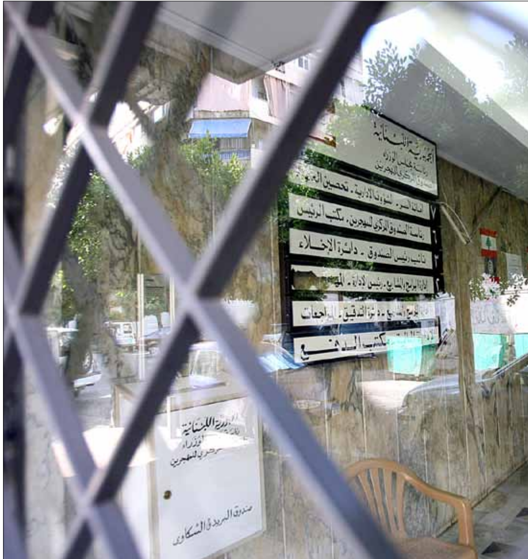
القضية أصبحت في عهدة محكمة الجنايات

بعد 13 عشر عاماً على فضيحة الفساد المالي في وزارة المهجرين، صدر القرار الإتهامي بحق المدير العام والمحاسب وأحد الموظفين، طالباً تجريبهم بجنايات تصل عقوبتها إلى الأشغال الشاقة 15 عاماً. المدير العام «إشترافي». هو مطلوب للعدالة منذ سنوات، والقوى الأمنية لا توقفه، بحجة تواريه عن الأنظار في «الجبل الجنبلاطي»