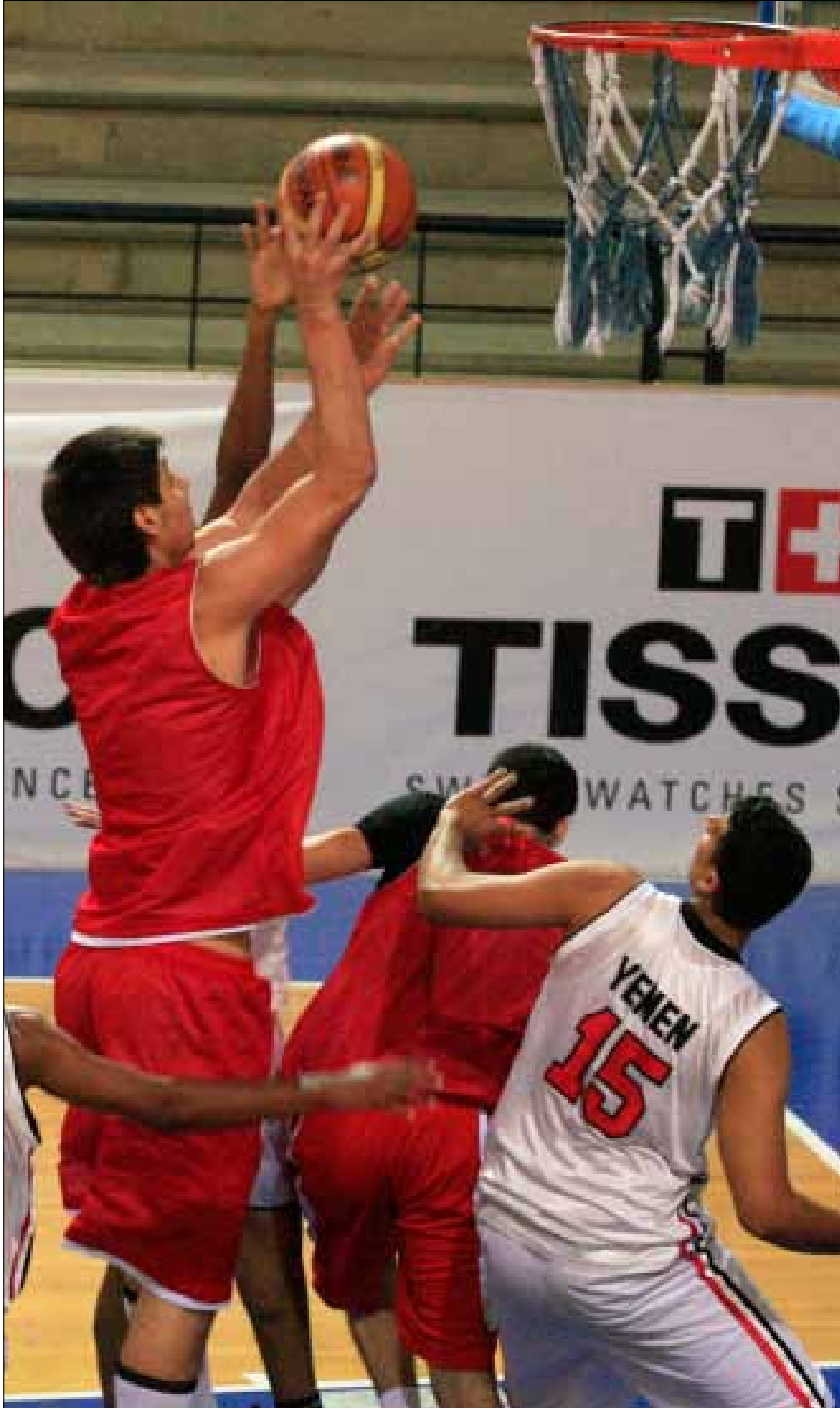
تدفع المنتخبات الوطنية ضريبة غياب الأموال