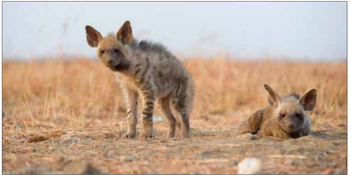
يتوقع ان يغادر الضبعان الى باريس منتصف شهر ايلول المقبل