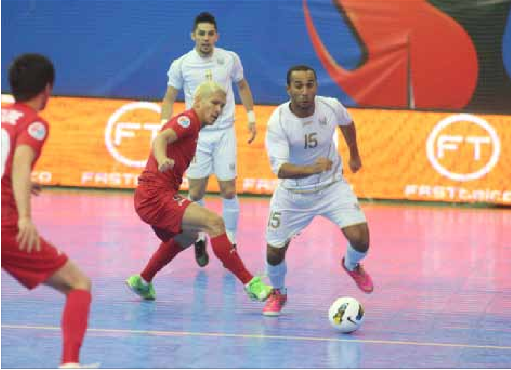
لم يكن أول سبورتس وحده في الساحة فالفرق كلها تسلّحت بالأجانب واللاعبين الدوليين