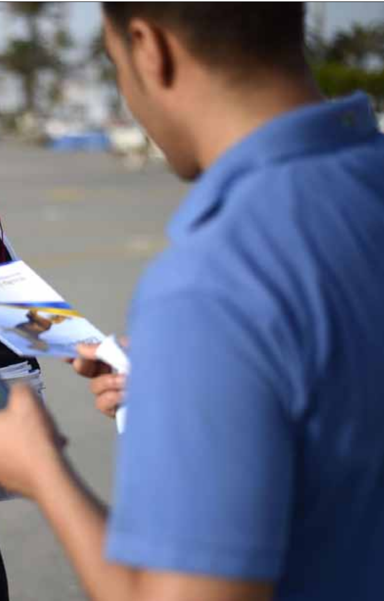
سيختار الناخبون 200 عضو في الجمعية التي ستشكل بدورها حكومة جديدة

في تعليقه على الانتخابات الأولى بعد سقوط الزعيم الليبي معمر القذافي (الصورة)، يرى السياسي الليبي، الدكتور ابراهيم قويدر، أن المواطن الليبي سيصوت للأفراد المستقلين. كما أن القوائم سيختارها المواطن من خلال الأفراد وليس المكونات السياسية. بعدما لفت إلى أن الأحزاب ليست لها قواعد شعبية، أوضح أن الفارق يتمثل في اقناع بعض الشخصيات ذات المنزلة الاجتماعية والقبائل لضمها إلى القوائم الحزبية. ولذلك، فلن يكون هناك تأثير كبير لهذه الكيانات الحزبية في تسيير دفة المرحلة الانتقالية الثانية. كما يرى أنه لن يكون منهم رئيس ونواب المؤتمر الوطني ولا رئاسة الحكومة. ومن وسط هذا الاختلاف الواضح في وجهات النظر، يظل التساؤل الأبرز لدى المواطنين عن مصدر المبالغ الطائلة التي صرفتها الأحزاب على حملاتهم الانتخابية.