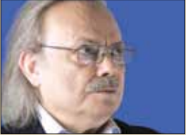
أنسي الحاج يكتب