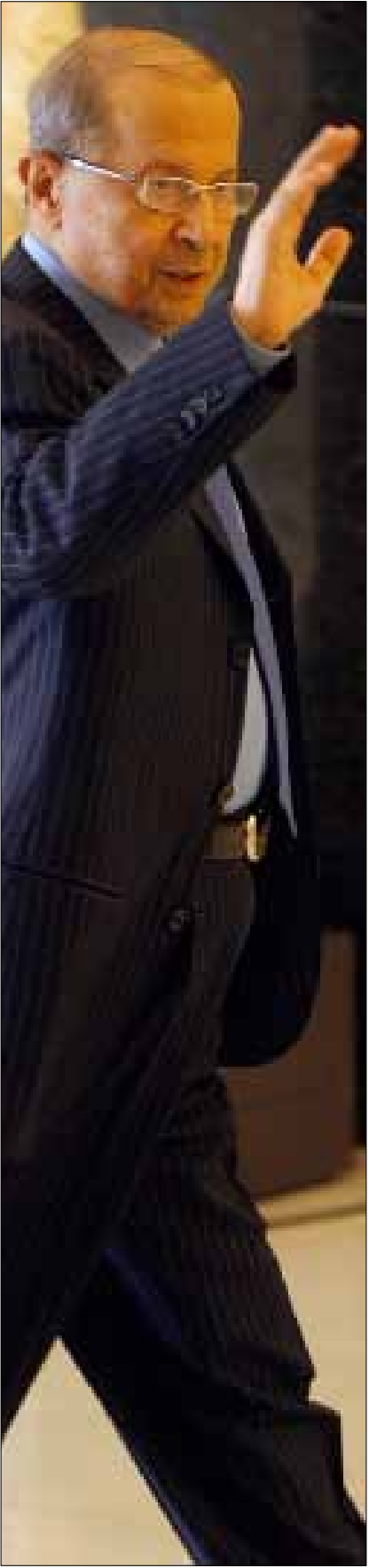
عون قبل جلسة الحوار الأخيرة

(2) في تعبيرها عن الحالة الشعبية ومطالبها السياسية، تحرص المعارضة الرسمية، بقيادة الوفاق، على تفادي حرب مفتوحة مع النظام،