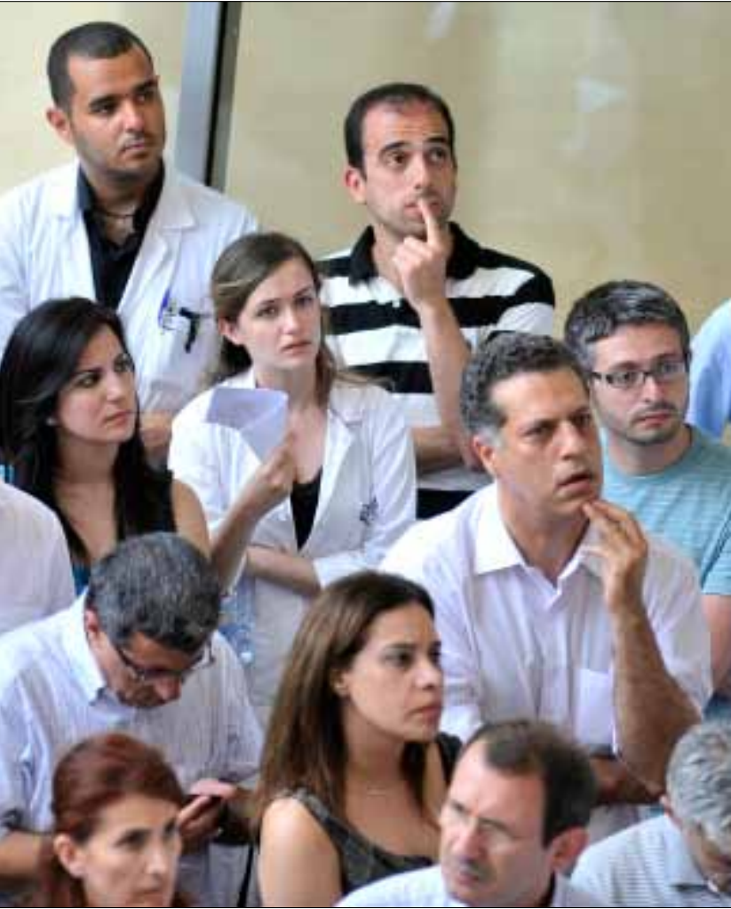
رض بالاجتماع عن القرارات لأنها تحمي الطبيب

«صارمة») وصلت إلى هواتف الأطباء المنتسبين إلى النقابة، تتضمن مطلباً واحداً: «عدم إعطاء استشارة أو وصفة طبية أو أخذ نتائج مخبرية أو أشعة على الهاتف». هذه الرسالة، التي أرفقتها النقابة بعبارة «للحفاظ على صحة المريض»، لها برأي أبو شرف غاية أخرى، قد تكون «الرد» على ما حصل في الموضوع، سواء بالنسبة إلى الإعلام أو بالنسبة إلى المتعاطين مع هذه القضية، والذين هم «مرضى في نهاية المطاف». فحتى ما قبل الحادثة، كانت العلاقة مع المريض بشكل خاص، والإعلام من بعده، علاقة «مميزة جداً غير موجودة في أي بلد في العالم». بمعنى آخر، علاقة «أخوية». لكن، ما بعد الحادثة لا يشبه ما قبله، فثمة «خطأ موجود وهو إما فينا كأطباء، أو في المريض أو في الإعلام». خطأ يوازى بنسبته نسبة الإخفاء الطبية، أي «10%». وهذه النسبة تحتاج إلى علاج. من هنا، بدأت النقابة ردها الأول، لتستتبعه بسلسلة