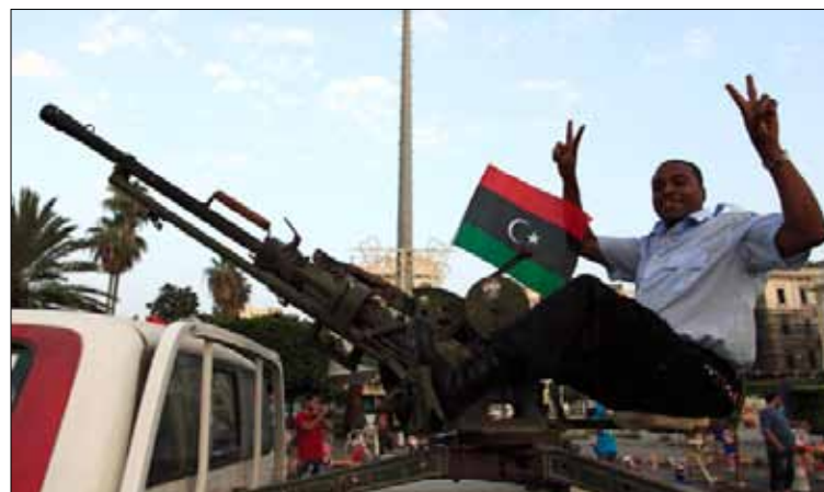
يجمع المواطنون على مطلب عودة الاستقرار الأمني

وتخريب وسرقة وسلب وحرق يُجهل مصدرها. وفي الطرف الآخر، حيث تطبخ القدرات، أعلن فجأة وبدون مقدمات تعديل في نص الإعلان الدستوري للمرة الثالثة، حيث سُمح في هذه المرة بانتخاب لجنة الـ 60 - تأسيسية الدستور - عن