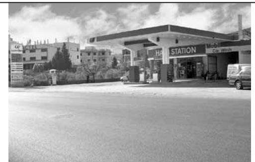
بعد 90 عامًا من التاريخ العريق. وردية توجه أنظارها نحو المستقبل احتفالات مرتبطة بهذا الحدث المميز حيث سيتمخض ورتبة 2012 رابحاً محظوظاً سنة كاملة من الوجود المجاني