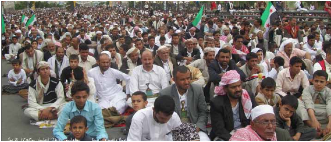
المتحجون تظاهروا أمس في صنعاء تحت شعار «القضية الجنوبية قضيتنا»

يقول الشاب العدني علاء (18 عاماً)، إنه لم يعيش في زمن حكم الحزب الاشتراكي