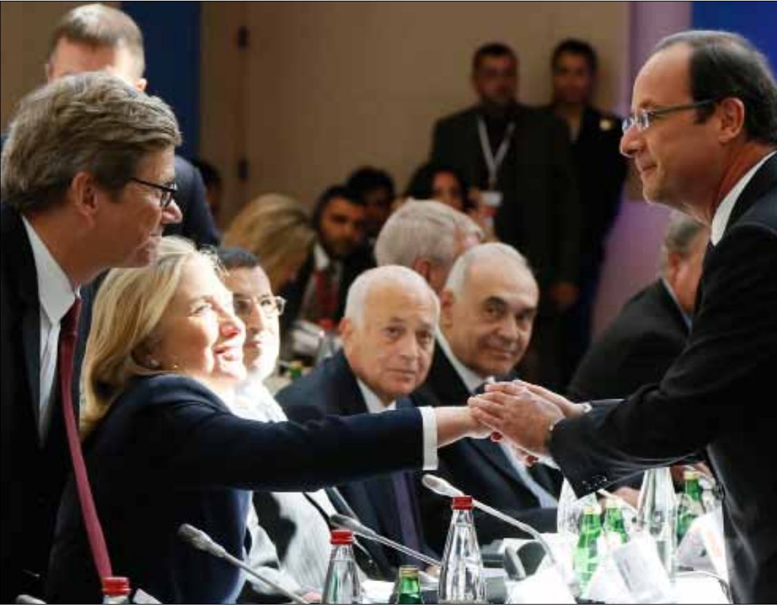
أيد مؤتمر باريس «التفسيرات الغربية لقرارات اجتماع جنيف»

خيبت النسخة الثالثة من «مؤتمر اصدقاء سوريا» توقعات المعارضة السورية. وجاءت خيبة أمل «المجلس الوطني السوري» كبيرة. اثر قرار المؤتمر بإصدار قرار في مجلس الأمن لا يشمل استخدام العنف