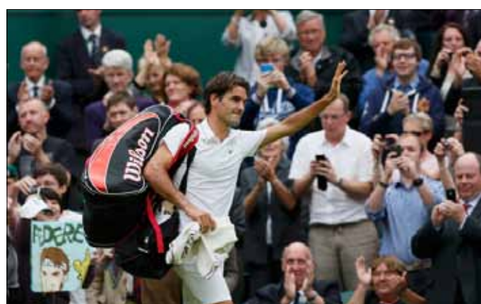
فيدري يحيي الجماهير بعد فوزه على ديوكوفيتش

وبعد المجموعتين الأوليين اللتين انتهتا سريعاً في زمن قصير جداً ولم تشهدا تبادلات طويلة وكبيرة حيث كسر كل منهما ارسال