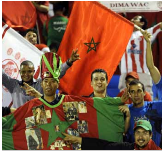
الجمهور المغربي سيؤازر منتخبه في النهائي

أخطاؤهم ظهر الفريق ولم يكونوا في يومهم، والفرق بدا شاسعاً بين كرة عرب أفريقيا وعرب آسيا، نظراً إلى اعتماد الأول على مقومات أساسية في النجاح، منها التنظيم والمسابقات المختلفة وعقلية اللاعب الأفريقي التي تختلف جذرياً عن عقلية اللاعب الآسيوي». وكان المنتخب العراقي قد تخلى نظيره اللبناني في بداية مشواره في البطولة 1-0، وجدد الفوز على الأجنبي المصري 2-1، وتعادل مع