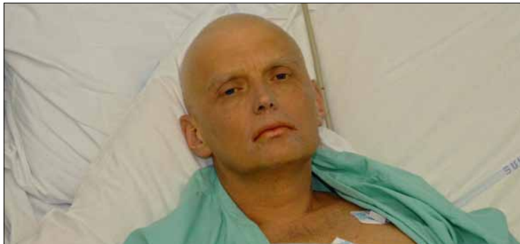
العميل الروسي الكسندر ليتفيننكو الذي مات بعد تمذد الأشعاعات في أنحاء جسده

يمكن أن يستخدم البولونيوم (عيار 210) كسم قاتل في الحالات التالية: إذا تمّ تنشقه، أو بلعه أو امتصاصه. وفي هذه الحالات تدمر الأشعاعات التي تنبعث منه جميع الأعضاء العضوية، بدءاً بالكبد والطحال وتؤدي إلى الموت البطيء. لكن هذا لا يعني تلقائياً أن وجود آثار بولونيوم، بكميات محدودة جداً، على الملابس أو على سطح بعض الأدوات المستخدمة يؤدي حتماً إلى تسمم قاتل، إذ إن عدم امتصاص أو بلع أو تنشق المادة لا يؤثر على صحة الجسد.