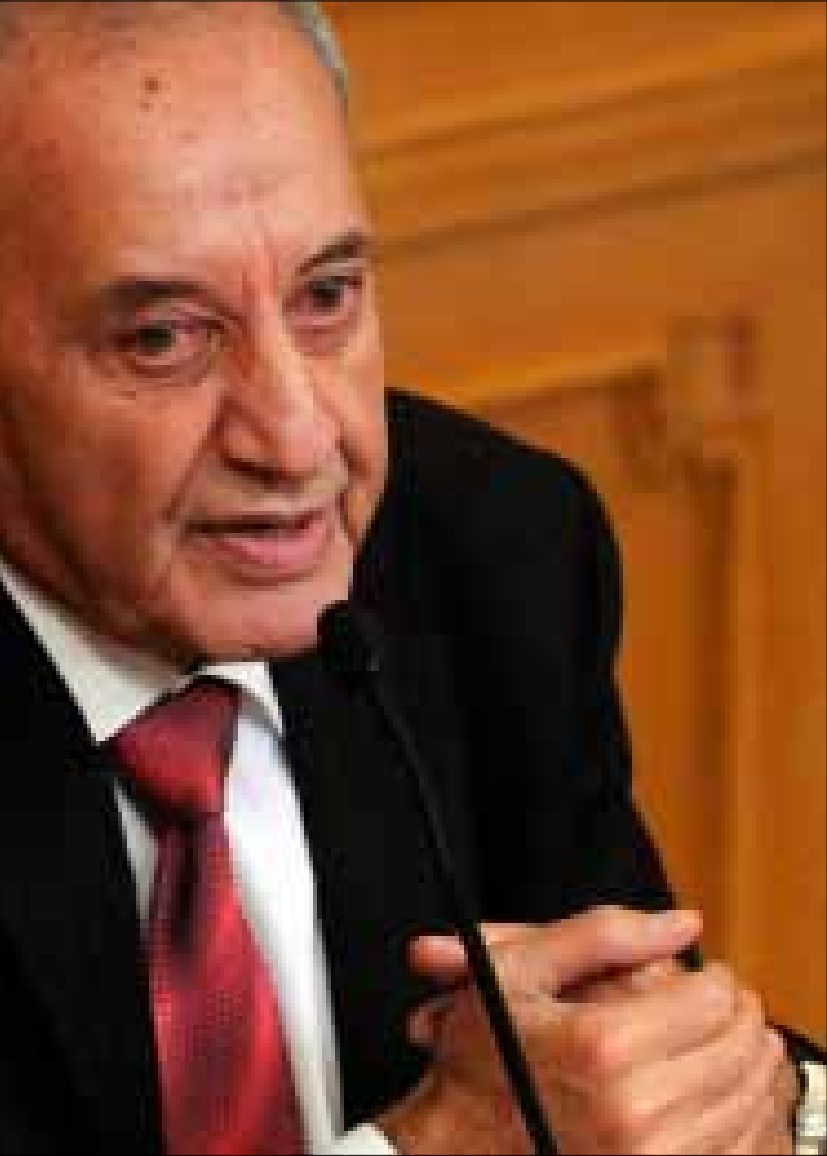
لا اتفاق ثلاثياً ولا رباعياً ولا اصطفاكات سياسية جديدة في البلد

نظراً للظروف التي يمر بها البلد، ولا سيما منطقة الجنوب، تعلن مؤسّسات الإمام الصّدر في صور إلغاء الاحتفال التكريمي الذي كان مقرراً غداً الجمعة 6 تموز 2012