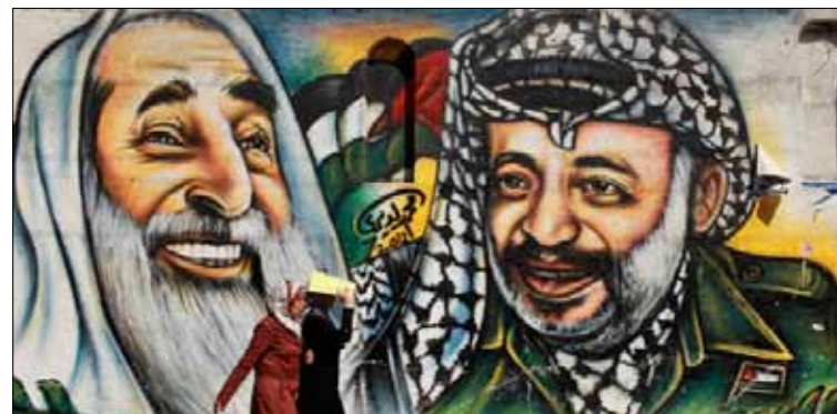
رسم لعرفات والشيخ أحمد ياسين على أحد جدران غزة

أعلن المتحدث الرسمي باسم الرئاسة، نبيل أبو ردينة، أمس، أن الرئيس محمود عباس أصدر تعليماته للجنة التحقيق في استشهاد الرئيس ياسر عرفات، بمتابعة جميع المعلومات والتقارير التي تتعلق بهذا الموضوع، والاستعانة بالخبرات العربية والدولية العلمية للوقوف على حقيقة أسباب مرض الرئيس الراحل واستشهاده. وعقب أبو ردينة، على تقرير «الجزيرة»، بالقول إن «السلطة، وكما كانت على الدوام، على استعداد كامل للتعاون وتقديم جميع التسهيلات للكشف عن الأسباب الحقيقية التي أدت إلى مرض الرئيس الراحل واستشهاده، ولا يوجد أي سبب ديني أو سياسي يمنع أو يحول دون إعادة البحث في هذا الموضوع، بما في ذلك فحص رفات الرئيس الراحل من قبل جهة علمية وطنية موثوقة، وبناءً على طلب أفراد