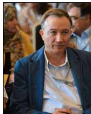
أكد المؤتمر على دعم الجيش السوري الحر

وأصدر المؤتمر وثيقة «الرؤية السياسية المشتركة للملامح المرحلة الانتقالية»، التي حددت مجموعة الخطوات اللازم اتخاذها حتى نهاية المرحلة الانتقالية. وتبدأ هذه المرحلة