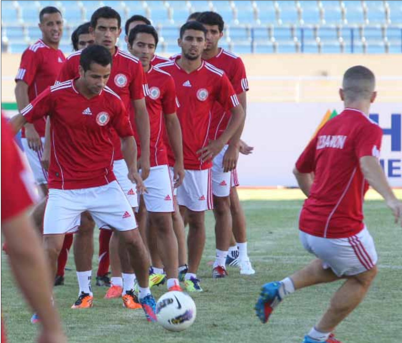
يجب الاستماع الى اللاعبين ومساءلهم في الوقت عينه

يصل اليوم رئيس لجنة المنتخبات في الاتحاد اللبناني لكرة القدم، أحمد قمر الدين، بعد أربعة أيام على عودة المنتخب من كأس العرب، لتبدأ مرحلة تحتاج الى إعادة نظر شاملة، بالاشتراك مع الاتحاد بكامله وخصوصاً الرئيس هاشم حيدر