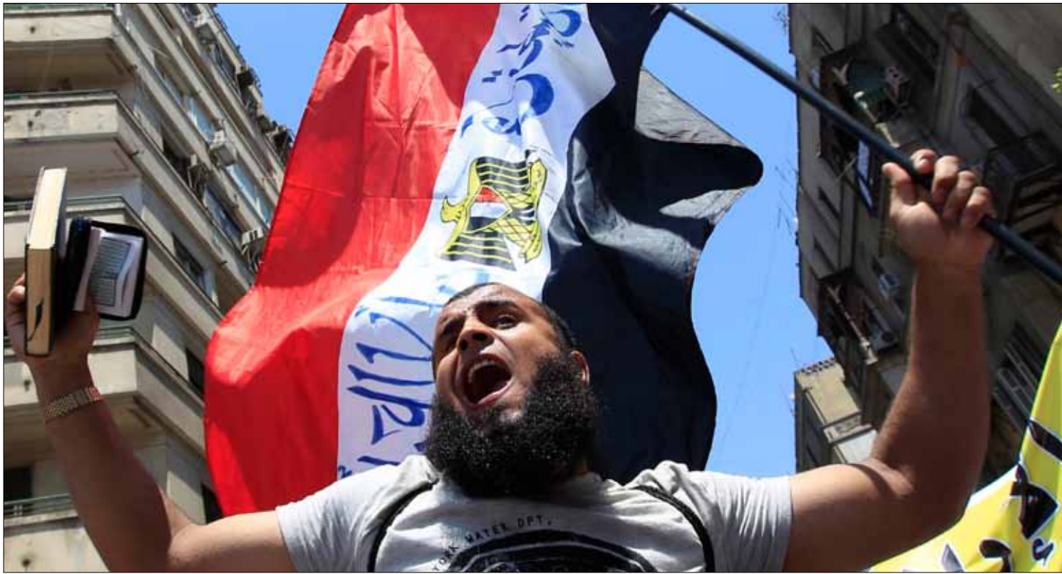
مخاوف من أن يشهد الشارع المصري مزيداً من المظاهر المتشددة في الأيام المقبلة

نواردة نجم: جماعات الأمر بالمعروف والنهي عن المنكر أمنية بحتة