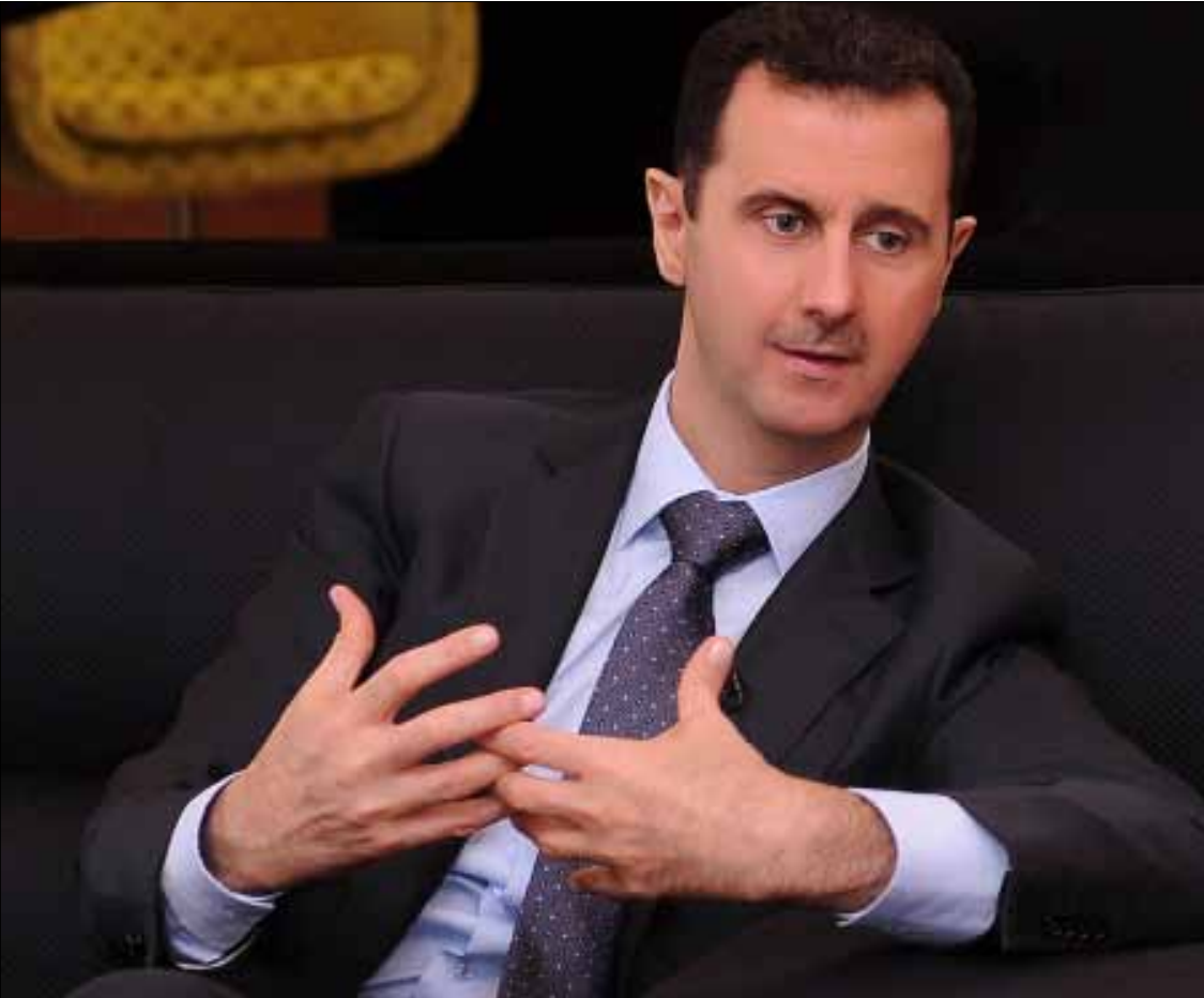
الأسد اتهم أردوغان بأنه خرج في تصريحاته عن كل الآداب والأخلاق

منك أنت كموطن تركي. لا شك في أنك ستقول إن هذا نفاق. فليتهم أردوغان بشؤونه الداخلية، لا بشؤون غيره لكي يبقى ما بقي من سياسة تصفير المشاكل قابلة للتطبيق».