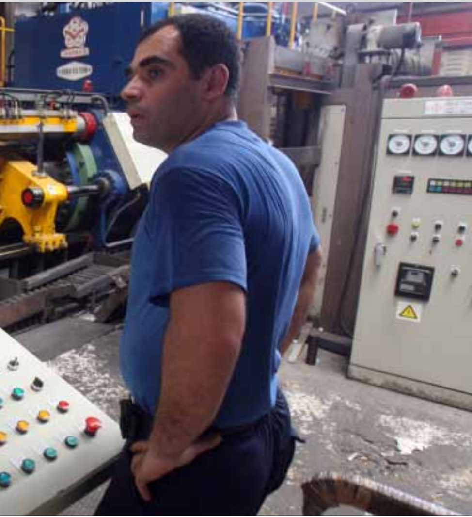
كلفة الإنتاج تزيد 3 أضعاف عند استعمال المولدات الخاصة (هيثم الموسوي)

قيمة المواد الأولية المستعملة في المصانع اللبنانية بحسب آخر احصاء صناعي صدر عام 2007