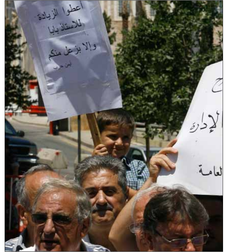
دعا المعتصمون إلى رد الضرائب إلى مشروع الموازنة والنقاش بشأنها

وعد وزير العمل سليم جريصاتي هيئة التنسيق النقابية بدعمها في الاجتماع المصغر للجنة الوزارية المكلفة دراسة سلسلة الرتب والرواتب، اليوم. هو ليس موقفاً شعبوياً، كما قال جريصاتي للهيئة في لقائه معها أمس، بل مستند إلى أسباب قانونية