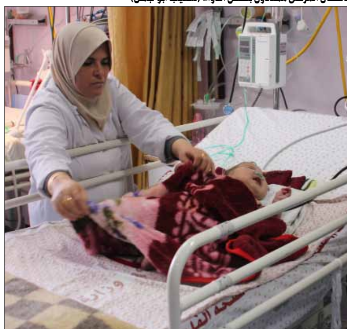
الأطفال المرضى مهددون بنقص الدواء (شعيب أبو جهل)

غزة، أعلنت أن الوضع الصحي في القطاع مرشح لتدهور خطير بسبب النقص في الرصيد الدوائي. وأشار الناطق باسم وزارة الصحة المقالة، أشرف القدرة، في حديث لـ «الأخبار» إلى أن الأزمة الدوائية وصلت إلى مستويات مقلقة جراء نفاذ 206 أصناف من الأدوية الأساسية، إضافة إلى نفاذ 260 صنفاً من المستلزمات الطبية. وأوضح أيضاً أن 85 صنفاً من الأدوية، و 150 صنفاً من المستلزمات الطبية الباقية، مرشحة للنفاذ خلال الثلاثة أشهر المقبلة. وأوضح القدرة وزارته أمام منعطف خطر واحتمال عدم القدرة على تقديم الخدمات الطبية لمليون و700 ألف مواطن محاصرين في قطاع غزة، مطالباً وزارة الصحة الفلسطينية في حكومة رام الله، بالعمل وفق الشراكة الوطنية والصحية، لدفع منظومة الصحة إلى الأمام وتقديم ما يمكن تقديمه من خدمات صحية لمرضى غزة. وأكد القدرة أن رسالته موجهة أيضاً إلى المؤسسات الإنسانية، بعدم الصمت والخروج من هذه الدائرة إلى دائرة التطبيق الفعلي على الأرض، لأن المريض الفلسطيني في خطر.