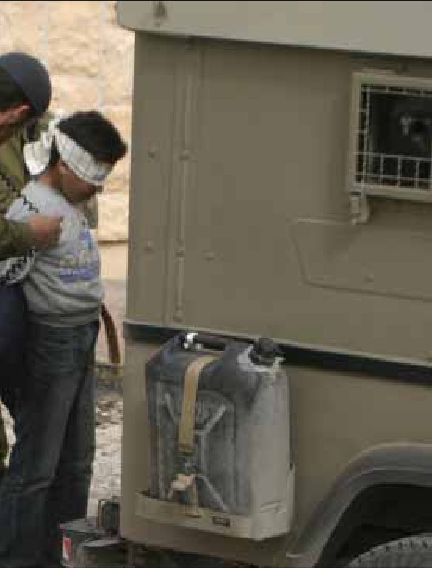
اعتقال أحد الأطفال الفلسطينيين في الضفة الغربية

أثار تقرير بريطاني عن وحشية خضوع الأطفال الفلسطينيين للقانون العسكري الإسرائيلي، الجدل بسبب فطاعة مضمونه ودعم الحكومة البريطانية له وتعهدتها الضغط على إسرائيل لتطبيق توصياته. أحد كتاب التقرير يكشف عن تفاؤله ويبث بعض الأمل