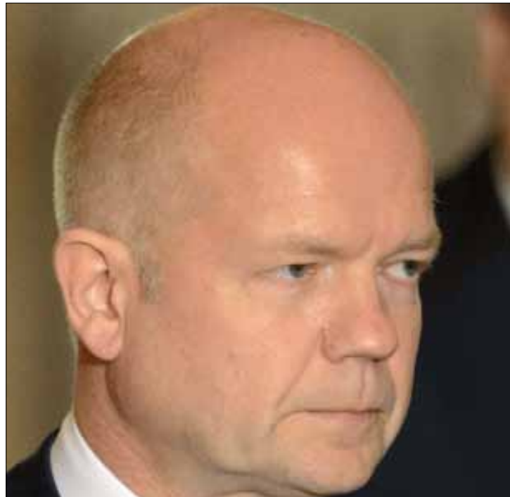
كشف هيغ أن بلاده زادت من تمويل المعارضة السورية