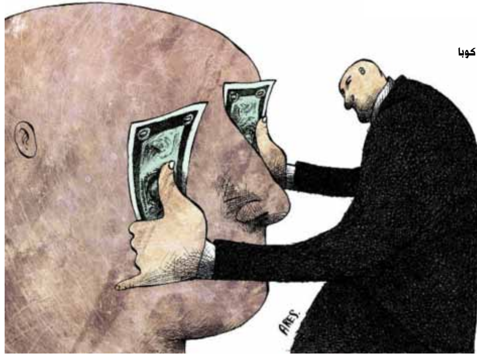
أريس - كوبا

وكان لافتاً أن الملف الذي نُشر بعنوان «استراتيجيات دولية، خاص بالجزائر»، لم يتطرق إلى منجزات نصف قرن من الاستقلال في الجزائر، كما يوحي به عنوانه الرئيسي، بل انصبت في تلميع حصيلة 13 سنة من الحكم البوتفليقي. في المقابل التي أجريت مع بوتفليقة وشكّلت المادة الرئيسية لهذا الملحق، لم