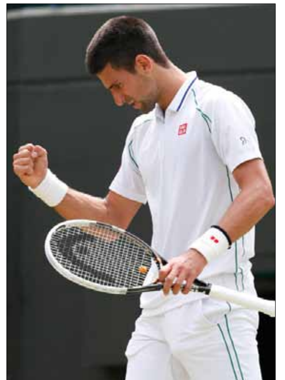
ديوكوفيتش بعد فوزه على ماير