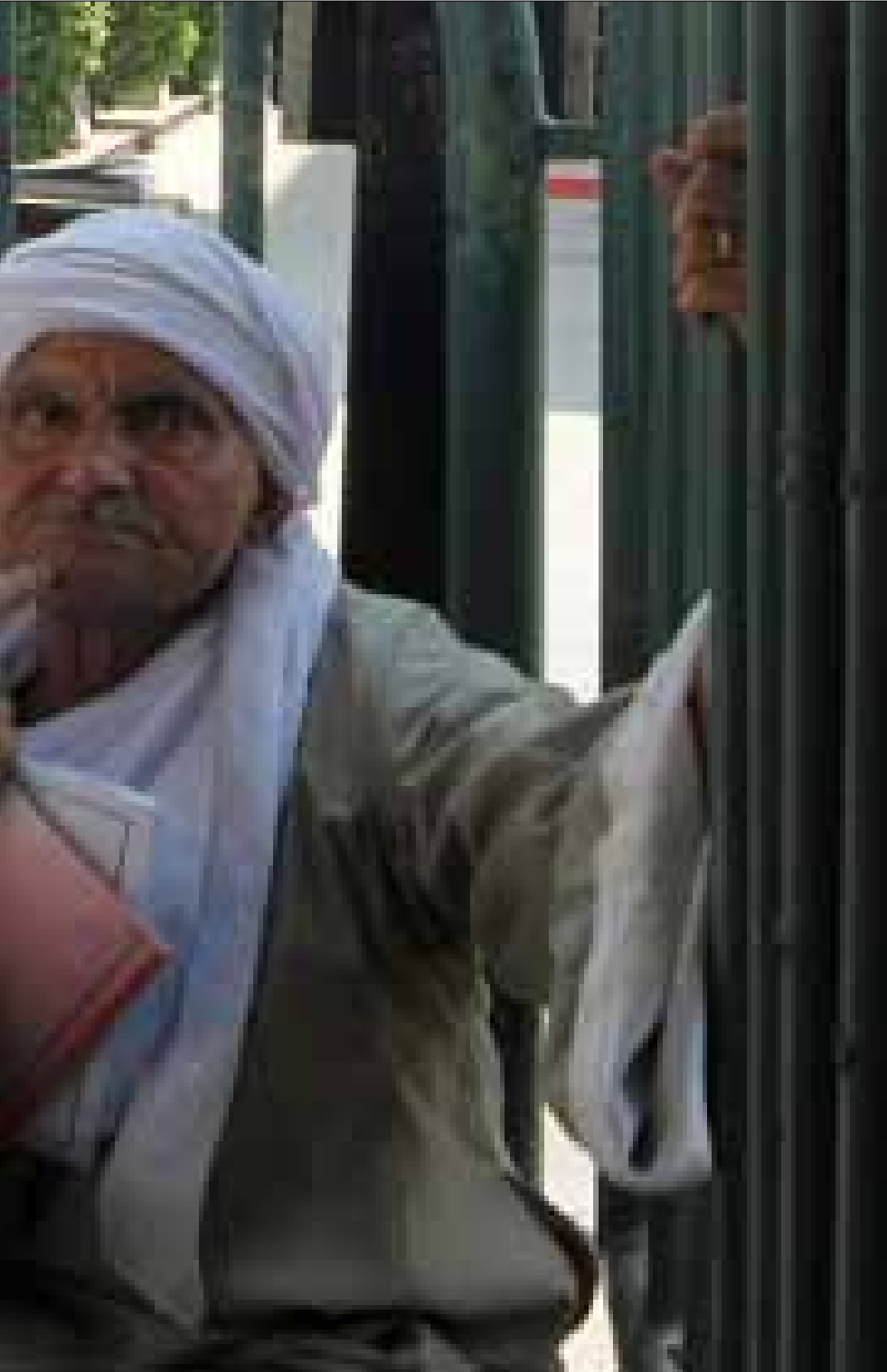
ينتظر إيصال رسالة إلى مرسي أمام القصر الرئاسي

وهذا هو الفخ، إذ إن العسكر انسحبوا من مواقعهم ليبدو الرئيس الإخواني في مواجهة الجميع، والرئيس يظهر شجاعاً، ويحاول صنع شعبيته مداعباً نموذج أمير المؤمنين العادل. لكنه ينقل النموذج إلى زمن آخر وبدون جسور ولا ادراك بالآليات سوى الحيلة. الحكايات المأخوذة عن الثعالب تعلي من قيمة الغرف المغلقة، كما تحب الدولة العميقة أن تفعل. هي تريد أن تثبت أنها لا تلفظ النفس الأخير، وتريد أن تقول للشعب كله: أنا الدولة، هذه الأجهزة كانت الدولة فعلاً حتى أزيح مبارك من مقعده في القصر إلى سريره في المستشفى. لم تكن دولة بل هيكل فارغ لدولة تدار بمنطق العصابة. الأجهزة الأمنية هي ذراع الحاكم وقبضته، أما المؤسسات فهي أقطاعات يوزعها على ممالئكه. دولة ممالئك بكل أجهزتها، والبقاء فيها للاقوى، وصاحب السمع والطاعة. الممالئك لا دولة لهم، بل مساحات نفوذ، والسياسة هي الصراع على هذه المساحات، والإنجازات تتم وفق رغبات المنتصر في تخليد اسمه لا في إقامة دولة، ولا بناء مؤسسات محترمة.