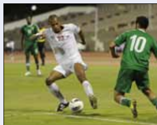
لن تشارك فلسطين في لعبة كرة القدم