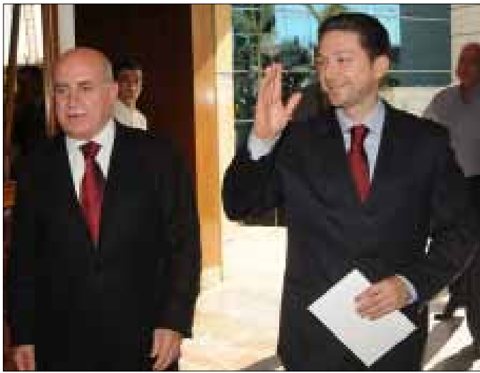
كرامي الأكثر حضوراً والنصافاً بالقيادة الشعبية

أول ضلع في هذا الرباعي، الرئيس ميقاتي، باتت استعداداته للانتخابات المقبلة لغزاً يحتاج إلى من يفك رموزه. فالرجل الذي استعداده مع طرابلس كرسي الرئاسة الثالثة، ورفع تاليه في الحكومة من أسهمه في المدينة، راهن كثيرون على أنه سيعمل من دون هواده على سحب البساط من تحت أقدام تيار المستقبل في الشارع السنخي، سواء عبر التعيينات أو الخدمات أو الخطاب السياسي، لكن المفاجأة أن سنة مرت من عمر حكومة، رئيسها وأربعة من وزرائها طرابلسيون، من دون أن تتحقق أحلام أهل المدينة بالمشاريع الإنمائية والخدماتية،