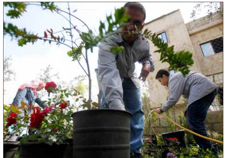
حملت نباتات المشتل أسماء الطلاب المشتركين في المشروع (حسن بحسون)

مع الآخرين. وبعد مشاريع النجارة والأكسسوارات والتزيين النسائي والخياطة، اختارت إدارة الجمعية إدخال المشروع الأخضر. وتشير الزين إلى أنه قادر على مساعدة المستفيدين منه على التفاعل مع الآخرين وبمنحهم فرصة تعزيز ثقتهم بقدراتهم وتحثيم على الاهتمام بالبيئة عبر منحهم الحياة للنبات من الغرس حتى يناعها، علماً بأنهم سيتدربون على الطرق الزراعية على أيدي مهندسين متخصصين سيساعدونهم لاحقاً في إيجاد فرصة عمل في هذا المجال. فيما حملت نباتات المشتل أسماء الطلاب المشتركين في المشروع. تعاون الجمعية والثانوية كان قد سبقته مشاريع مختلفة مع عدد من ثانويات المنطقة في إطار الدمج وتحفيز الحس الإنساني تجاه ذوي الاحتياجات الخاصة.