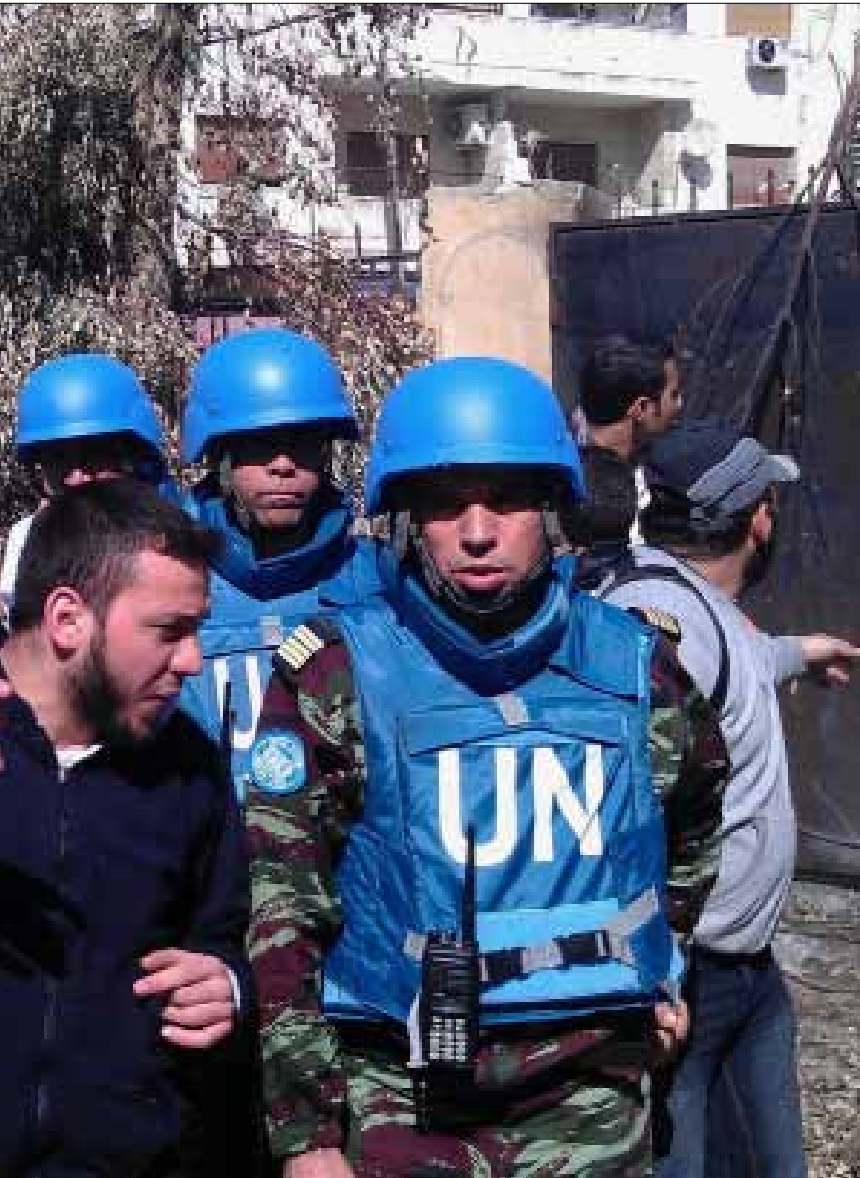
لماذا يستعمل المراقبون الدوليون مطار بيروت للانتقال منه برا إلى سوريا؟

ويوحي توصيف الدبلوماسي الروسي الأتف الذكر، بأن وصول المراقبين