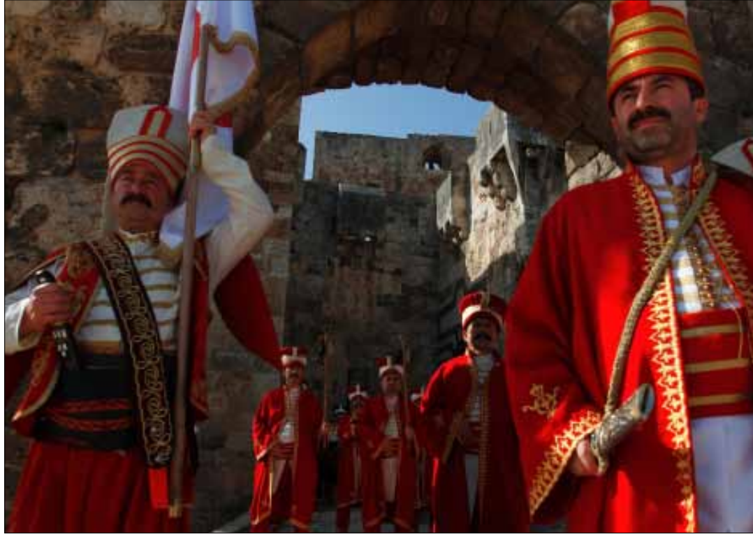
فرقة المهاترة التركية تحتفل في طرابلس بعيد تحرير المدينة من الصليبيين، العثمانيون بدل المماليك

لم يكن الصليبيون يريدوا معركتهم لولا تدخل سفن مدينة جنوى، فكان الهجوم برأ وبحراً ودمرت طرابلس. مقارنة بالفترات السابقة، لا بد من اعتبار الفترة الصليبية حقبة سوداء، لكن اعتبار أن ولادة المدينة جاءت مع الحكم الملوكي الذي حرر المدينة إنما هو قرار سياسي وطائفي بامتياز. فطرابلس تقرر ما لم تستطع الدولة أن تتماشى معه في كتاب التاريخ. قررت هويتها السياسية ذات اللون الواحد، وقررت أن انتماءها الطائفي الواحد، فوحدت المماليك بالعثمانيين في احتفالاتها ومحت من تاريخها وشوارعها باقي الطوائف والأفكار. تحتفل المدن بيوم يُختار من تاريخها، لكنها عادة ما تعتمد تواريخ توحد ولا تفرق!