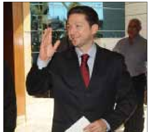
الوزير فيصل كرامي (عدنان الحاج علي)

أحدث قرار عدم تأمين الأموال لإجراء التحسينات في ملعب المدينة الرياضية صدمة أوجبت إعلان حالة طوارئ من قبل وزارة الشباب والرياضة لتأمين الأموال حتى لا يخسر لبنان حق استضافة مبارياته