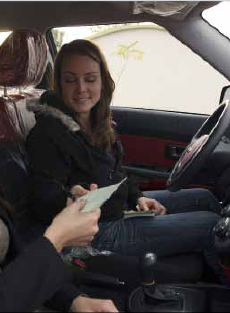
من الاغتراب اللبناني: شركة تاكسي «فسانية»، في اربيل العراقية

هكذا تؤثر تحويلات المغتربين بمالية الدولة التي هجرتهم