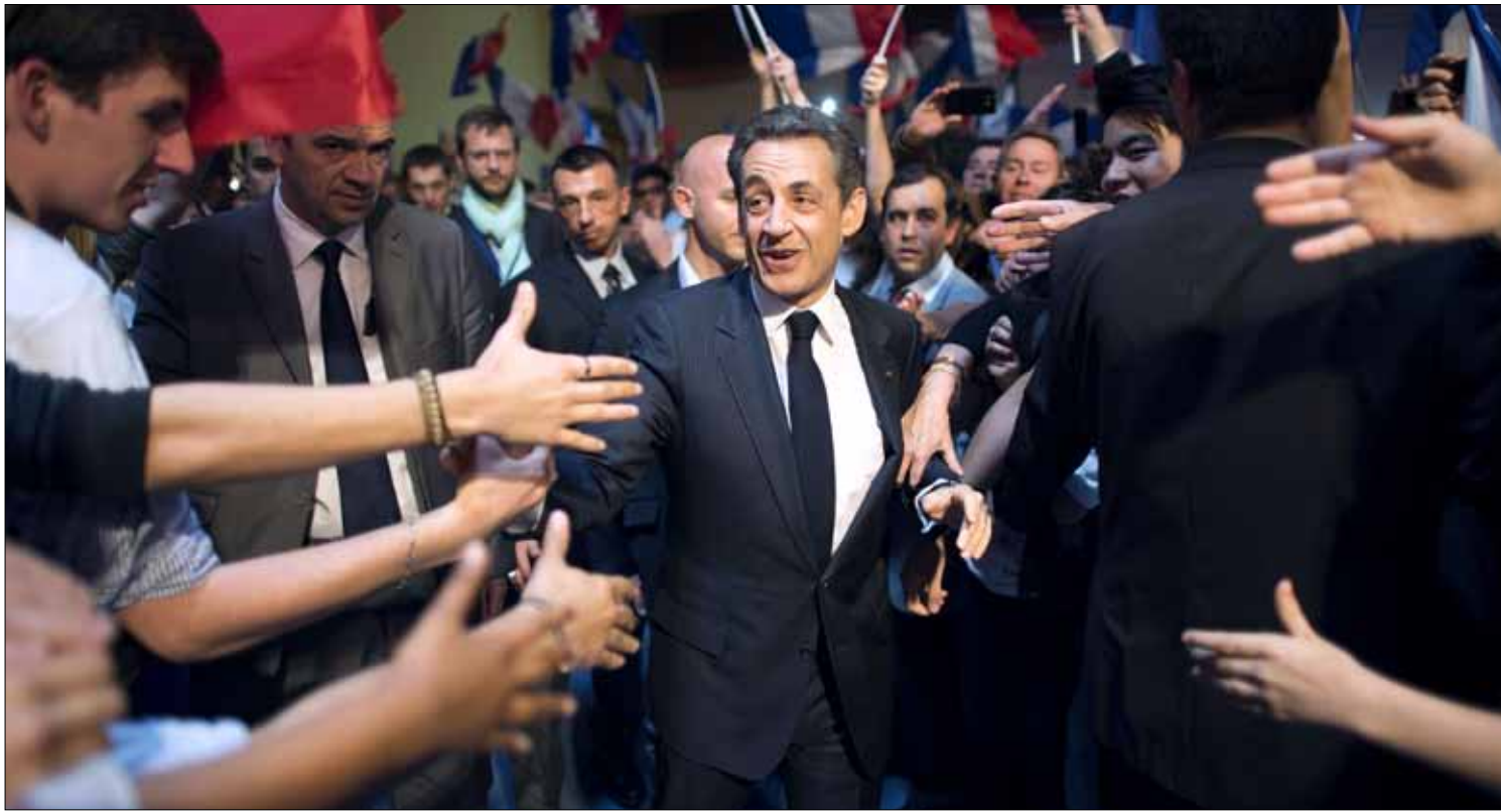
أرسل ساركوزي إشارات متعددة إلى ناخبي اليمين المتطرف تنوعت بين الوعود والوعيد

التركيز على مغالطة ناخبي اليمين المتطرف لا يحظى بالإجماع في ضيق ساركوزي