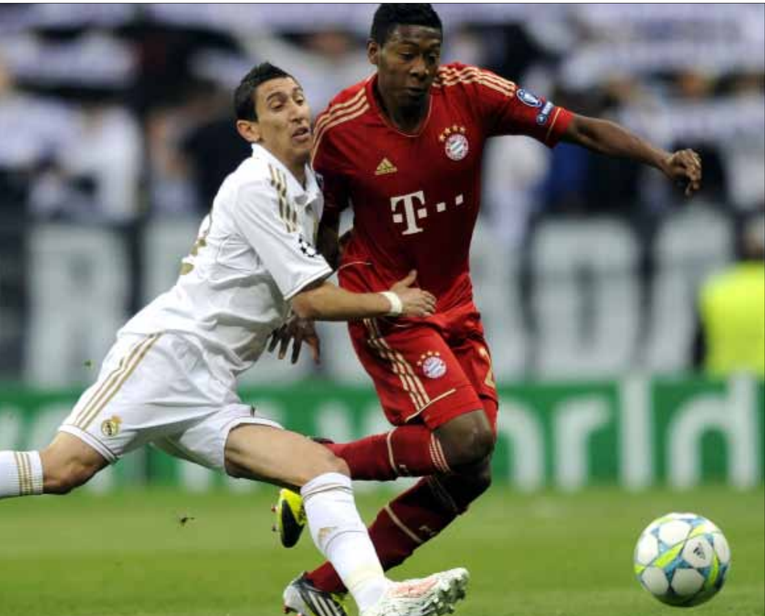
قدم ألبا دوراً حاسماً في «معركة الأروقة»، حيث أدى دوراً هجومياً ودفاعياً استثنائياً (بيار - فيليب ماركو - أ ف ب)

يواصل بايرن ميونيخ سياسة استقطاب اللاعبين البارزين في «البوندسليغا»، حيث أصبح مدافع بوروسيا مونشنغلادباخ البرازيلي دانتي آخر الصفقات، إذ أكد الطرفان انتقاله إلى الفريق البافاري في الصيف المقبل. ومن جهة أخرى، تأكد رحيل الكرواتي إيفيكا أوليتش عن بايرن إلى فولسبورغ في الصيف.