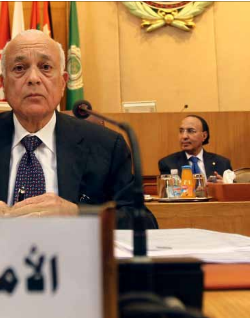
اجتماعات برعاية الجامعة لتوحيد المعارضة في 16 و 17 أيار

وزراء الخارجية العرب يقررون الطلب من مجلس الأمن اتخاذ قرار لحماية المدنيين تحت الفصل السابع، ثم يتراجعون عنه. هكذا يمكن اختصار الجلسة المسائية التي شهدتها القاهرة أمس، والتي قررت محاولة توحيد المعارضة مجدداً