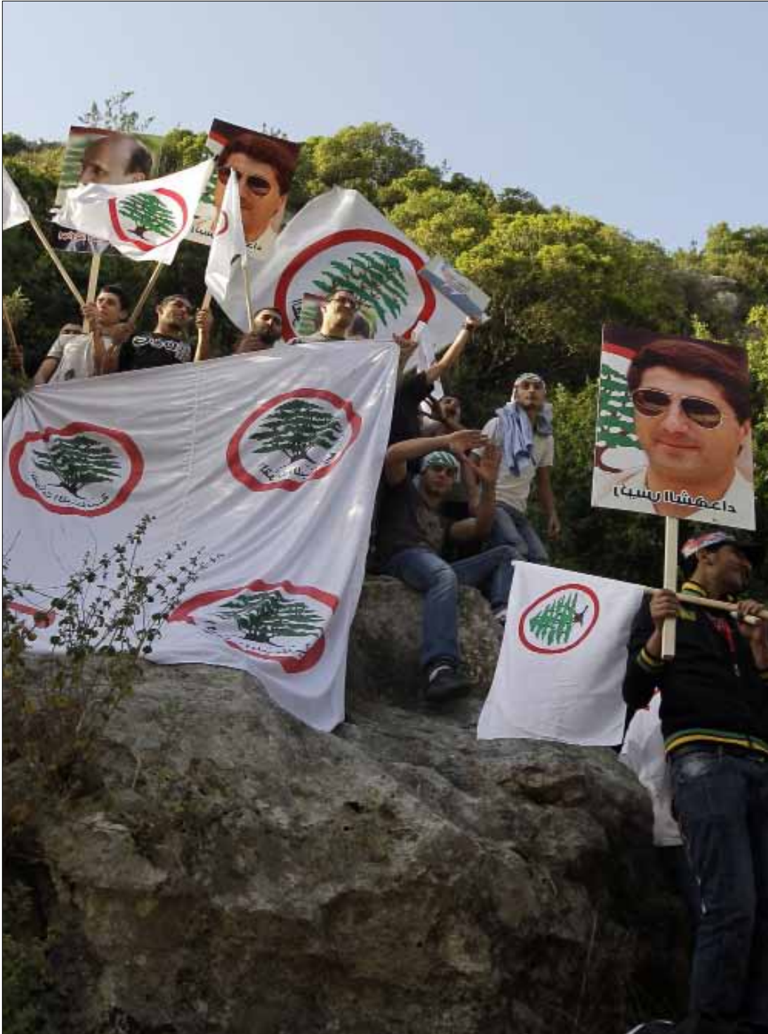
انصار القوات يحمون ذكرى انسحاب الجيش السوري في نهر الكلب امس

أبو منير مرّ من منيارة. في 26 نيسان، ذكرى انسحاب الجيش السوري من لبنان، يتذكر مساوئ الضباط السوريين من أكل ضربهم. أما الآخرون، فيروون قصصاً تضحك اليوم أكثر مما أبكت في السابق