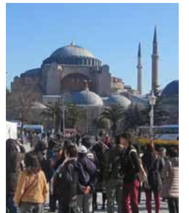
مدخل أيا صوفيا

قبل أن تدق عقارب الساعة التاسعة صباحاً، كانت طوابير السياح تمتد طويلاً عند مدخل متحف «أيا صوفيا» في مدينة إسطنبول التركية، تنتظر أن تفتح الأبواب. فإسطنبول، بأثارها التاريخية ومتاحفها وقصورها وأسوارها وأسواقها ومناظرها الطبيعية ومعابدها، هي متحف قائم في الهواء الطلق. تأسست المدينة في القرن السابع قبل الميلاد، ونالت لأكثر من 1400 سنة لقب «عاصمة الإمبراطوريات»، لأنها كانت عاصمة الإمبراطوريتين البيزنطية لألف سنة والعثمانية لأربعة قرون، فضلاً عن أنها تقع جغرافياً في قارتين هما آسيا وأوروبا، وهي ميزة لا