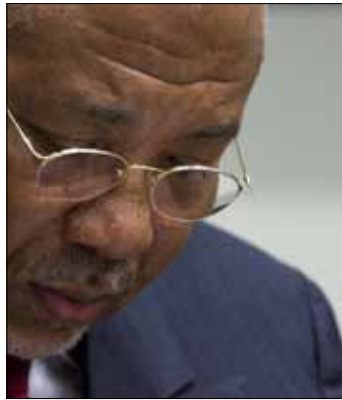
ناومي كامبل حصلت على «ماسة كبيرة» من تايلور

الأطفال. وتحولت هذه الحرب إلى صراع عرقي مع سبع فصائل تتقاتل جميعها للسيطرة على الدولة وفرواتها. غير أن الشخصية المليئة بالمفارقات تمكنت من قطف ثمار هذه الجرائم بعد نحو ثماني سنوات، ففي العام 1997 وبعد توقيع اتفاق سلام برعاية الأسرة الدولية في بلاده، انتخب الليبيريون تايلور رئيساً. منصب لم ينعم به الرجل طويلاً، إذ تغيرت الأوضاع في غير مصلحته بعد عامين من انتخابه، وبدأت حركة تمرد جديدة من شمال البلاد تطالب بالديموقراطية. وبحكم أن تايلور لم تكن تربطه علاقة ود بالولايات المتحدة التي سجنته سلطاتها في السابق، قامت الأخيرة بدعم حركة التمرد التي تمكنت من مراهمة العاصمة منروفيا، بعد حصار دام 3 أشهر، واجباره على التنحي ومغادرة البلاد في 11 آب 2003. وكان قد سبق هذا التنحي الاتهام