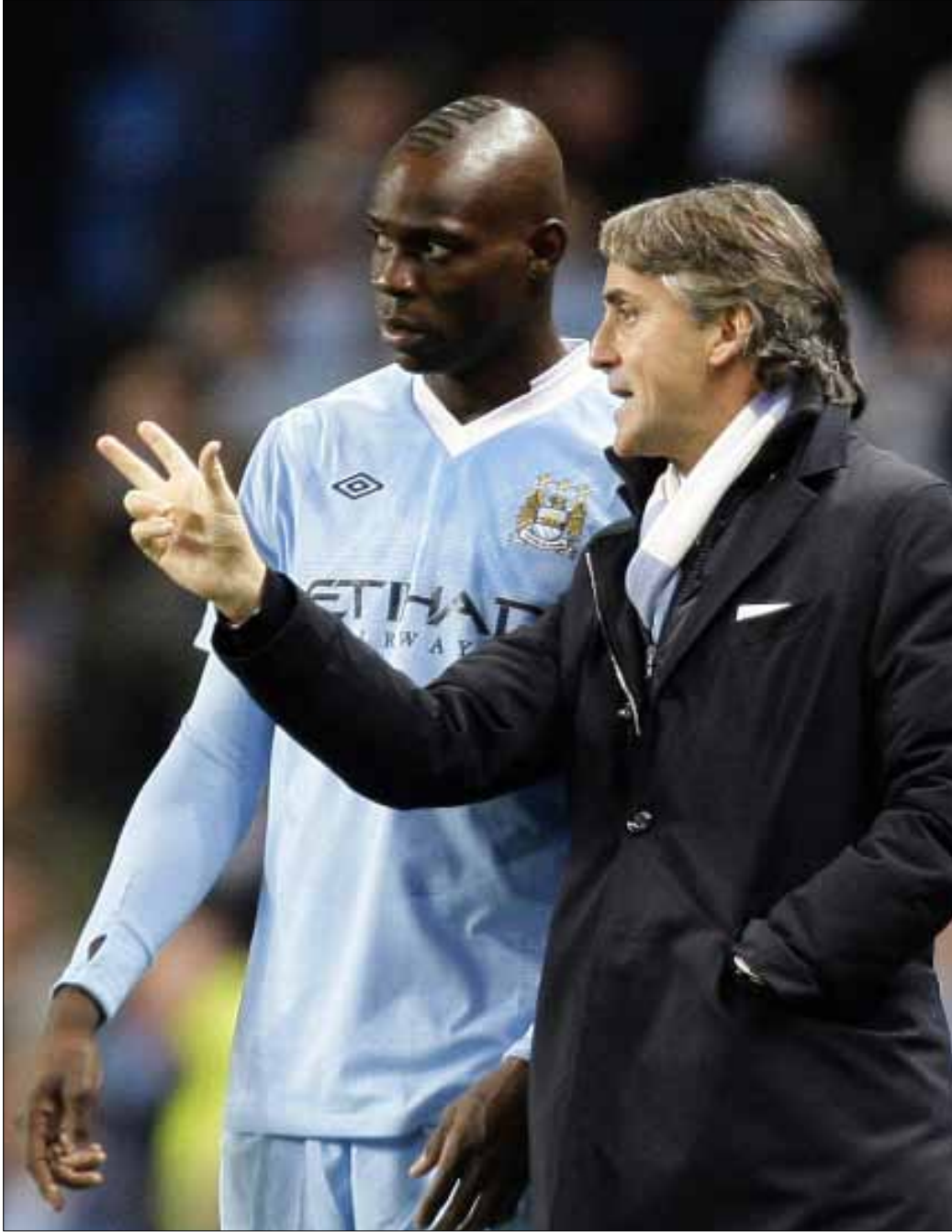
يتحمل مانشيني مسؤولية ما آلت إليه أمور بالوتيلي لفشله منذ زمن بعيد في وضع حدّ لتهووره

اعتبر الهولندي نايجل دي يونغ، لاعب مانشستر سيتي، أن مانشيني هو السبب في استمرار مواطنه بالوتيلي مع الفريق ولولاه لكان رحل منذ زمن بعيد. ويعتقد دي يونغ أن «سوبر ماريو» يعاني من ازدواجية في شخصيته، فأناً لصحيفة «ذا صن»: «في بعض الأحيان، ماريو يكون أحمقاً وفي أوقات أخرى يكون عبقرياً. هناك جانبان في شخصيته».