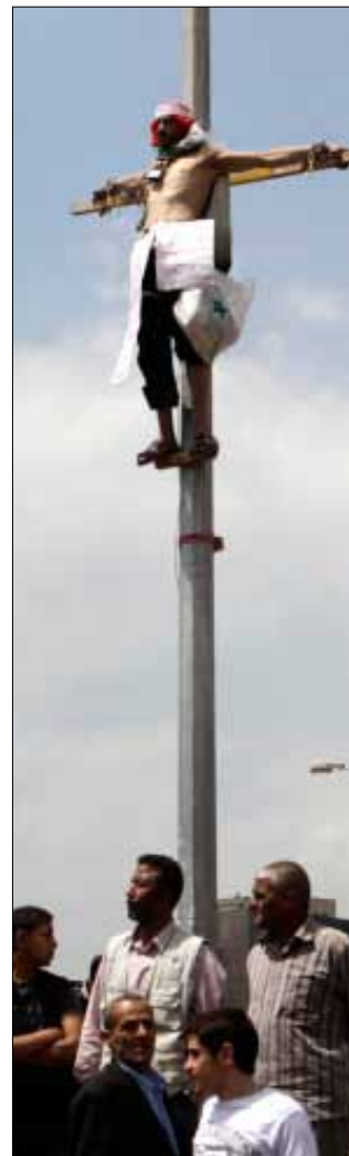
مصري صلب نفسه على أحد أعمدة الأنازة في ميدان التحرير أمس احتجاجاً على مضايقات أمنية يتعرض لها