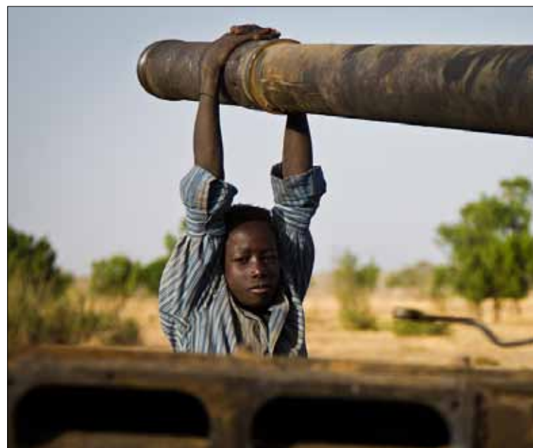
دعوات لضبط النفس وإيقاف الاشتباكات على طرفي الحدود