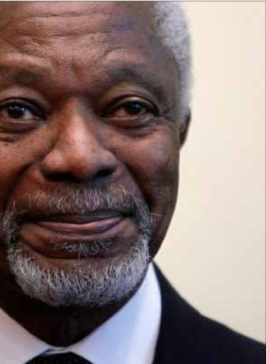
تظهر المراسلات الخاصة بين أنان والمعلم، عن طبيعة الأساس الهش الذي تقف عليه مهلة 12 نيسان (دنيس

الشق الأول احتوى على رؤيته لما يجب فعله بخصوص النقطة الثانية من خطة النقاط الست، أي التزام وقف القتال، رغم ان التصور عرض لكل النقاط الست. وبالنسبة إلى النقطة الأولى الخاصة بالعملية السياسية، اعتبر أنان في تصوره «أن من الضروري ان تعمل الحكومة السورية على توفير ظروف يمكن معها ان تتقدم هذه العملية بنحو ملموس». وهذا يكون عبر تنفيذ باقي النقاط، ومنها في هذه المرحلة النقطة الثانية الداعية إلى وقف العنف، التي