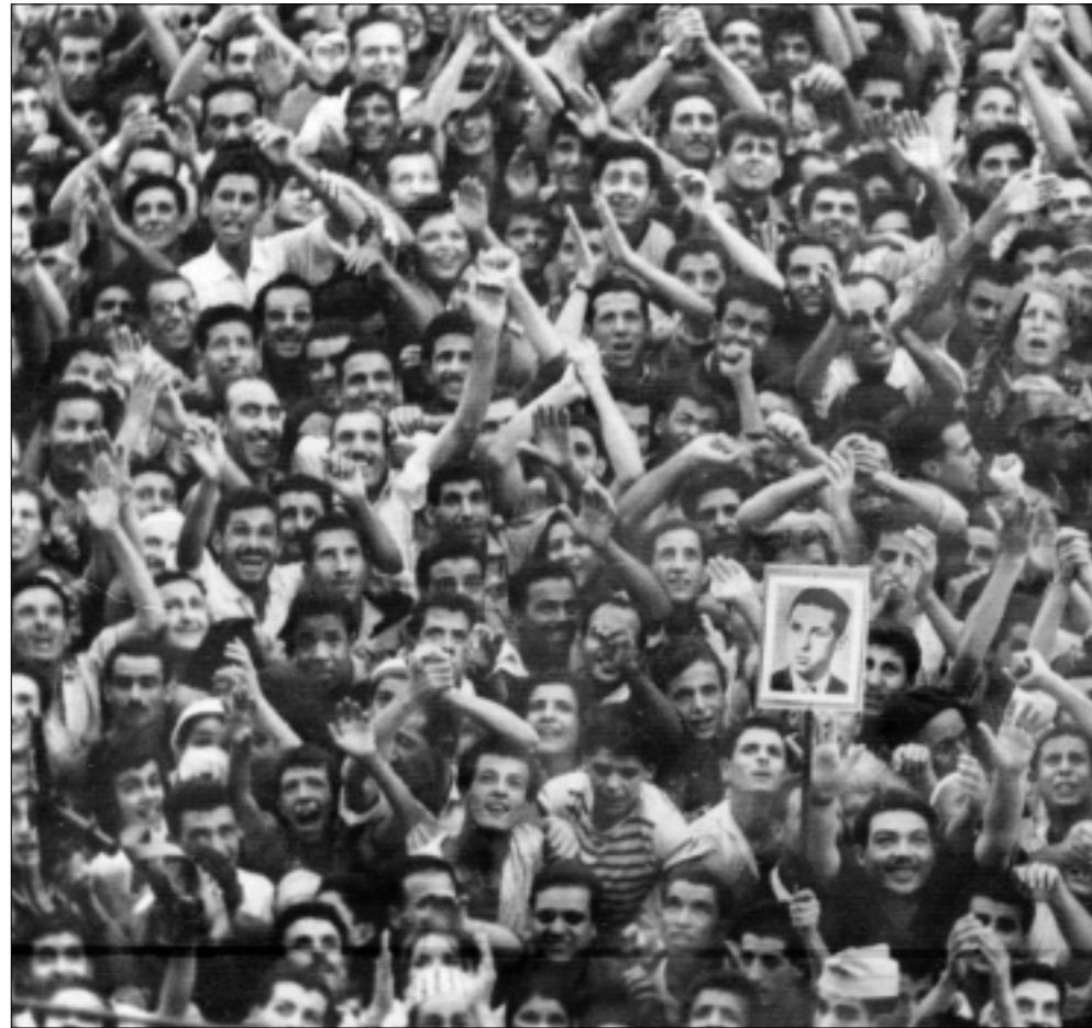
اسهمت الصلوات الوثيقة التي ربطته بالرئيس عبد الناصر في بروز بن بله

قاده وزير الدفاع، العقيد هوارى بومدين، في 19 يونيو 1965، ليودع بن بله السجن إلى غاية وفاة بومدين، سنة 1979.