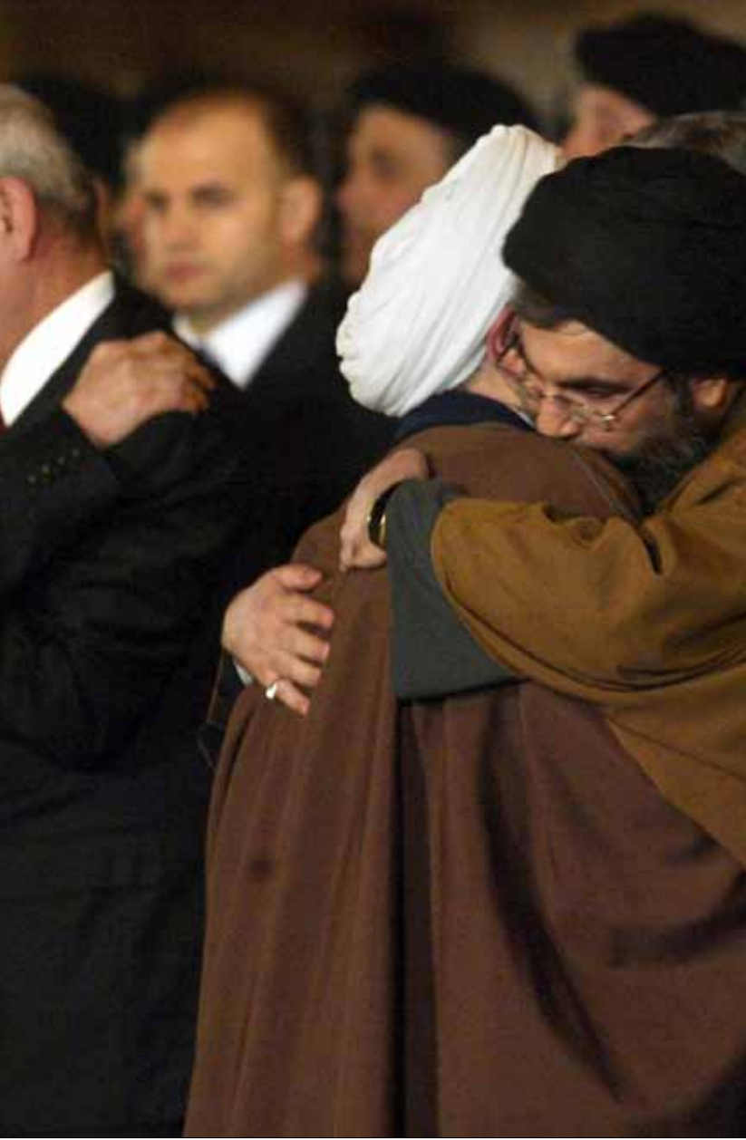
استعاد لبنان عام 2004 رفات 59 لبنانياً و24 من جنسيات أخرى

الرئاسي حاسماً، وخصوصاً أن العملية التي قام بها المقدمي، كانت «تأرية لاغتيال أبو جهاد الوزير في تونس»، يقول مسؤول الاتحاد التونسي للشغل قاسم عسيت. رفضت العائلة القرار، فالشهيد يلقى به الاحتفال لأنه شهيد... وأعزب. بقيت على رفضها، فبقي هو في مدفن الشهداء