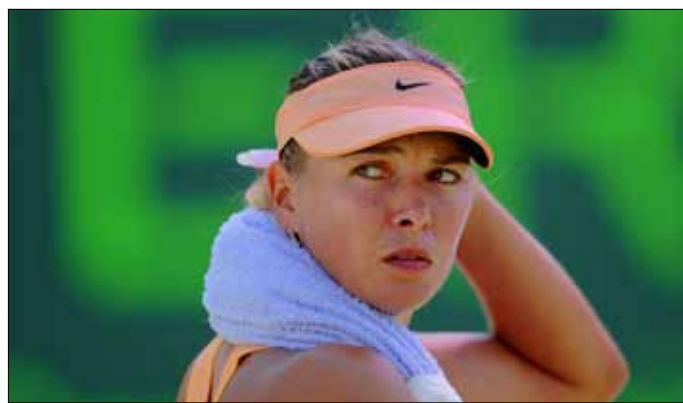
الروسية ماريا شارابوفا

على الإسباني دانيال خيمينو ترافر 6-2 و 5-7 و 1-6. وكان فيش قد أعفي من منافسات الدور الأول على غرار بقية المصنفين الأوائل. وبلغ الدور الثاني الأرجنتينيان