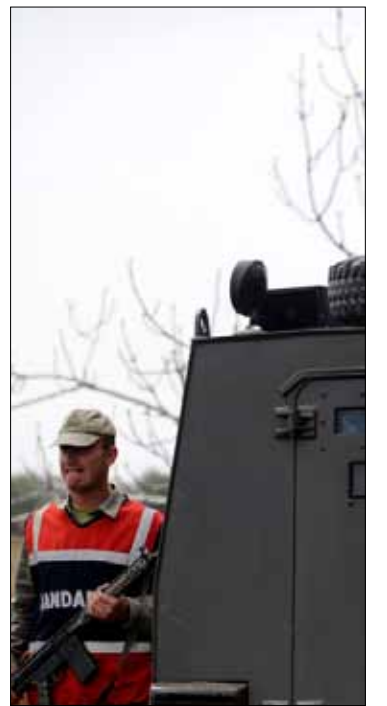
اجراءات عسكرية تركية أمس على الحدود مع سوريا

رد المعلم على تصور انان برسالة جوابية، جاءت أيضاً على شكل شقين: الاول بشأن تنفيذ النقطة الثانية المطروحة راهناً للتنفيذ. واعلنت الرسالة ان الحكومة السورية «تلتزم فقط، بالخطة التي وضعتها لسحب وحدات عسكرية من داخل الأحياء ومحيطها وذلك خلال الفترة