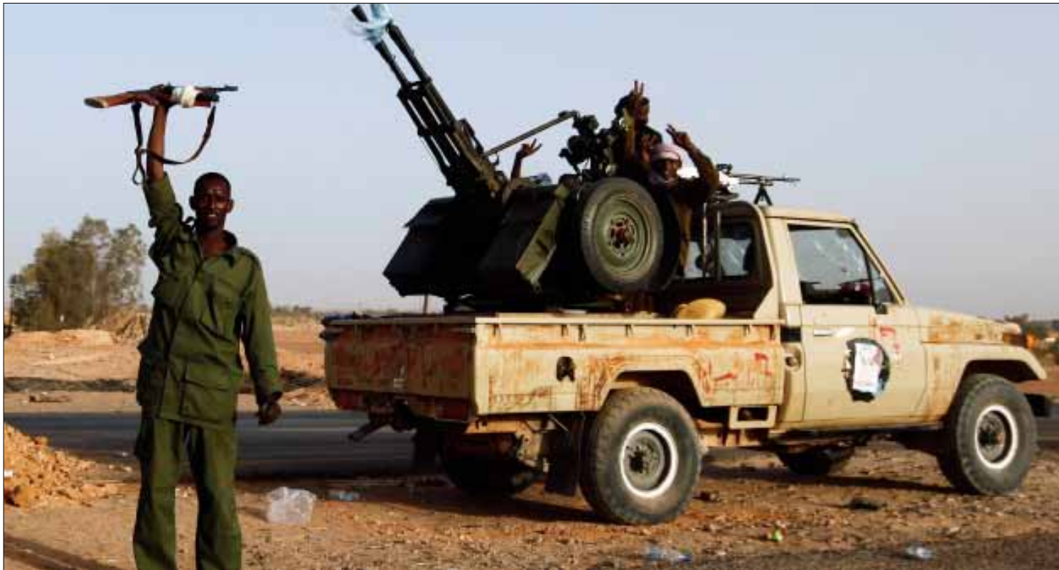
مقاتل من قبيلة التبو في سبها

لا حقيقة لوجود أجنحة خارجية لإنسان تانه في الصحراء حكمت عليه الجغرافيا بالعزلة