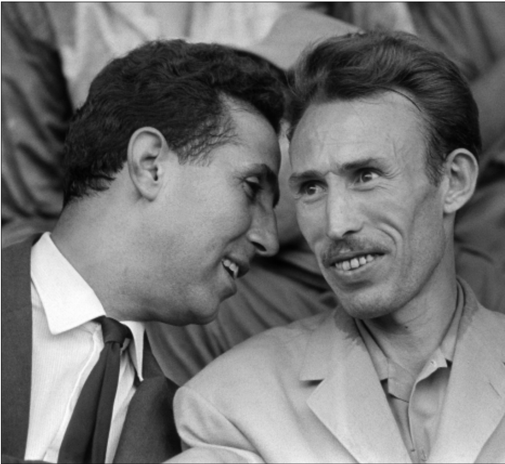
بن بله وهوارى بومدين عام 1962

للبلاد بعد الاستقلال عن فرنسا، سنة 1963، قد تدهورت على نحو مفاجئ، خلال الأسابيع الماضية. برحيل «غيفارا الجزائر» تُطوى صفحة عمرها قرابة قرن من النضال الوطني من أجل