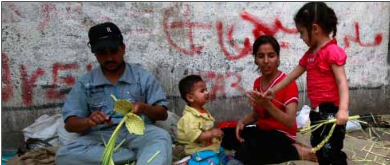
تحضير سفح النخيل للفصح امام كنيسة قبطية في القاهرة

للأسرار، وعدم اعترافه بجرائم النظام. الثورة لم تقم من أجل إعادة التجربة الرومانية أو الروسية فيحتل مدير الاستخبارات مقعد سيده، أو يحافظ مجلس الديناصورات الميتة على نفوذه وقوته، رغم رائحة موته النفاذة. هم ميئون ويريدون حكم شعب عاد للحياة بعد غيبوبة 60 سنة في مآهات الجمهورية الأبوية. عاد عمر سليمان عكس حركة التاريخ. الثوار حركوا التاريخ لتحطيم دولة الفرعون وكهننته. أياديهم ما تزال غضة، وطرية، لكن أرواحهم تكس سوراً وراء سور، كلما انهارت دولة الأسرار، بعدما دخل المجتمع على الخط. لكن حراس الأسرار يعملون، وتجار الدولة يخرجون الآن ليبيعوا الخوف. يقول عمر سليمان: لا بد أن تعود هيبة الدولة. ونحن نقول له: لا بد أن تعود الدولة التي خطفها عصابة كانت في حمايته، لا بد من التخلص من العصابة لا البحث عن رئيس جديد للعصابة. إنها حرب قطاع الطرق، وليست انتخابات الرئاسة.