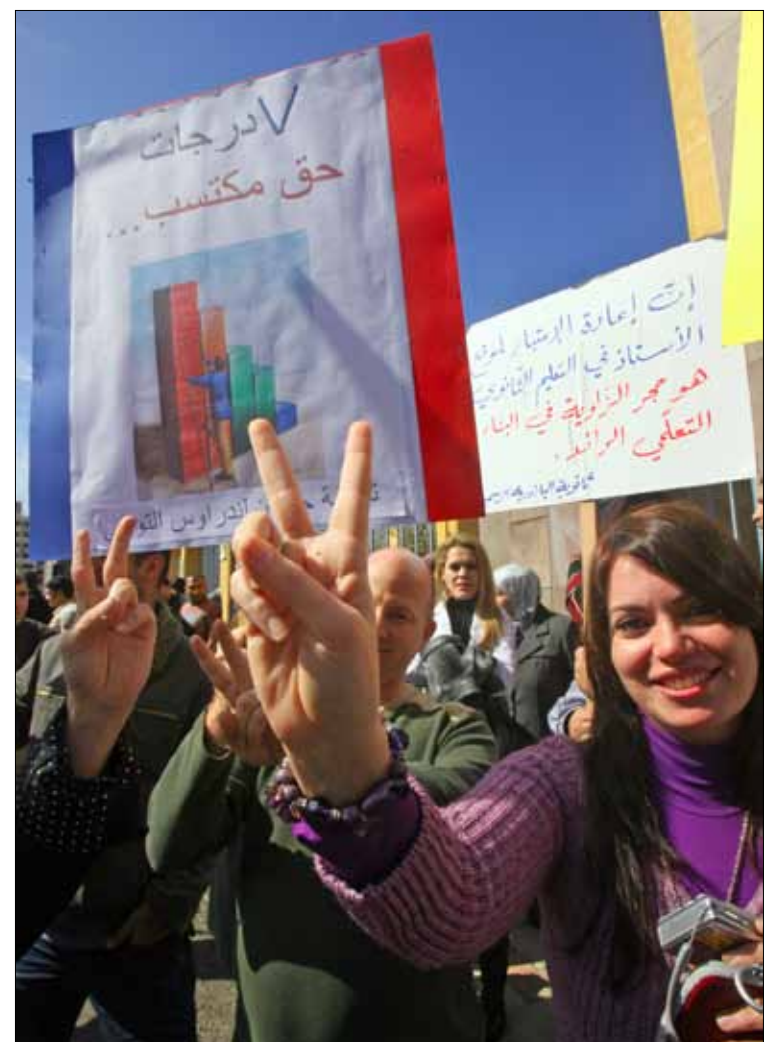
طاول الاختلاس الأساتذة من جميع المناطق

770 مليون ليرة لبنانية هي قيمة الأموال المختلصة من 340 أستاذاً ثانوياً نتيجة ضم خدماتهم. الرقم أعلنته رابطة أساتذة التعليم الثانوي الرسمي، مطالبة بإعفاء الأساتذة من الدفع ثانية ومحاكمة المرتكبين