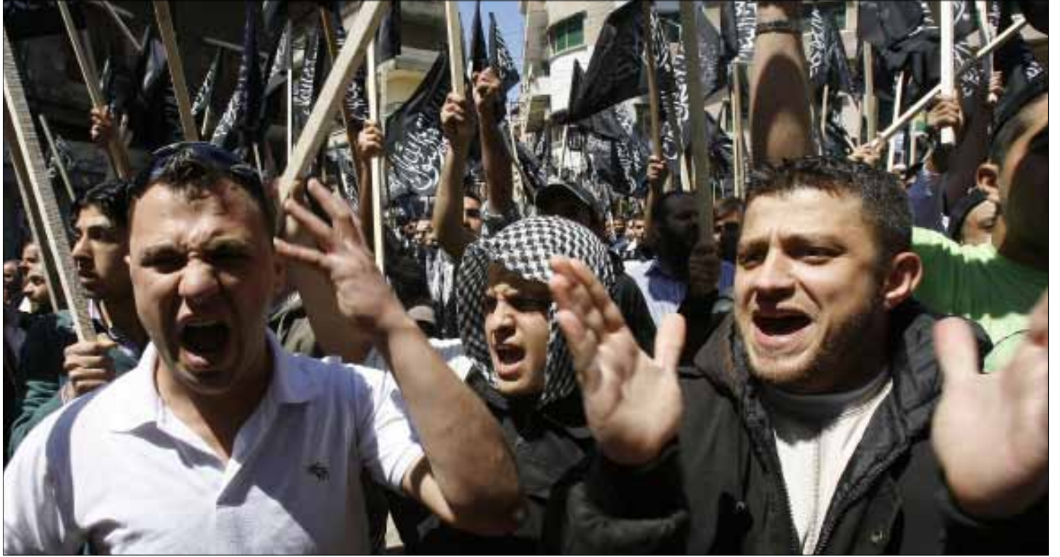
بقي الملف السوري حاضراً في نقاشات اللقاء.

تحدّيان يواجهان «لقاء الحوار الإسلامي» في طرابلس. الأول انسحاب بعض القوى منه مثل حزب التحرير على خلفية عدم اتخاذ موقف من الملف السوري. والثاني انزعاج تيار «المستقبل» من اللقاء المقرب من رئيس الحكومة وسعيه الى إنشاء لقاء مواز تحت عباءته