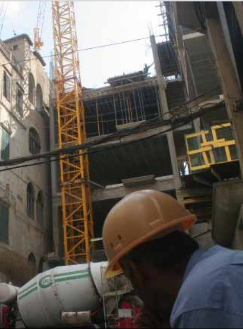
سوق العقارات تشهد تراجعاً كبيراً في رؤوس الأموال

وجود عملية استطلاع متواصلة من قبل الزبائن، لكن غالبيتها لا يصل إلى مرحلة إتمام الصفقة؛ كل الحديث المتداول بين هؤلاء يتمحور حول صفقات بيع بالمفرق سواء لأرض أو عقار مبنى... رغم ذلك، يعمل عداد الصفقات في مجالسهم بصورة مستمرة: «ذاك التاجر الكبير لم يبع منذ أكثر من سنة ونصف سنة أي شقة في المباني التي يشيدها في بيروت، وذاك التاجر تمكن من بيع شقتين فقط...». وفي السياق نفسه، تكاثرت الشائعات عن «شيفان» السوق من رؤوس الأموال الخارجية، إلى درجة تناقل حديث أحد المستشارين العقاريين لعائلة معروفة تعمل