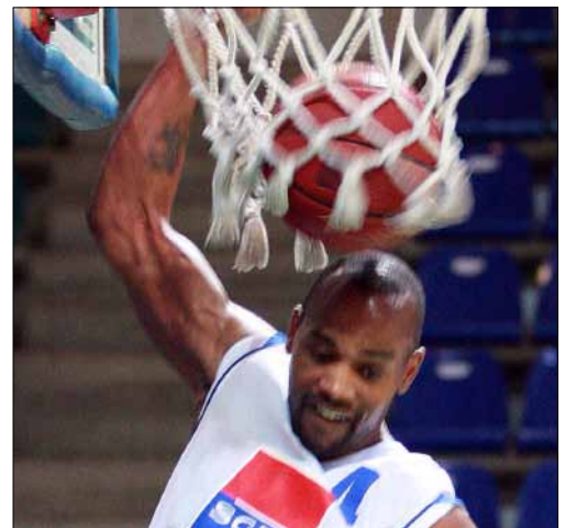
من لقاء المتحد وهوبس

سجل الاتحاد اللبناني لكرة السلة سابقة على صعيد العمل الإداري مع إرساله مقررات لجنته الإدارية على أجزاء، في وقت اختتمت فيه أمس مباريات المرحلة الخامسة من «فاينال 8» بطولة لبنان