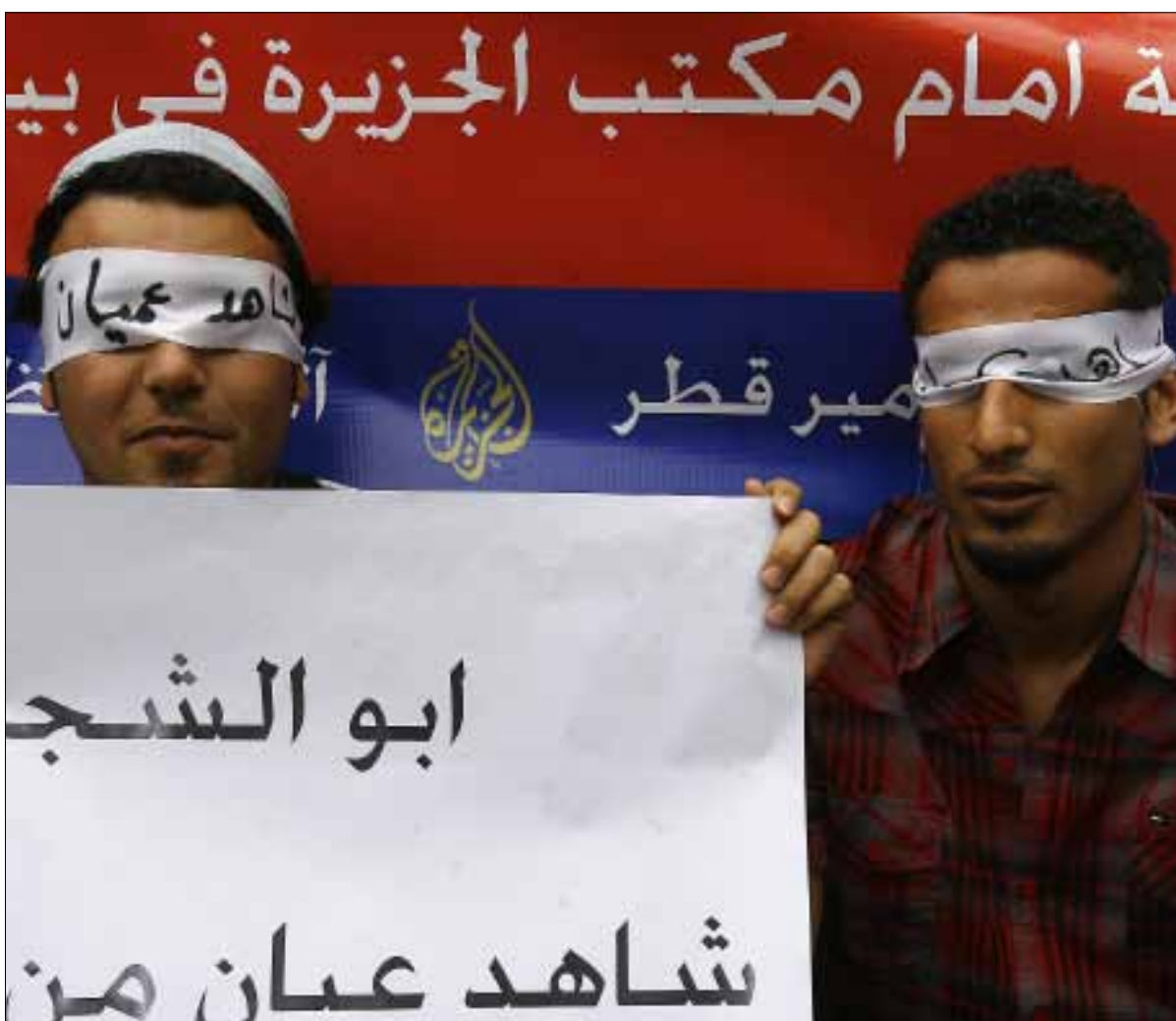
من تظاهرة أمام مكتب القناة في بيروت

هنا، دخلت «الجزيرة» مرحلة مختلفة في التعاطي مع الانتفاضة السورية، سرعان ما حولتها إدارة المحطة إلى ثورة حقيقية، تصدرت أحداثها وتفاصيلها النشرات الإخبارية. تناولها المفكر عزمي بشارة في برنامجه «حديث الثورة» الذي كان يبيت مساء كل يوم جمعة، شارحاً ومفضلاً حقائق وخفايا كثيرة لمتابعي المحطة، بعدما كان يتجاهل الشأن السوري ويتهزّب من أسئلة المذيع. وتوالى استقالات المذيعين والإعلاميين في المحطة التي بدأت رحلة ابتعادها عن المهنية ودخولها في وحول السياسة. وربما غفر للقناة أخطاءها اليومية بأسماء المناطق والجهل الواضح بجغرافية البلد الذي توليه الأهمية والمساحة الكبرى من تغطيتها. مثلاً، أذاعت خيراً لم يقلت من المبالغة والتهويل عن انفجار مدوّ في «مقر قيادة حزب البعث في الميدان» وسط دمشق، بينما كانت الحقيقة هي انفجار قنبلة صوتية بالقرب من مبنى فرع