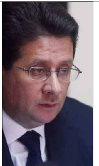
ابراهيم كنعان

هذه اللقاءات وتفعيلها فإنه سيقول رئيس حزب القوات سمير جعجع، من دون ان يعني ذلك خرق لائحته الانتخابية، بل مجرد إشغال القوات التي تنصرف عادة بناءً على أن نتيجة قضاء بشري محسومة.