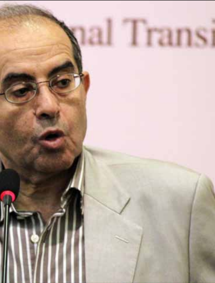
محمود جبريل وصل الى العراق في زيارة مفاجئة

استحقاقات مهمة وتحديات صعبة تنتظرها ليبيا خلال الشهور المقبلة، لعل أهمها انتخابات المؤتمر الوطني في حزيران المقبل. لكن في رأي رئيس الوزراء السابق محمود جبريل، فإن البلاد تواجه ثلاثة سيناريوات لا تخلو من المخاطر