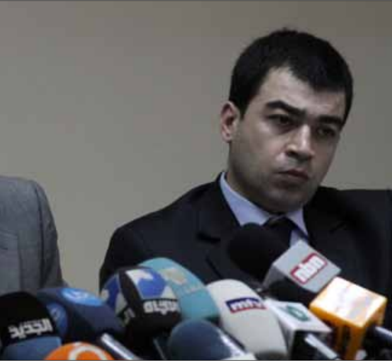
إيران تجدد عرضها الكهربائي والبدء خلال اسبوع من طلب الحكومة (أرشيف)

لم يحجب دخان الاشتباكات السورية - السورية قرب مشاريع القاع الحدودية التوتر الكهربائي العالي بين رئيس الحكومة ووزير الطاقة الذي رد بـ «تقرير البواخر» المسهب على «خطة المعامل» لتكون الكلمة الفصل لمجلس الوزراء، أو يجمد الخلاف لـ «مزيد من التشاور والبحث»