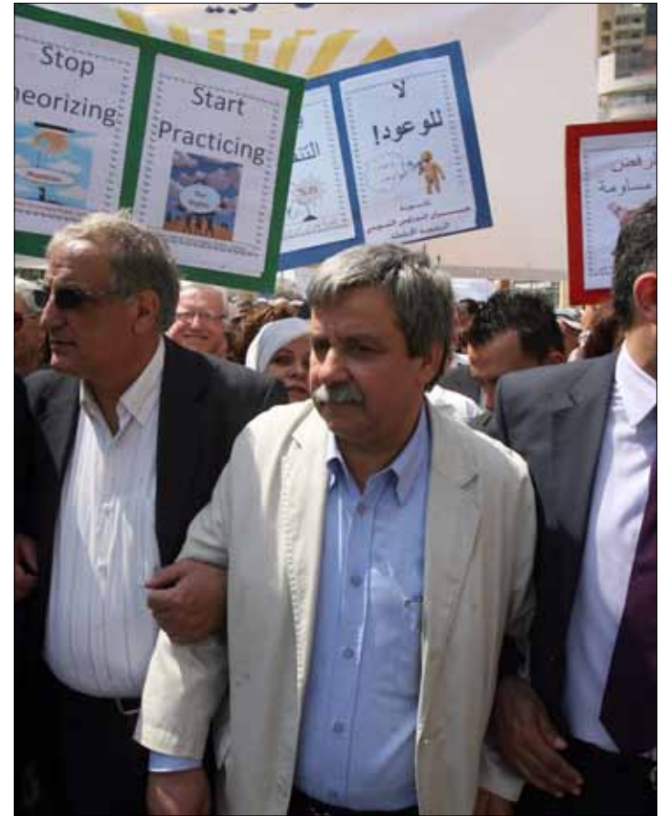
يلوح الأساتذة باستعادة مشهد تحركهم الفانت

نتجه رابطة أساتذة التعليم الثانوي الرسمي لتنفيذ برنامج تحرك تصعيدي ومدتج خلال نيسان وأيار لا يستبعد مقاطعة الامتحانات. هذا ما أفترته الرابطة بعد إضراب تحذيري شل الثانويات الرسمية من أن يترجم المطالب إلى مشاريع ملموسة