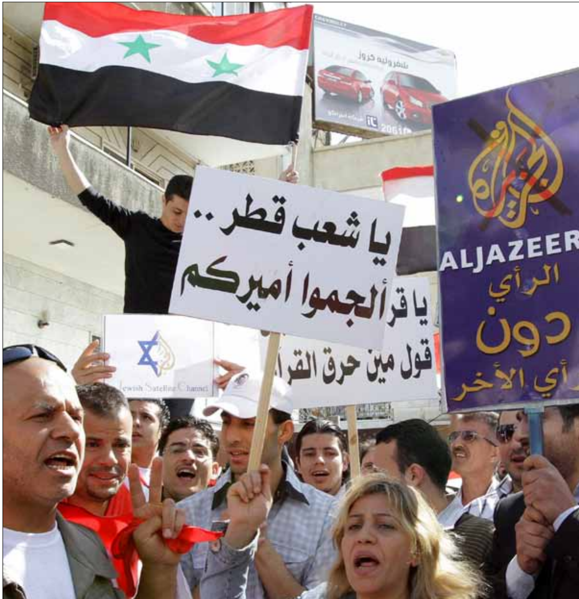
من تظاهرة في دمشق

لكنّ البند الأهم في تعميم هلال كان تشديده على عدم إبداء المحطة أي معارضة في أدائها التحريري، لقضية التدخل الأجنبي في سوريا، وعدم التشكيك في أغراض الجيش السوري الحر وإبراز دور المعارضين، وخصوصاً من ذوي الأقليات. هكذا، تغيرت لهجة هلال، ولم يعد يرى أي شوائب في أداء هذه القناة التي نجحت في أحد الأيام في التربع على عرش الإعلام العربي قبل أن تتحول إلى فرع من فروع الديوان الملكي.