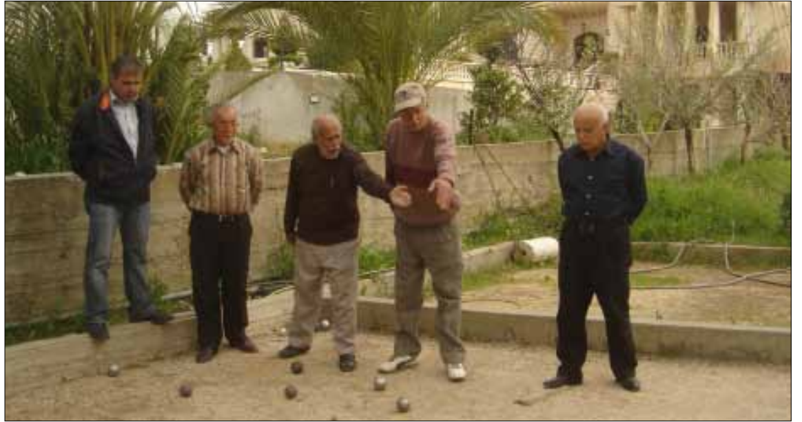
يشارك شباب القرية من غير المغتربين في هذه اللعبة

بدأت صباح أمس في فندق جفینور - روتانا أعمال «المؤتمر الإقليمي لدول الشرق الأوسط لدعم مفاوضات معاهدة تجارة الأسلحة»، بدعوة من «معهد الأمم المتحدة لبحوث نزع السلاح» وحضور ممثلين عن 14 دولة عربية ومنظمات دولية وإقليمية. أكد ممثل وزير الخارجية اللبناني عدنان منصور، السفير منصور عبد الله، في كلمة الافتتاح أن «الاحتلال الإسرائيلي لأراض لبنانية وعربية يستفيد من المساعدات الخارجية، سواء اتخذ هذا الدعم شكل شحنات أسلحة، أو تكنولوجيا تصنيعها. بينما تتهم حركات التحرر والمقاومة بأنها حركات إرهابية تسعى إلى تبيد فرص السلام العادل والشامل». من جهتها، ذكرت رئيسة بعثة الاتحاد الأوروبي في لبنان أنجيلينا إيخورست في كلمتها أن «كميات كبيرة من السلاح المنتشر في الأسواق السوداء يدخل التجارة العالمية عبر قنوات شرعية، وتحوّل في مراحل متقدمة إلى جهات غير مخوّلة أو شرعية». وذكر رئيس اجتماعات اللجنة التحضيرية لمعاهدة تجارة الأسلحة الأرجنتيني روبرتو غارسيا موريتان أن «60% من السلاح الموجود في مناطق النزاعات في العالم صنع في الدول الكبرى كأمانيا وفرنسا والولايات المتحدة وروسيا». تستمر أعمال المؤتمر حتى الخامسة من عصر غد الخميس، على أن يتحدث ممثل عن البعثة الأوروبية ولبنان في الجلسة الختامية.