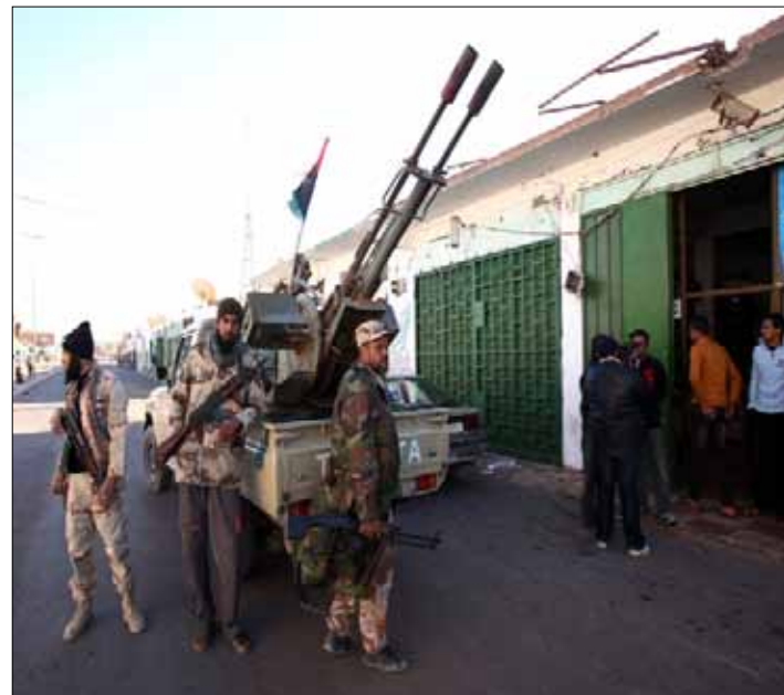
مسلحون ليبيون في منطقة الكفرة جنوب ليبيا

أدى اختطاف موظف في شركة الكهرباء الليبية وقتله على أيدي رجال من قبيلة التبو، يوم الأحد الماضي، إلى سقوط 31 قتيلاً في اشتباكات تواصلت حتى وقت متأخر أمس، بين رجال تابعين للقبيلة ومسلحي المجلس الوطني الانتقالي، فيما تصاعد الموقف أمس مع اتهام زعيم قبيلة التبو، عيسى عبد المجيد منصور، السلطات الليبية الانتقالية أمس بتدبير خطة «للتطهير العرقي» تستهدف قبيلته، ملوحاً للمرة الأولى بالانفصال، بعد أسابيع قليلة من إعلان مجلس برقة