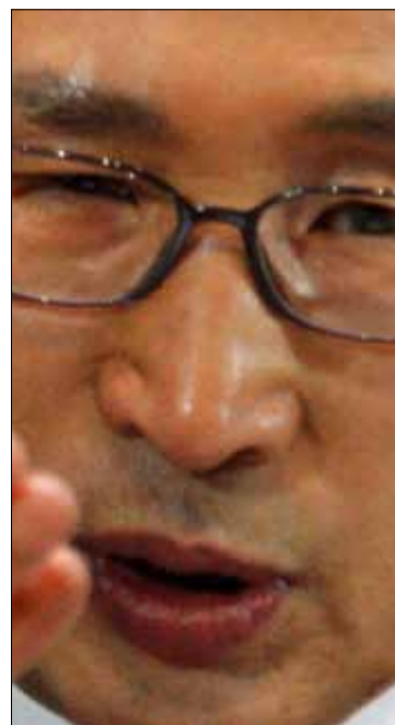
الرئيس الكوري

تعهد قادة الدول الذين شاركوا في قمة الأمن النووي في العاصمة الكورية سيول باتخاذ إجراءات حازمة لمكافحة الإرهاب النووي، بما فيها الحد من الاستخدام المدني لليورانيوم العالي التخصيب