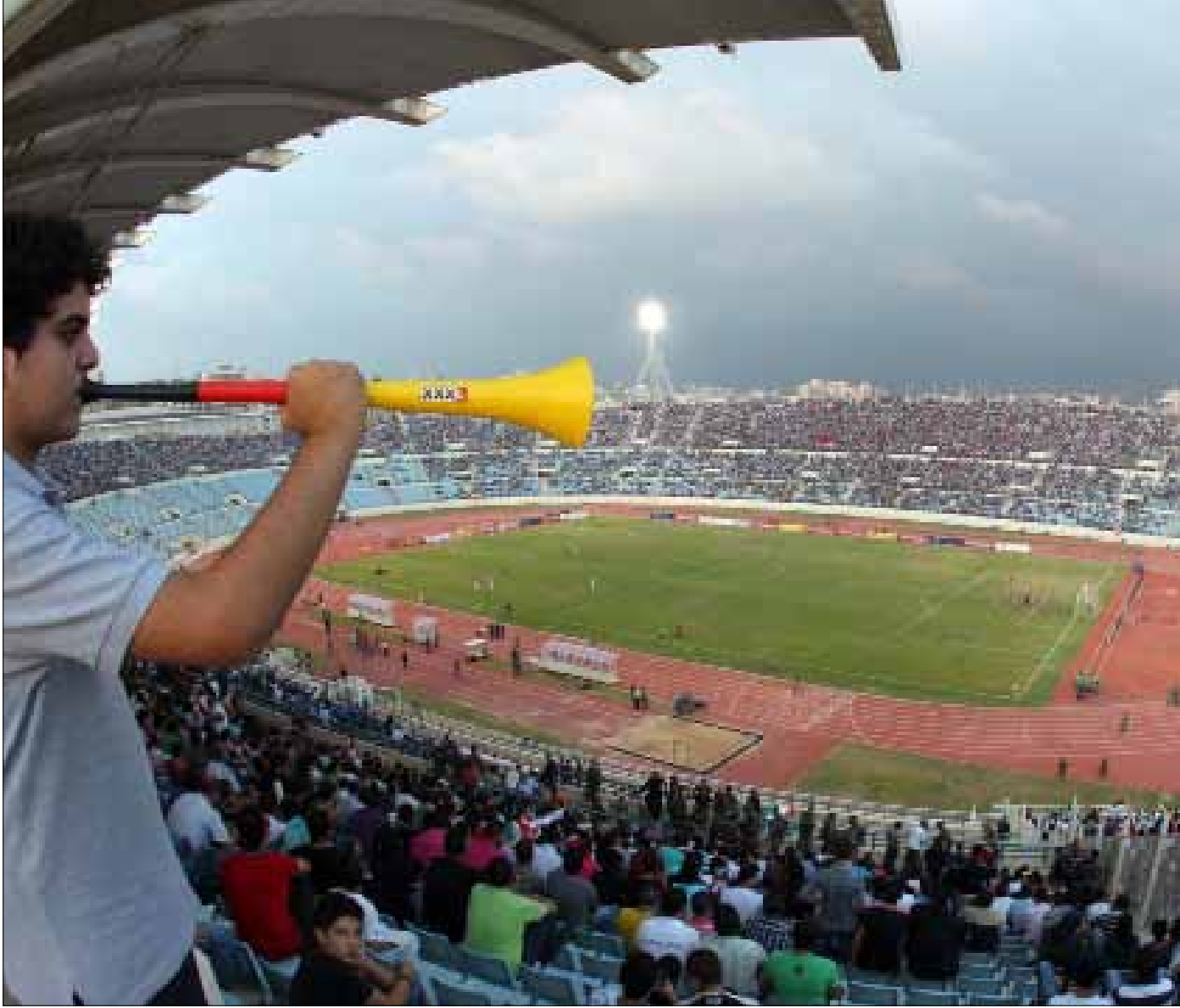
يحتاج ملعب المدينة الرياضية الى تحسينات كثيرة ليستضيف مباريات لبنان على ارضه

يخوض منتخب لبنان لكرة القدم اليوم تمرينه الثاني منذ لقاء الإمارات، حيث من المفترض أن تعقب التمرين حركة تغييرات على صعيد اللاعبين، فيما تسود حالة من الاستياء لدى اللاعبين حول مكافآت التأهل، ووصلت تردداتها من الصين أيضاً