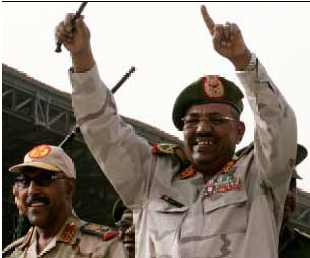
في أحد استعراضات البشير في الخرطوم

وأكدت الخرطوم سيطرتها على منطقة هجليج بعد هجوم قالت إن الجيش الشعبي، التابع لدولة جنوب السودان، نفذته على المنطقة أول من أمس، نافياً حديث جوبا عن سيطرتها على هجليج