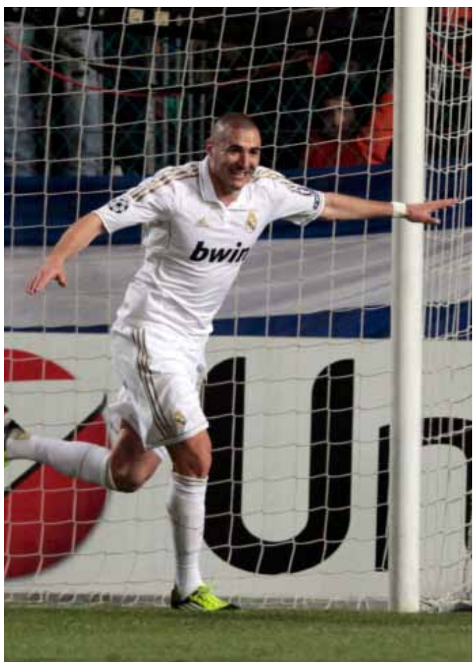
بنزيما محتفلاً بتسجيله احد هدفيه

طيابه كثيراً من الدبلوماسية و«جبر الخواطر»، وهذا ما كان جلياً حتى قبل انطلاق المباراة عند الكشف عن تشكيلتي الفريقين حيث زج «مو» بمهاجميه الفرنسي كريم بنزيما والارجنتيني غونزالو هيغواين معاً، وهي من المرات النادرة هذا الموسم التي يفعل فيها ذلك، وهذا ما يوضح انه كان مستخفاً بخصمه.