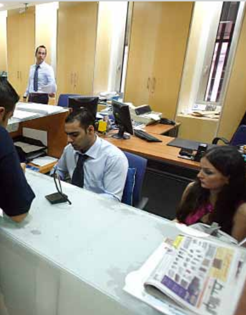
الفوائد على الودائع لن تزيد

مكرم صادر: المصارف، تخسر بين 1,6% و1,8% من توظيفاتها باللييرة