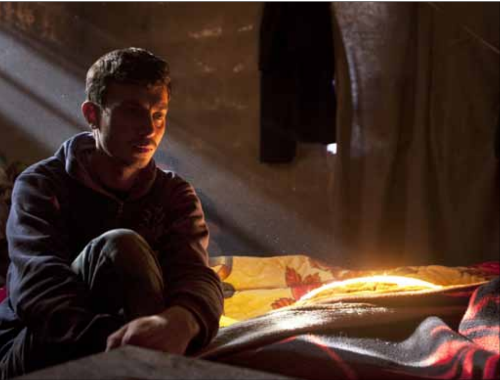
مقاتل مع «الجيش السوري الحر» في ادلب بداية الأسبوع

قد عانى انهياراً زراعياً كبيراً، توضح أن نسبة المتضررين اقتصادياً هم كتلة هائلة (المجموع هو قريب من 80% من الشعب)، هي بالتأكيد ليست مع السلطة. خلال أول تظاهرة في سوق الحميدية، اعتُقل بعض من شارك فيها، لكن المحتجين في درعا يوم 18 آذار 2011، الذين طالبوا بمطالب محلية، منها الإفراج عن أطفال معتقلين، وكف يد الأمن عن النشاط الاقتصادي لكونهم في «أراض حدودية»، ووجهوا منذ اللحظة الأولى بالرصاص. وهو الأمر الذي أوضح السياسة العامة التي تريدها السلطة، التي قررت المواجهة العنيفة، من اللحظة الأولى، خوفاً من انفلات الشارع والسيطرة على الساحات، لأنها تعرف ماذا فعلت بهذا الشعب. بمعنى أن القرار الأول لديها كان استخدام السلاح، ولذلك احتاجت إلى «مبرر» يغطي هذا العنف، الأمر الذي أفضى إلى كتابة سيناريو المجموعات المسلحة السلفية، أو الإخوان المسلمين، ثم تشكيل الإمارات السلفية لتبرير اقتحام المدن، ثم وجود طرف ثالث لتبرير القتل والقناصة. وبدأ تضخيم دور الأصولية (أو على الأصح اختراع دور للأصولية والإخوان)، وأصبحت