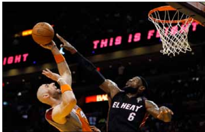
ليبرون جيمس معترضاً مارسين غورتات

الأخيرة. وساهم دراغيتش أيضاً في 13 تمريرة حاسمة، كما تألق الثنائي كورتني لي والأرجنتيني لويس سكولا بعدما سجل كل منهما 23 نقطة. أما من جهة لايكرز، فكان كوبي براينت والإسباني باو غاسول الأفضل بعدما سجل الأول 29 نقطة