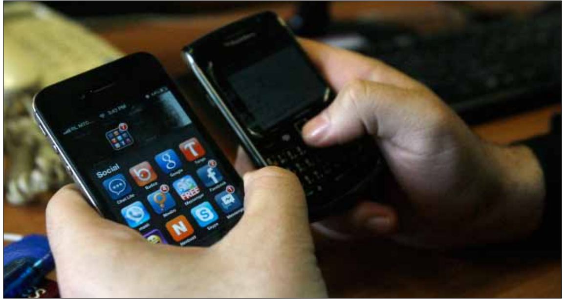
طلبت وزارة الاتصالات من شركتي الخليوي تفعيل خدمة وقف الاشتراك في الرسائل الاعلانية