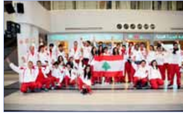
غادرت بعثة مدارس الليسيه

أنهى فريق كرة السلة في الجامعة اللبنانية الدولية معسكره في إسطنبول، الذي دام خمسة أيام خاض في خلاله ثلاث مباريات، توجهها بفوزين وخسارة واحدة، استعداداً لإكمال الموسم الرياضي الطويل للفريق. واكتسب الفريق خبرة كبيرة من تلك اللقاءات، علماً بأن المباريات جاءت أمام فريقين من جامعة إسطنبول من الدرجة الأولى في بطولة الجامعات، وفريق جامعة أوزبيغين من الدرجة الثانية، وقدم لاعبو الفريق أداءً مميزاً، وأظهروا جاهزية تامة لإكمال بطولة لبنان للجامعات، التي أصبح الفريق قريباً من الوصول إلى الدور الربع نهائي منها.