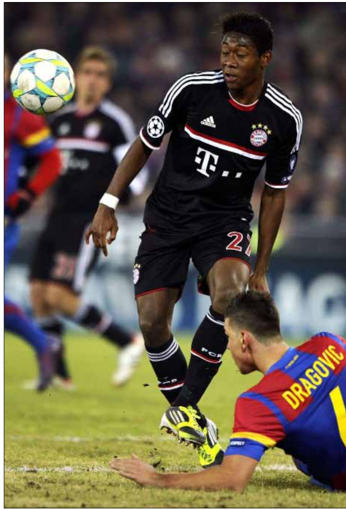
توقع هاينكس أن يصبح ألبا أحد لاعبي الوسط في العالم

الأول كلاعب ارتكاز، حيث تمكن من مزاحمة الألماني سامي خضيرة للعب بجوار شابلي ونسو، والثاني اللعب ظهيراً أيمن. لاعب يتميز بحيويته في الملعب وبقدرته السريعة على قراءة أفكار رفاقه،