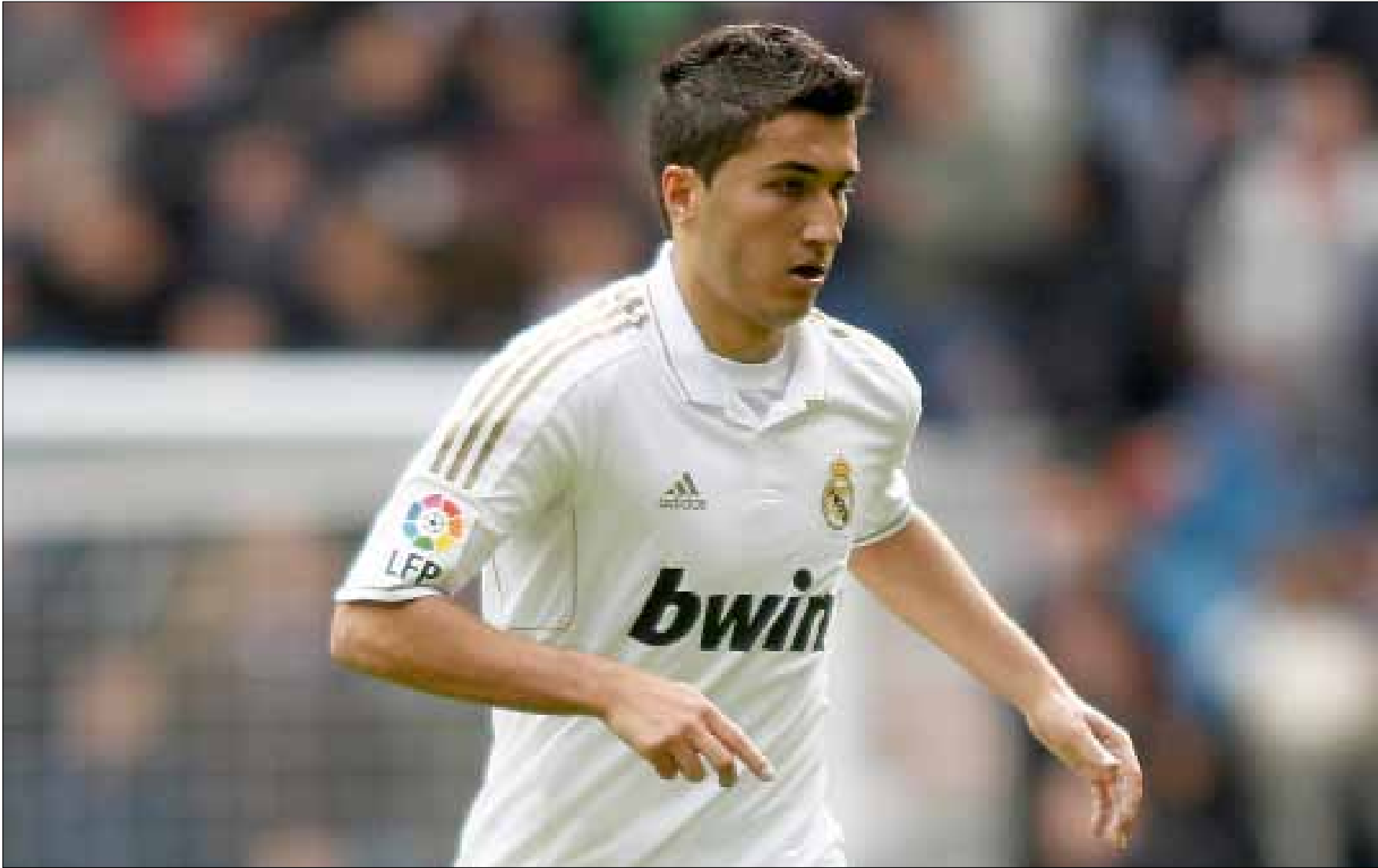
يتردد أن شاهين قد يعود أدراجه إلى دورتموند

نوري شاهين، اسم توقع المراقبون أن يكبر أكثر في ملعب «سانتياغو برنابيو»، إلا أن الشاب التركي وقع ضحية لإهمال مورينيو من جهة لموهبته، ومن جهة أخرى فإنه يدفع ثمن خطوته الخاطئة بالانتقال إلى ريال مدريد، حيث مكانه مشغول من ألونسو