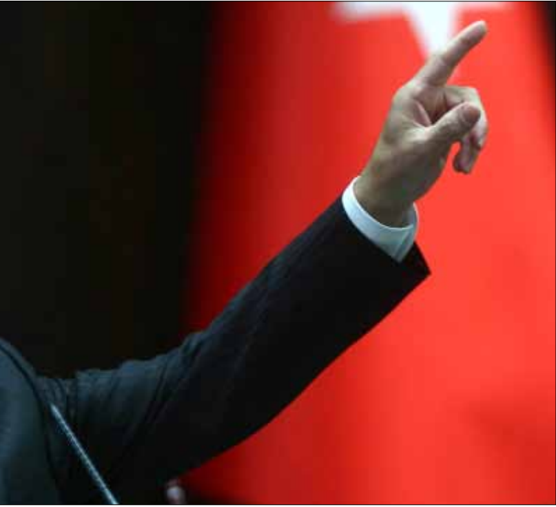
مرض السلطان التركي والأمير السعودي يقلقان واشنطن (أرشيف)

أحسن الأحوال: أولى، انكفاء تركيا عن دور متقدم في الأزمة السورية مكتفية بمهمة الرعاية الإنسانية للاجئين. إلا أن هذا الإحجام يرتبط كذلك بالوضع الصحي لرئيس الوزراء رجب طيب أردوغان الذي يُعالج من مرض عضال. وكان حتى الأشهر الأخيرة قد اضطلع بدور «السلطان» في قيادة المواجهة الإقليمية للنظام السوري. وفي ظل اعتقاد واشنطن بأن لا تعويل موقفاً به تتوقعه من العراق والأردن ولبنان، وهي دول الجوار لسوريا، تبقى تركيا الأكثر تأثيراً، وخصوصاً أن أردوغان - حتى الكشف عن مرضه - لم يتخل عن مطالبته بتنحّي الأسد