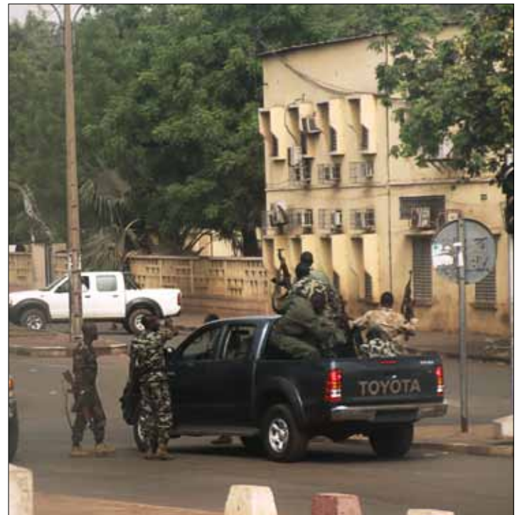
شوارع باماكو شهدت أمس انتشاراً أمنياً كثيفاً

الو تاكسي تطلب سائقين عموميين مع وبدون سيارة. مدخول جيد جداً. للاتصال على الرقم: 71/673079