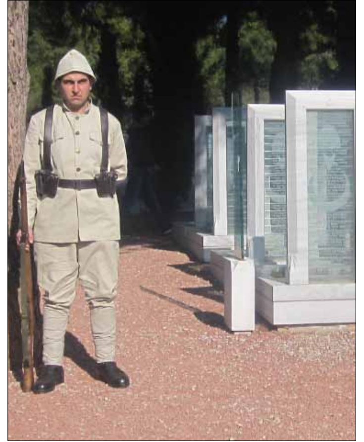
أحيا الأتراك الذكرى الـ 97 لمعركة الدردنيل الشهيرة

منذ 97 عاماً والأتراك يحتفلون بمعركة الدردنيل، التي ربحوها قبل أن يخسروا الحرب العالمية الأولى، فيأتي الأحفاد إلى أضرحة جنود تلك المعركة ليضعوا الزهور عليها، بينما تبقى أضرحة اللبنانيين والعرب منسية