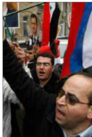
تظاهرة مؤيدة للرئيس السوري بشار الأسد في أوكرانيا أمس

بعد تعديلات طفيفة أدخلتها الدبلوماسية الروسية، اعتمد مجلس الأمن الدولي أمس بياناً رئاسياً يطالب بأن تطبق سوريا «فوراً» مقترح السلام الذي عرضه المبعوث الخاص للأمم المتحدة والجامعة العربية كوفي أنان