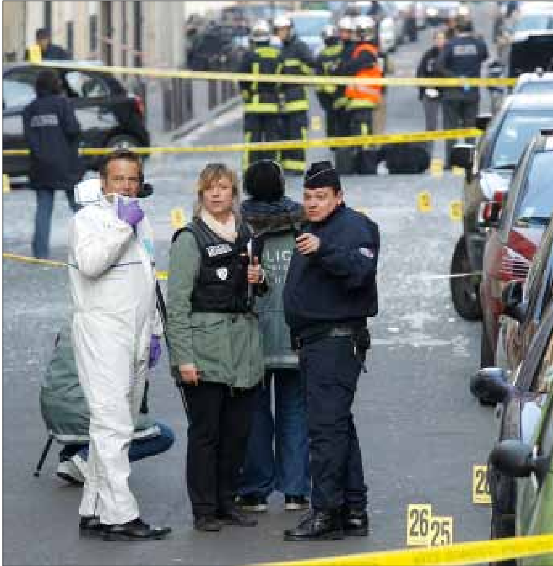
المكان الذي تم فيه تفجير حزمة ناسفة بالقرب من سفارة اندونيسيا في باريس امس

شهد التحقيق في الهجمات، التي هزت مدينة تولوز الفرنسية، تحولاً جذرياً، فبعد الاشتباه في «النازيين الجدد»، اتجهت أصابع الاتهام نحو التيارات السلفية الجهادية