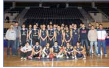
تضمن معسكر الجامعة اللبنانية

إلى مدينة نيس الفرنسية للمشاركة في الألعاب الدولية السنوية الثانية للشباب في ألعاب كرة اليد وكرة الصالات على العشب، والريشة الطائرة، والكاراتيه، وسباق البدل على الدراجات، والركض، والرماية باللايزر والتسلق والتزحلق لفنّي الذكور والإناث مواليد 1995 - 1996، 1996 - 1997 من 20 آذار إلى 25 منه.