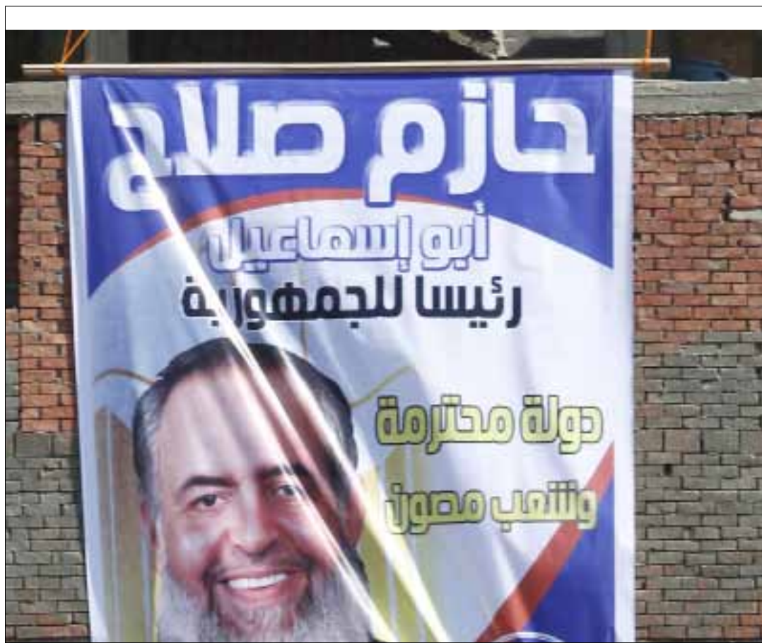
لافتة انتخابية للمرشح الرئاسي السلفي حازم صلاح أبو إسماعيل في شوارع القاهرة

إلا أن عبد المعز عاد وتراجع عن قراره ونفى تنحيه، رغم أنه سبق أن أعلن ذلك في حضور عدد كبير من القضاة في مقدمتهم رئيس المجلس الأعلى للقضاء المستشار حسام الغرياني. أحد قضاة محكمة الاستئناف، المستشار هشام رؤوف، قال لـ «الأخبار» إن «عدول عبد المعز عن قراره كارثة تسبب في كل قضية مصر». وطالب بعزل عبد المعز من عضوية لجنة الانتخابات الرئاسية، متسائلاً: «كيف نستأن كاذباً على انتخابات رئيس مصر القادم؟».