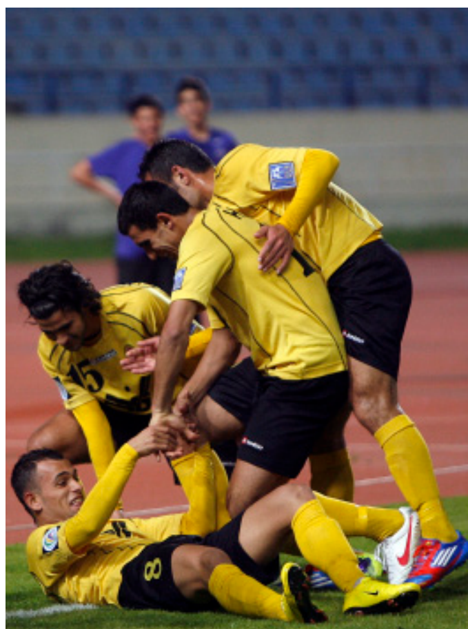
فرحة للعهد تكررة خمس مرات مع ثلاث غصات