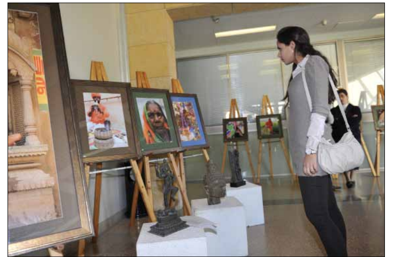
الزواج الهندي مؤسسة تجمع عائلتين وليس شخصين