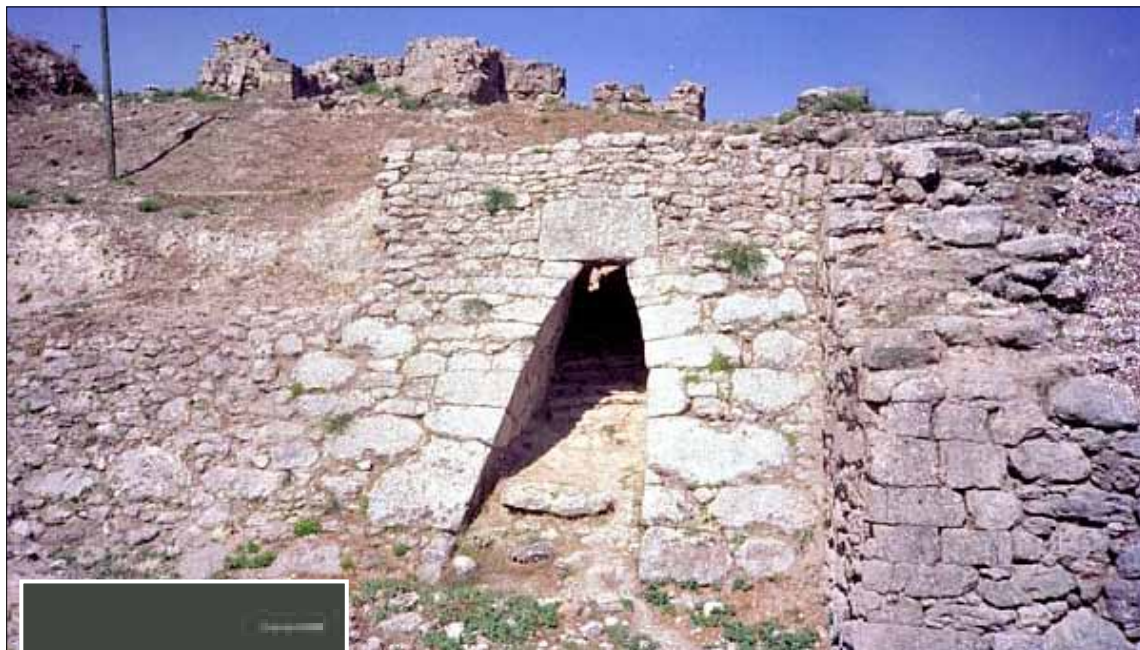
مدخل مدينة أوغاريت أو رأس شمرا ويعود تاريخه إلى الألف الثالث قبل الميلاد

ذات يوم من سنة 1928، اكتشف فلاح سوري مقبرة في مدينة رأس شمرا. اكتشاف آثار فضول عالمي الآثار الفرنسيين دوسو وشيفر، اللذين كانا ينقبان في موقع مجاور. كشفوا على المكان ليكتشفا دليلاً أولياً على واحدة من أهم حضارات الشرق القديم، كانت ضائعة منذ آلاف السنين. إنها مدينة أوغاريت التي أتت على ذكرها كتابات المدن الكبيرة، والتي لم يكن أحد يعرف بوجودها حتى ذلك اليوم، لكن الحفريات الأثرية التي ستتوالى عليها ستغير وجه دراسات العالم القديم. فأوغاريت مثلت حقبة في تطور البشرية، فكانت مركزاً مهماً في التجارة والسياسة لمدن الشاطئ، وكانت لها كتابتها التي تُعدّ في حد ذاتها مرحلة انتقالية من الكتابة المسمارية إلى الكتابة الفينيقية السامية. وبعد عقود من الدراسات، أتى كتاب العالم السوري غابريال سعادة ليختصر مجمل هذه الأبحاث ويعطي في مرجع واحد دراسة تاريخية تفصيلية عن المدينة منذ نشأتها إلى نهايتها، أي ما يزيد على 5000 سنة.