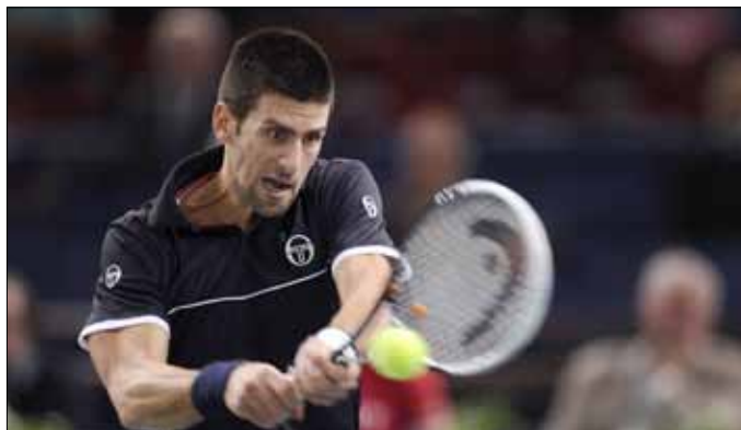
ديوكوفيتش يتصدى لإحدى كرات ترويسكي

وكانت طريق البريطاني أندي موراي الثاني لبلوغ ربع النهائي في غاية السهولة حيث فاز على الأميركي أندي روديك الثالث عشر 2-6 و 2-6 في