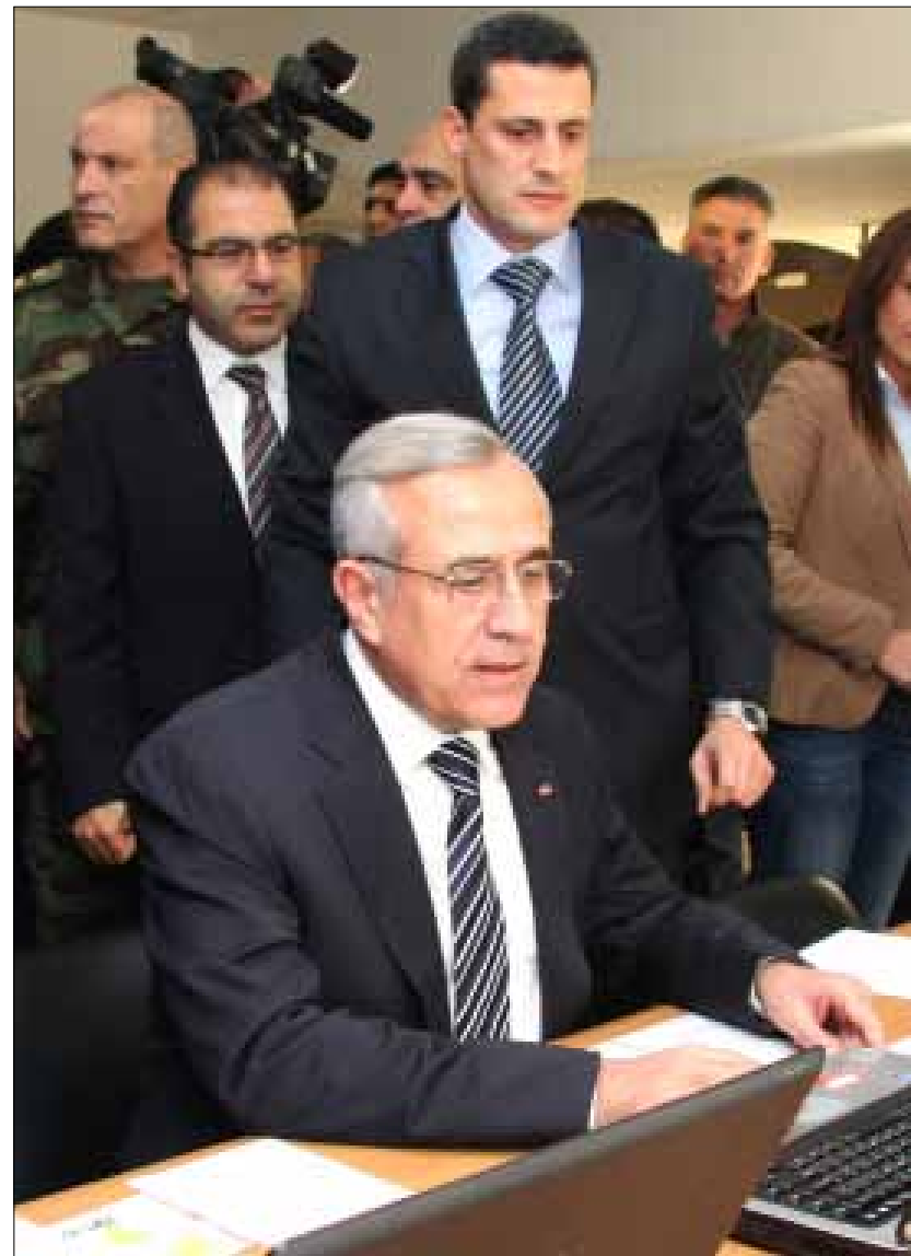
الرئيس ميشال سليمان يصوت لمغارة جعينا

وكشف جنبلاط أن «الروس والصينيين أعطوا نصيحة للرئيس السوري بشار الأسد بأنه لا بد من الإصلاح، وعلينا أن نستعجل خطوات الإصلاح»، لافتاً إلى أن «سوريا الجديدة يجب أن تكون ديمقراطية متحررة، وهي عمق للبنان ولسنا هنا نراهن على سقوط النظام السوري، بل على إصلاح يوقف الدم»، متمنياً «على بعض الرفقاء اللبنانيين أن يجلس معاً ونتحاور لحماية سوريا، وأعتقد أن حزب الله سيكون أول المستفيدين»، معتبراً أنه «لا خوف على حزب الله إلا من مغامرات مجنونة. إذا ضرب نتنياهو إيران فقد يردّ حزب الله على إسرائيل، وقد تضرب إسرائيل لبنان وإيران معاً».