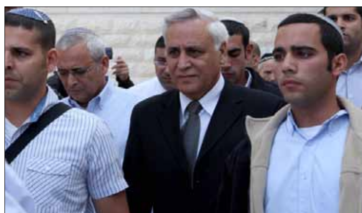
كاتساف مغادراً المحكمة بعد تثبيت الحكم بحقه

يستعد الرئيس الإسرائيلي السابق موشيه كاتساف لتمضية سبع سنوات في السجن، بعدما ثبتت المحكمة العليا الإسرائيلية الحكم الصادر ضده بالسجن، إثر إدانته بالاغتصاب والتحرش الجنسي