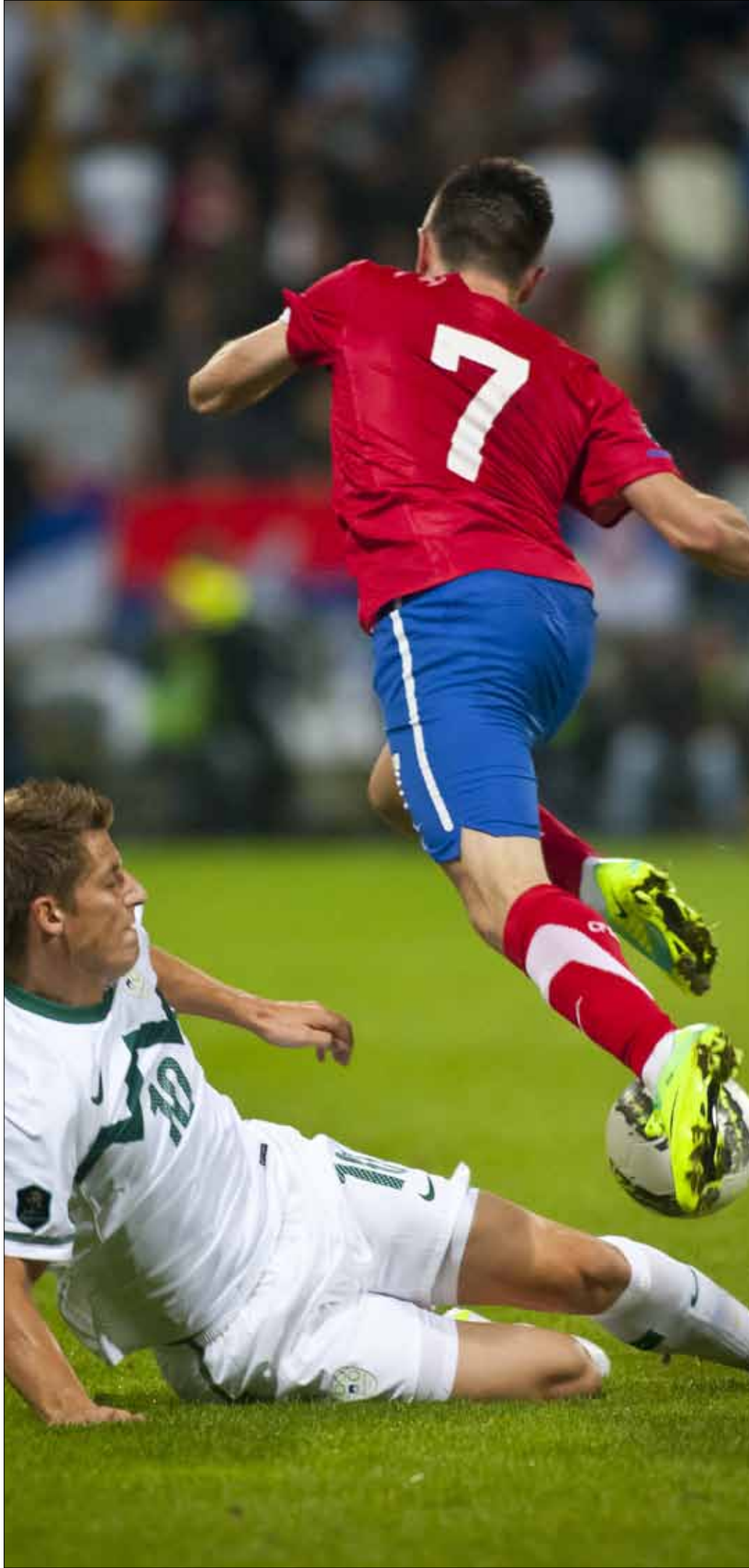
تراجع مستوى المنتخبات في غرب البلقان كثيراً في الآونة الأخيرة

صربيا، سلوفينيا ومقدونيا خارج تصفيات كأس أوروبا 2012. كرواتيا، مونتينيغرو والبوسنة والهرسك تخوض مباريات الملحق. كرة القدم في غرب البلقان تغيرت كثيراً، ولم يعد هناك منتخب قوي على صورة «الأزرق» القديم، أي منتخب يوغوسلافيا