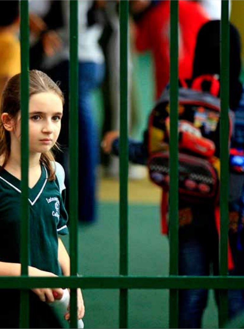
الدولة تشجع التعليم الخاص على حساب العام (هينم الموسوي)

دراسات البنك الدولي والأمم المتحدة: الإنفاق على التعليم في لبنان هو الأعلى عالمياً. فلماذا يجب أن يتحمل اللبنانيون هذه الكلفة المرتفعة؟ لماذا يعد اللبنانيون ملزمين بتمويل التعليم الخاص؟ إلى متى سيستمر اقتطاع هذه الكلفة من أجور المواطنين الزهيدة أصلاً؟ ومصلحة من؟ الأكد أن الدولة اللبنانية تنفق أكثر من 350 مليار ليرة لدعم المدارس الخاصة من الموازنة العامة، بهدف هدم التعليم الرسمي. 350 مليار ليرة سنوياً، ليست كافية لجعل التعليم الرسمي من الأفضل عالمياً؟ لنضع الأرقام تتكلم. الانطلاقة تبدأ بالموازنة العامة. الموازنة التي ترسم عمل الحكومات