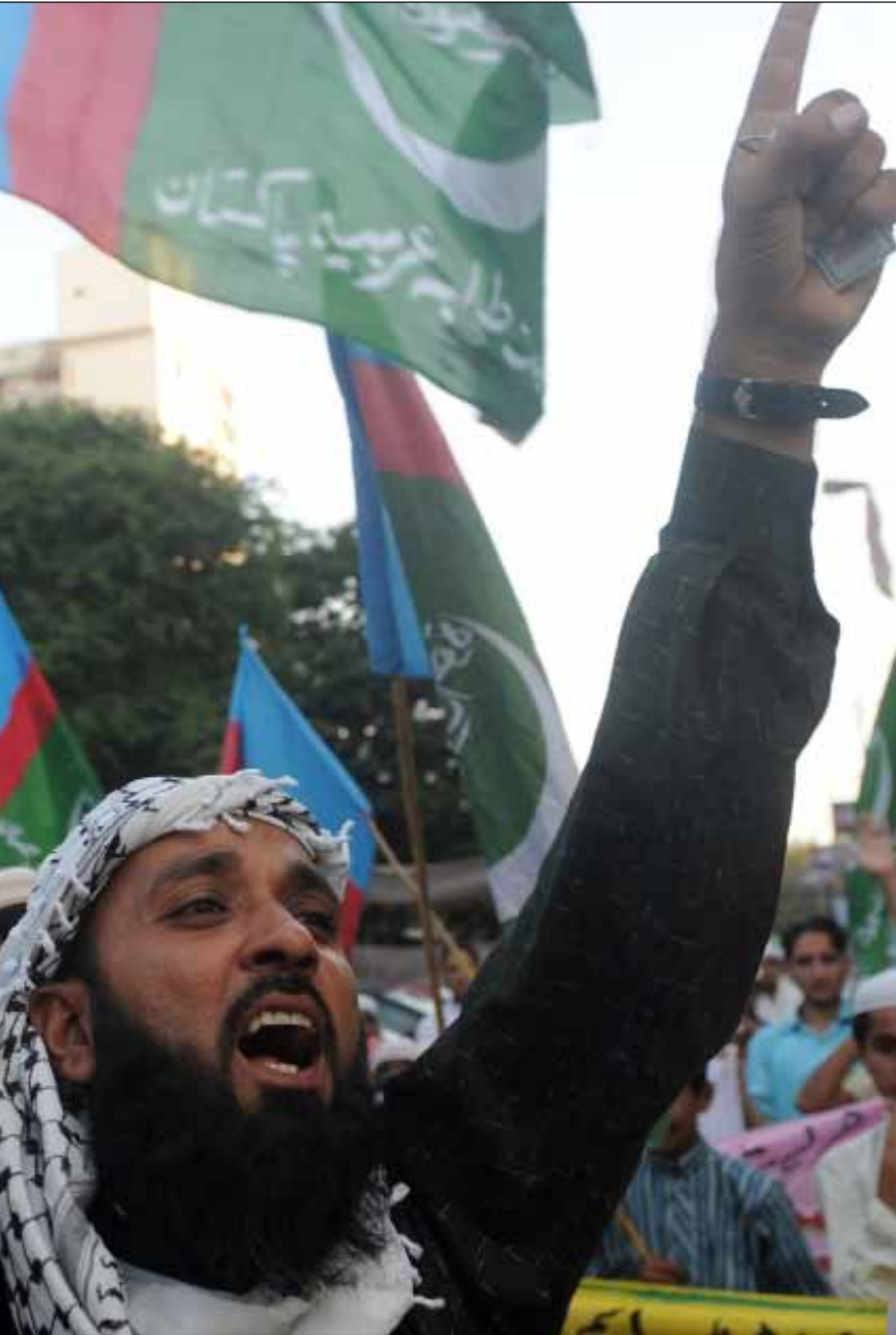
أميركا تصدر الإرهاب إلى العالم

قدم بعض الإيرلنديين - الأميركيين مساعدات مالية ولوجيستية لأعمال العنف التي استهدفت إجبار المملكة المتحدة على التخلي عن سيطرتها على إيرلندا الشمالية. في ثمانينات القرن التاسع عشر (1880)، فجر أعضاء في قبيلة «نا غايل» مركز سكوتلاند يارد والبرلمان وبرج لندن، وزرعوا قنابل في أماكن متعددة من شبكة قطارات الأنفاق في العاصمة البريطانية. وفي القرن العشرين، معظم المساعدات المالية التي جرى إصدار الجيش الجمهوري الإيرلندي بها قدمها أميركيون ذوو أصل إيرلندي.