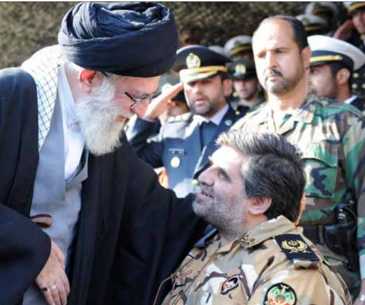
خامنئي خلال الحفل العسكري في طهران أمس

الاتحاد الأوروبي يعدّ لعقوبات تشمل النفط... وروسيا والصين تؤكدان رفضها