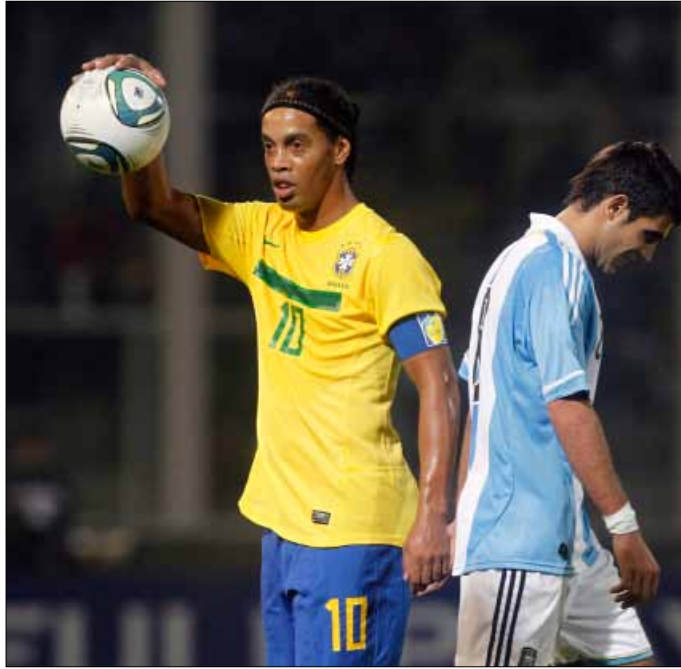
تالو رونالدينيو مع فلانغو اعاده الى المنتخب

رأى المدير الفني للمنتخب البرازيلي لكرة القدم مانو مينيزيس أن «السيليساو» ليس بمستوى كل من الأوروغواي وألمانيا وهولندا وإسبانيا، وهي المنتخبات التي وصلت إلى الدور نصف النهائي في كأس العالم 2010 في جنوب أفريقيا، التي أحرزت إسبانيا لقبها. ويعد هذا التصريح خطيراً بالنسبة إلى البرازيل، التي تعد أكبر مصدر للاعبين كرة القدم إلى العالم، فضلاً عن أنها تُوجت باللقب العالمي في خمس مناسبات. واعترف مينيزيس في مؤتمر صحفي عقده في ساو باولو بأن تلك المنتخبات البرازيل حالياً، مضيئاً «كل منها» يقدم نموذجاً علينا اتباعه». وأشار إلى أن مستوى المنتخب البرازيلي حالياً يضعه في مصاف كل من إيطاليا والبرتغال. وكان «السامبا» قد تراجع إلى المركز السابع في تصنيف الاتحاد الدولي لكرة القدم «الفيفا»، وهو الأسوأ له منذ عام 1993.