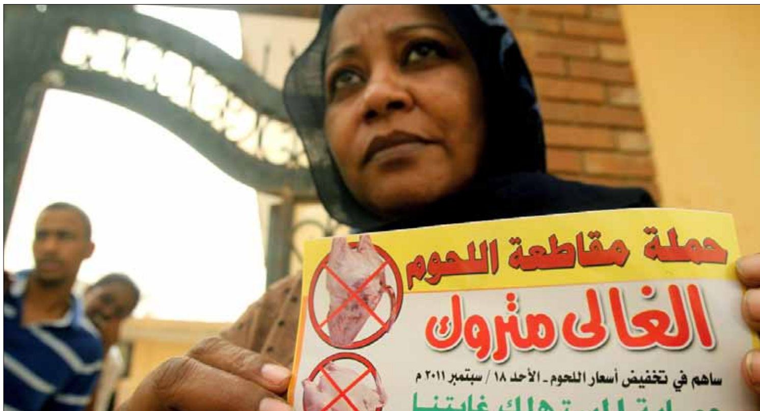
حملة المقاطعة لاقت رواجاً واسعاً في العاصمة الخرطوم

أكثر ما تخشاه الحكومة أن يؤدي التعامل بسبب الغلاء إلى تحريك الشارع