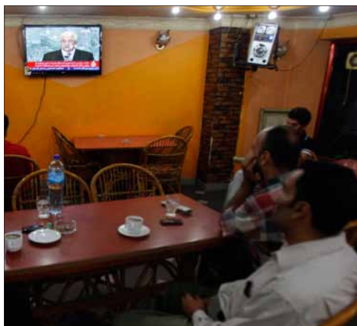
أكد الفلسطينيون في غزة بمنازل والمقاهي

إلى المفاوضات. وقال: «لذلك، لا المبادرة الفرنسية ذات مغزى بالنسبة إلى الشعب الفلسطيني ولا هذا التحرك القائم على المساومة ذا مغزى. المغزى الحقيقي يتمثل في استعادة الوحدة الوطنية والاتفاق على برنامج وطني واستراتيجية صمود فلسطيني. الدولة تنتزع ولا توهب، والتحرير قبل الدولة»، على حد قوله.