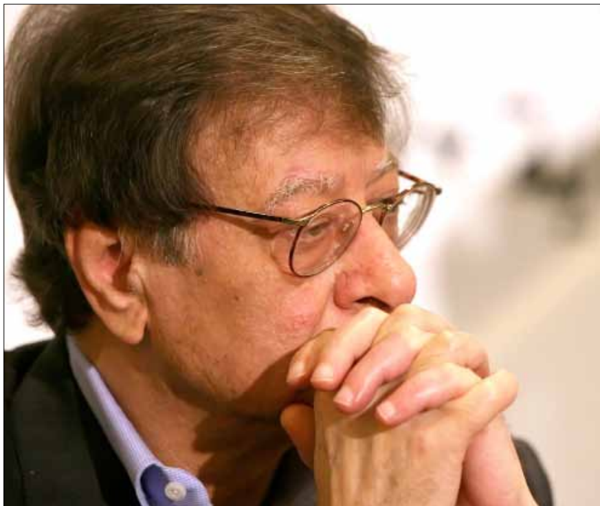
محمود درويش

والأبرز أنّها قد تكون اللبنانية الوحيدة (أو الوحيد) التي أثبتت في حياتها نبذها للطائفية (وليس فقط في أغنية «مرحبتين، مرحبتين»، حيث تسلسل أسماء ذكور من لبنان مع تمثيل طائفي واسع). لم تقبل صباح الموانع الطائفية في حياتها، وكان ذلك في سن مبكرة، وفي زمن كانت فيه الفوارق الطائفية في الزواج تعد من المسلمات، كما أن صباح، التي غنت للوطنية اللبنانية، مثلها مثل غيرها، كانت تعدّ نفسها مصريّة، وأصرت على الاحتفاظ والافتخار بجنسيتها المصريّة. لم يرد المسلسل أن يتحدث عن أفق صباح العربي، فالكاتب على الأرجح ساداتي ورجعي، وركّز كثيراً في السياسة على ظلم الضباط الأحرار لصباح، من دون أن يتعرّض لظلم السادات أو مبارك. كان الكاتب مثل أبواق أمراء آل سعود، الذين يشعرون بأنّ عليهم الانتقام من عبد الناصر لكفأته في