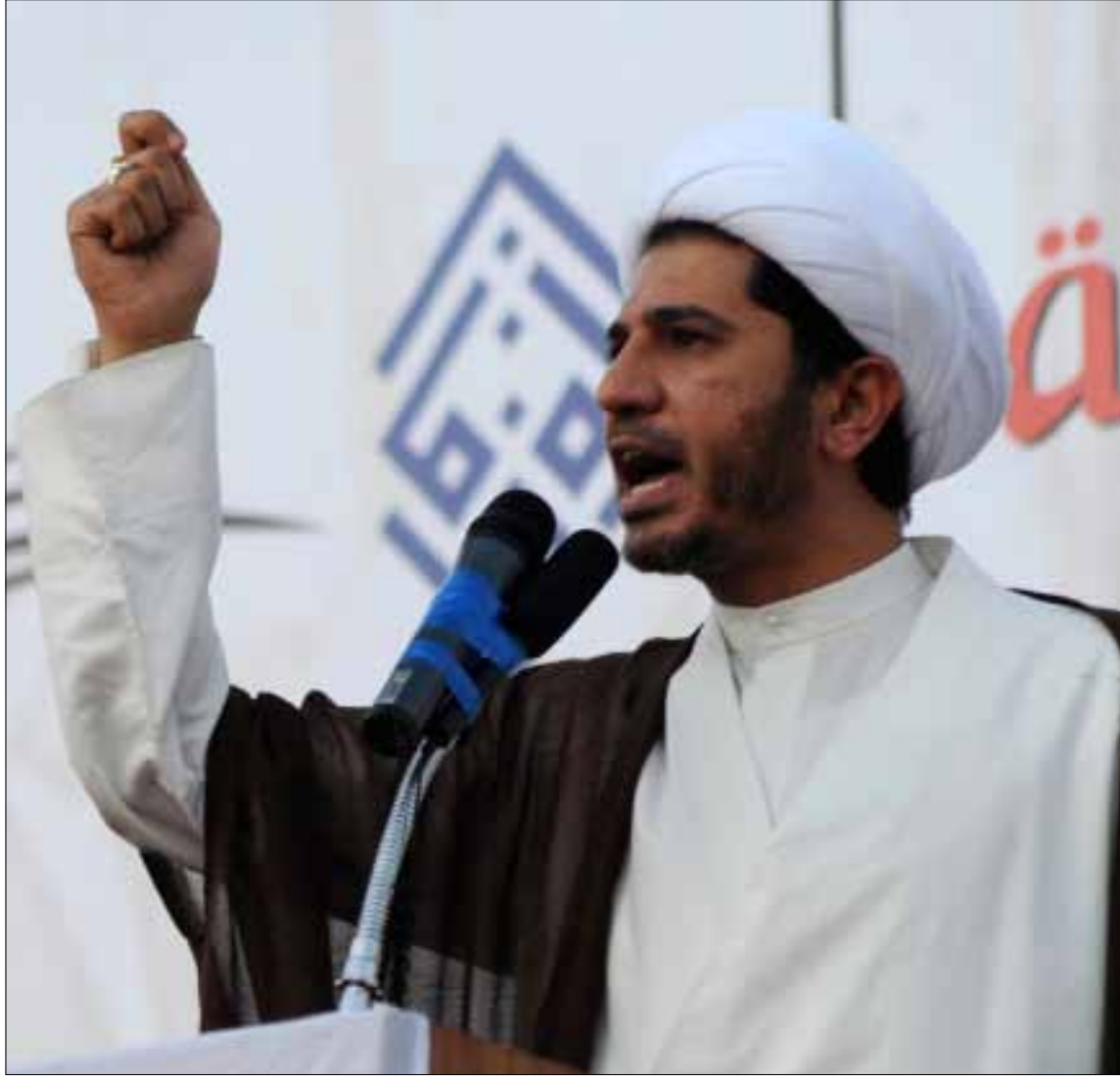
الشيخ علي سلمان يخطب في فعالية يوم الوحدة الوطنية جنوب المنامة أول من أمس

وشرح مطر موقف جمعياته من فعالية «يوم العودة»، وقال إن «الوفاق» ليست طرفاً فيها، وأعلنت برامج أخرى للتعبير عن الاحتجاج، ويرجع هذا الموقف إلى صعوبة تنظيم فعالية أطلقت من العالم الافتراضي. ويضيف: «نحن لم نوجه أي دعوة؛ لأننا قد نفقد السيطرة على الحدث، إضافة إلى تخوفنا من قمع التظاهرات واستخدام الأجهزة الأمنية العنيفة، وهو قد يعرض المتظاهرين لإصابات لا تريدها الجمعية بتاتاً»، مشيراً إلى تزايد سقوط الشهداء والجرحى جراء الاستخدام المفرط للقوة من قبل الأجهزة الأمنية خلال الفترة الأخيرة (سقط في خلال أسبوع 3 شهداء). ودعا مطر السلطات الأمنية إلى كبح جماح عنفها.