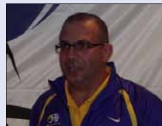
مدرب أول سبورتس دوري زخور (الأخبار)