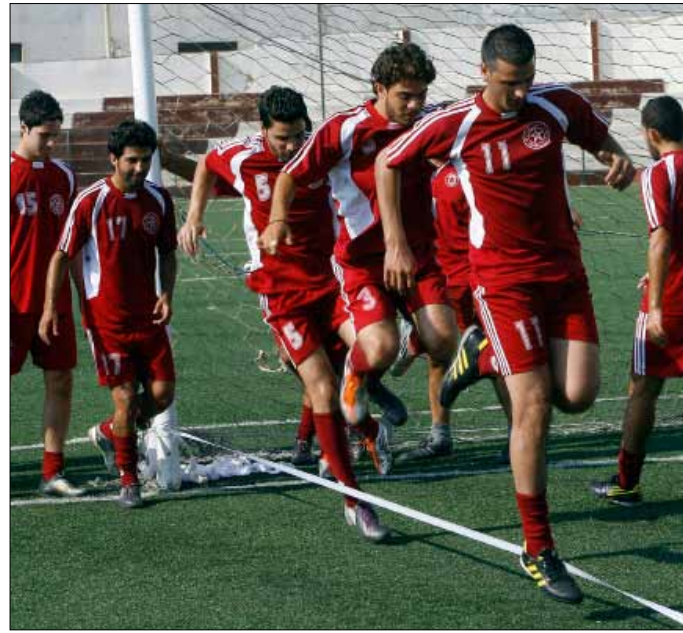
لاعبو النجمة خلال التمارين

مبلغ 10 آلاف دولار شهرياً، يمثل نصف موازنة النادي الشهرية، وذلك عبر إطلاق حملة «الألف مشجع» على «الفايسبوك» مطلع الشهر المقبل، تدعو محبي النادي إلى دفع 10 دولارات شهرياً، مع سعي