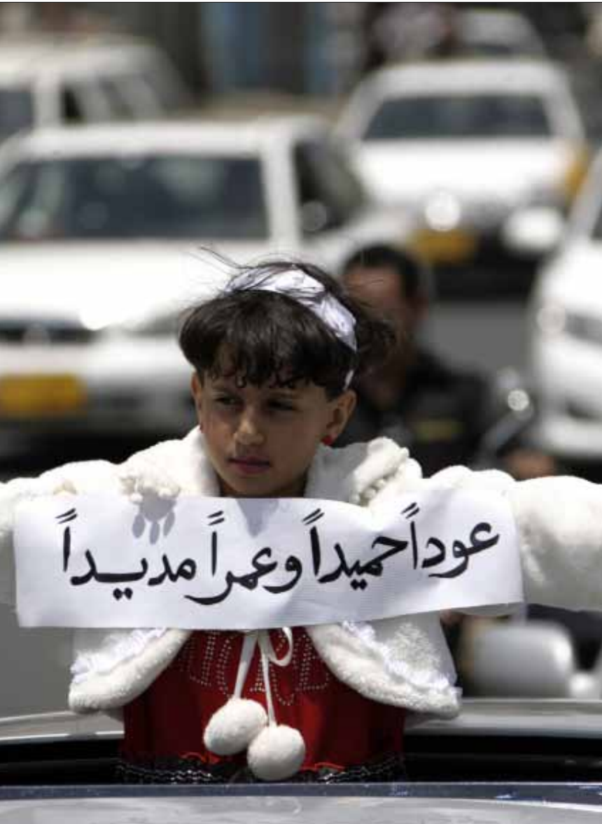
فتاة يمنية تحتفل بعودة صالح إلى اليمن

وأضاف المصدر أن مطار عدن أُبلغ منذ مساء أول من أمس، بأن وفداً سعودياً سيصل إلى عدن، وبناءً على ذلك جُهِّز المطار لاستقبال الوفد السعودي، مشيراً إلى أنه لدى وصول الطائرة الملكية إلى مدرج المطار، فوجئت السلطات الأمنية في مطار عدن بهبوط طائرة مروحية خاصة إلى مدرج المطار، وانتقال من كانوا يعتقدون أنه وفد سعودي رفيع إلى المروحية، وعدم انتقاله إلى صالة الاستقبال الخاصة باستقبال الوفود الرسمية الرفيعة.