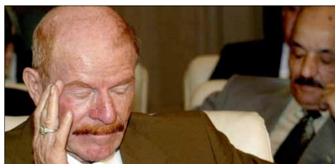
الدوري خلال قمة الجامعة العربية في شرم الشيخ في 2003

أثارت برقية تعزية وجهها زعيم حزب البعث العراقي المختفي منذ احتلال العراق، عزّة إبراهيم الدوري، إلى رئيس إقليم كردستان العراق مسعود البرزاني مناسبة وفاة والدته قبل أسابيع قليلة، جدلاً واسعاً وردود فعل غاضبة في الوسط البعثي العراقي خارج العراق. البرقية موقعة باسم عزّة إبراهيم «الدوري» بصفته «الأمين العام لحزب البعث العربي الاشتراكي» و«أمين سر القطر» و«القائد الأعلى للجهاد والتحرير والخلاص الوطني»، وتعتبر أول تعامل علني ورسمي بين الطرفين. خاطب الدوري البرزاني بعبارة «الأخ مسعود البرزاني رئيس الحزب الديموقراطي الكردستاني العراقي المحترم»، وختمها بعد عبارات التعزية التقليدية بأن تمنى له «موفق الصحة والعافية ولشعبنا العراقي الوحدة الدائمة والحرية والاعتناق، والسلام عليكم ورحمة الله وبركاته». هذه المبادرة على بساطتها وأريحياتها