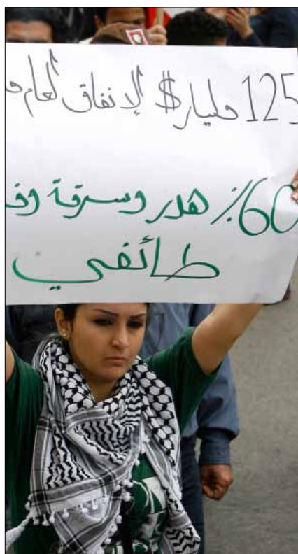
من تظاهرة لاسقاط النظام الطائفي