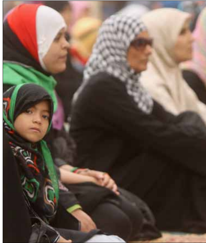
يشارك في صلاة الجمعة في مدينة بنغازي أمس

وامتنعت الدولتان كذلك عن التصويت في الأمم المتحدة على القرار 1973 الذي سمح بشن ضربات دولية على طرابلس. وفي موقف لافت آخر، أعلنت فرنسا أنها تعمل مع المقربين من الزعيم الليبي في محاولة لإقناعه بالتخلي عن السلطة. وفي الوقت نفسه تعمل على زيادة الضغط العسكري على قواته مع بدء الشهر الثاني من مهمة لحلف شمالي الأطلسي في ليبيا مدتها ثلاثة