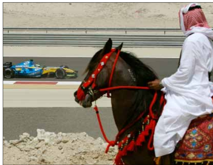
قرب ميدان الـ «فورمولا 1» في المنامة