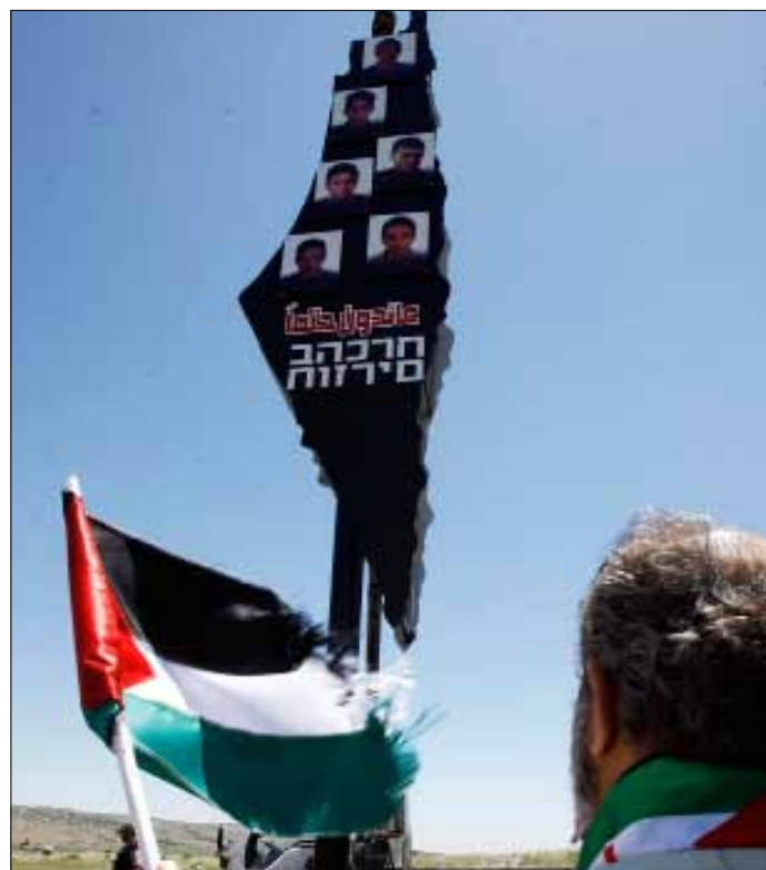
نصب أقيم في مارون الراس إحياءً لشهداء العودة