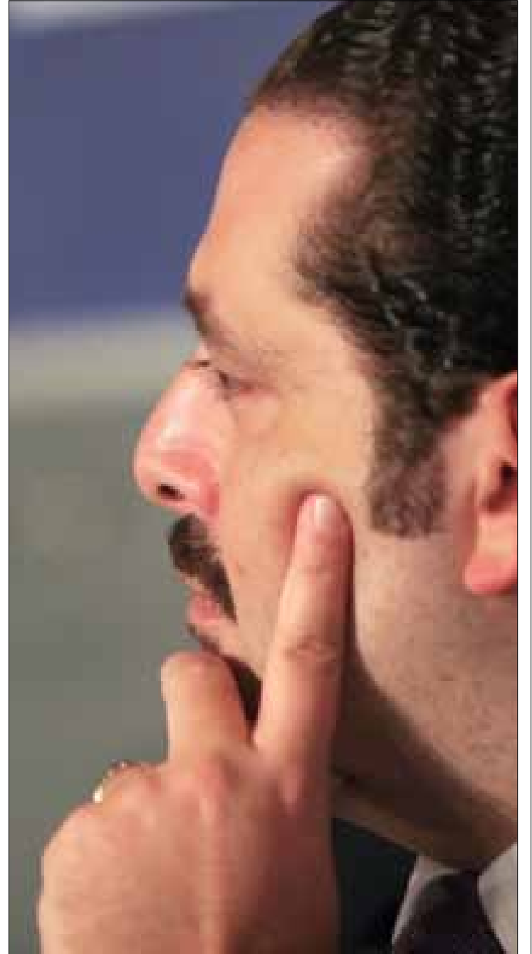
سعد الحريري

وتبقى في بال الحريري قضية الفساد المستشري في مؤسسته الكبرى، «سعودي أوجيه»، وكيفية القضاء عليه في مرحلة وأعدة بالمشاريع، ولو أن القيمة التقريبية لهذا الفساد تراوح بين 20 مليون دولار و30 مليوناً، أي لا يمكن مقارنتها بقيمة هذه المشاريع الجديدة.