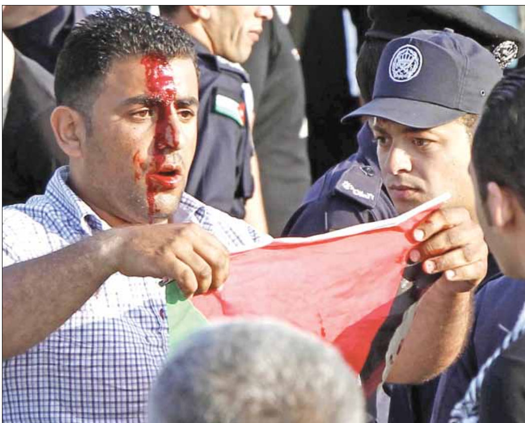
أردني تعرض لاعتداء قوى الأمن في منطقة الكرامة في ذكرى النكبة