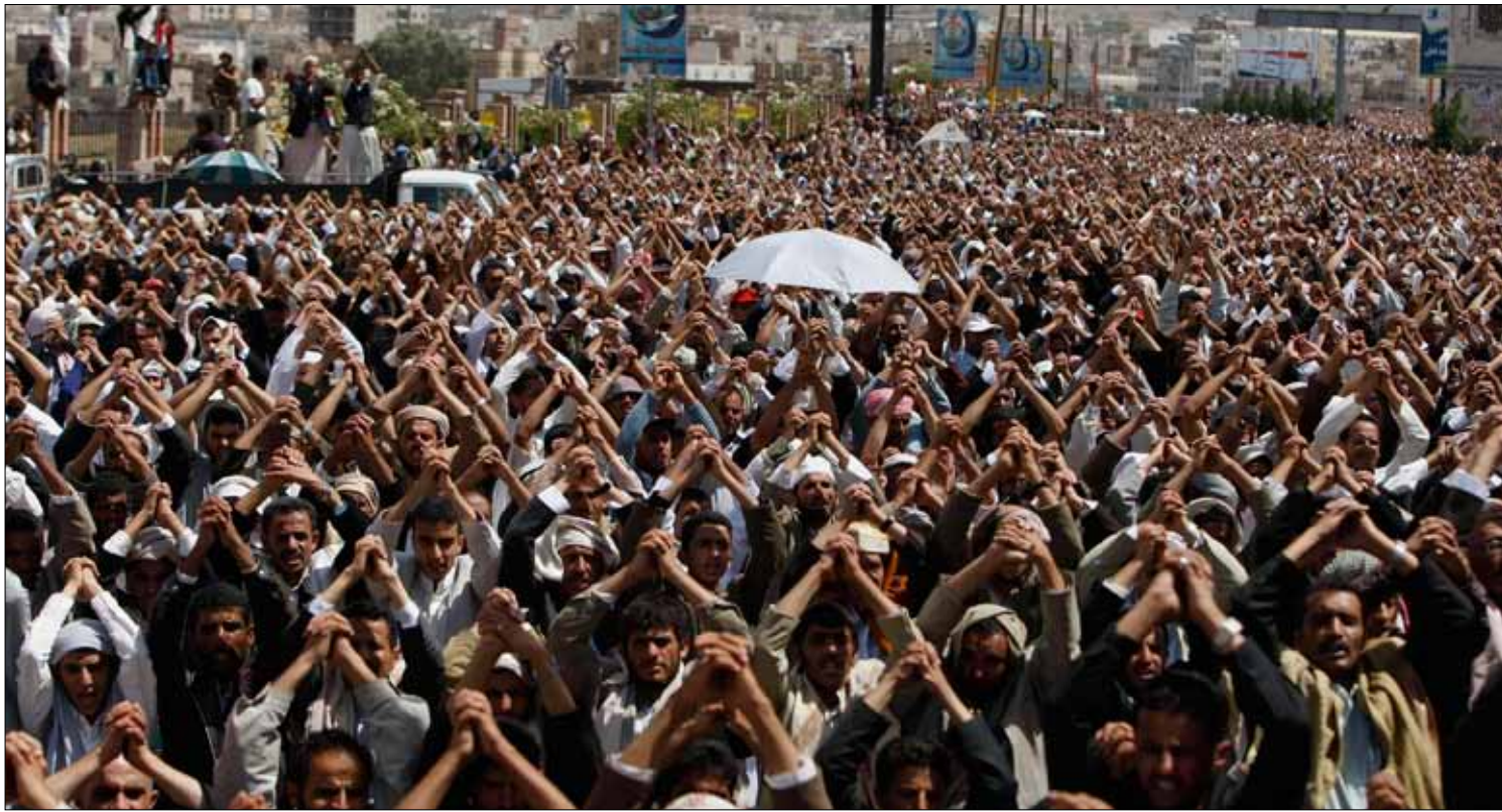
يمنيون يشاركون في التظاهرات المنذرة بصالح أمس في صنعاء

معلومات عن انسحاب وزير الدفاع اليمني وتوجهه إلى الجنوب