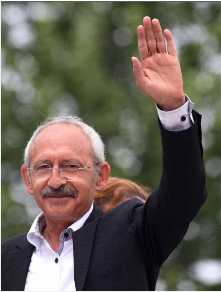
زعيم حزب «الشعب الجمهوري» كمال كليتش دار أوغلو في إسطنبول

يخوض المعركة الانتخابية بتوقعات أن ينال ما بين 20 و25 في المئة من الأصوات، ورغم أن جمهوره كبير، فإنه يعاني من واقع أن الجيش خسر سيطرته على الجزء الأكبر من الحياة السياسية التركية، وهو المحسوب على هذا الحزب المحسوب بدوره على الجيش، لأن المؤسستين، أي الحزب والجيش، هما الابنتان الشرعيتان لمؤسس الجمهورية. ثالثاً، لأن الجهاز القضائي الذي يمثل الركن الثاني بعد الجيش للنسخة الكمالية من العلمانية التركية، خسر أيضاً هيئته نتيجة الفضائح التي تلاحقه، وبسبب الأخطاء التي ارتكبها قضاة تركيا حتى بعد عهد انتهاء سطوتهم على السياسة. رابعاً لأن مفهوم اليسار الوسط (الشعب الجمهوري) اضمحل في تركيا بالفترة الأخيرة في مقابل صعود اليمين المحافظ الديني القومي، المتمثل بـ«العدالة والتنمية». خامساً، لأن «الشعب الجمهوري» لا يقدم جديداً للقاعدة الاجتماعية الخاصة به، وبالتالي إن تلك القاعدة لا تزال هي نفسها، مع ميلها العام إلى التناقض، وإن كان بطيئاً، بسبب تغير الأجيال التركية بدليل