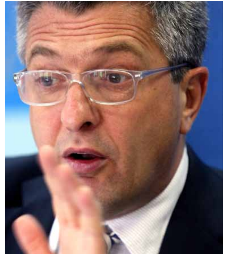
غراندي: تراوح موازنة «الأونروا» ما بين 65 و70 مليون دولار أميركي

الواقع الصحي، أزمة البنى التحتية وكيفية الحد من الفقر هي الأولويات الثلاث التي يراها المفوض العام لوكالة «الأونروا» فيليبو غراندي. لكن المؤتمر الصحافي السريع الذي عقده أمس لم يخل من حديث عن أولويات أخرى