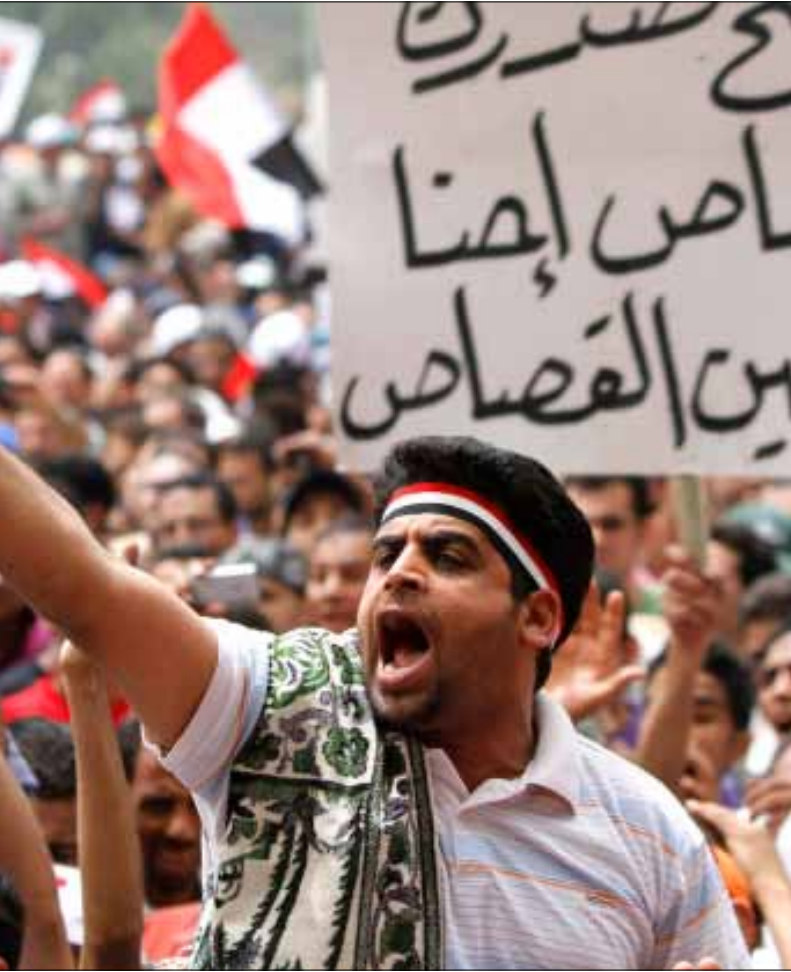
بانظار تعافي مصر

لم يتمكّن السنة في لبنان من الدخول إلى الوطن، بل حافظوا على انتمائهم الطبيعي، وسقط شعار لبنان أولاً عند كل اختبار. هم أقرب إلى الملك السعودي أو إلى الشيخ أسامة بن لادن، منهم إلى فؤاد السنيورة، وينتظرون اليوم مستقبلاً يبدو ضبابياً في ظلّ الثورات العربية