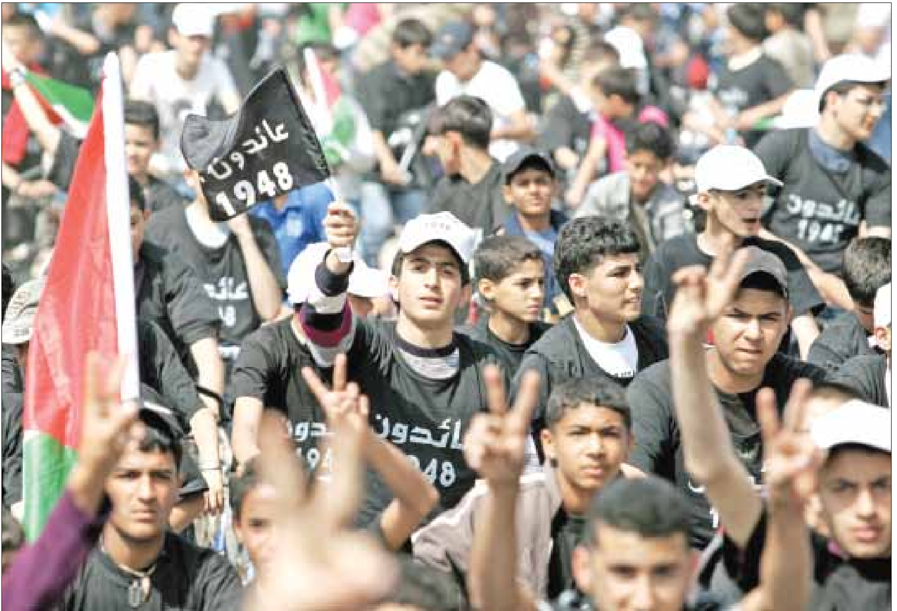
«فلسطينيون عاندون» في مسيرة العودة بمدينة جنين