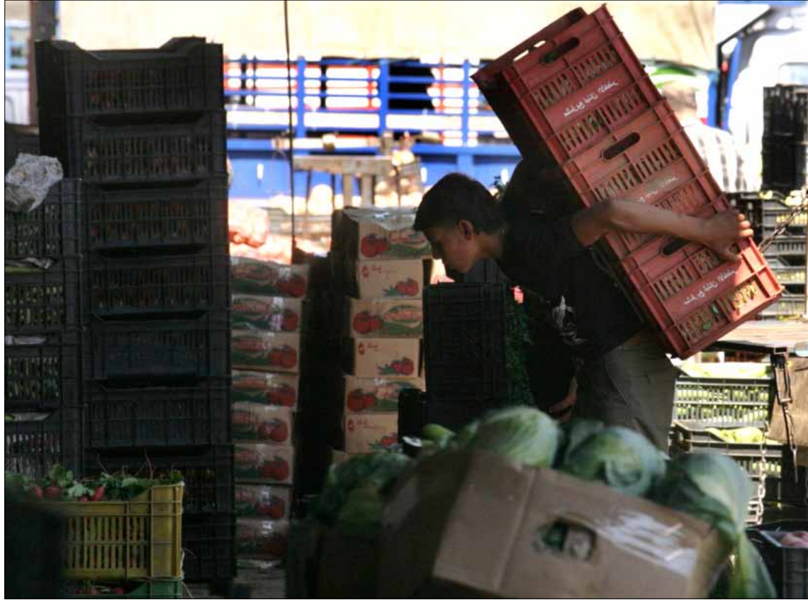
كل ما يتناقل عن الإصابات في لبنان ليس سوى شائعات ناجمة عن مخاوف