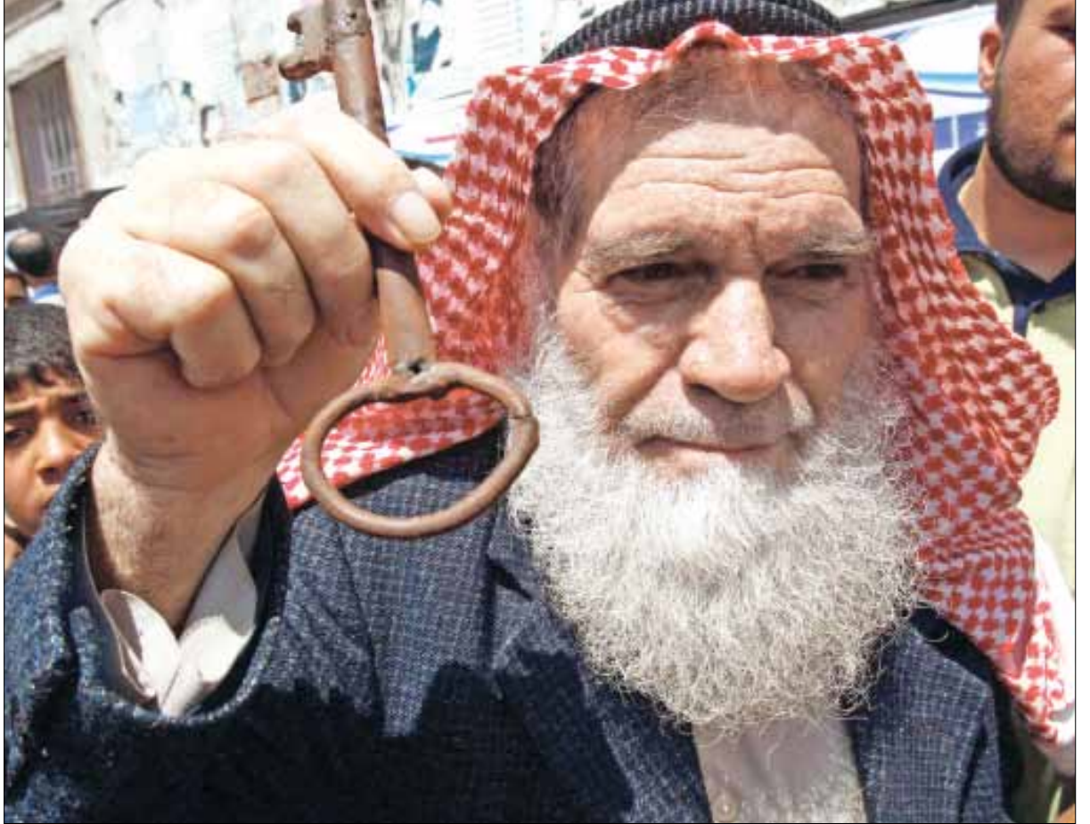
ضحية من ضحايا النكبة في غزة

رغم إلغاء فعاليات الزحف الفلسطيني في الخارج لحسابات سياسية وأمنية، يبدو أن للدخل حسابات أخرى. فها هي غزة تستعد لتكرار تجربة 15 أيار، والتوجه إلى الخطوط الفاصلة بين القطاع والأراضي المحتلة عام 1948