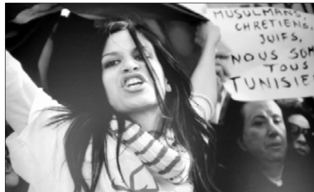
من أعمال ريم تميمي

واقعية الصور تعيد إلينا حرارة أجواء الثورة