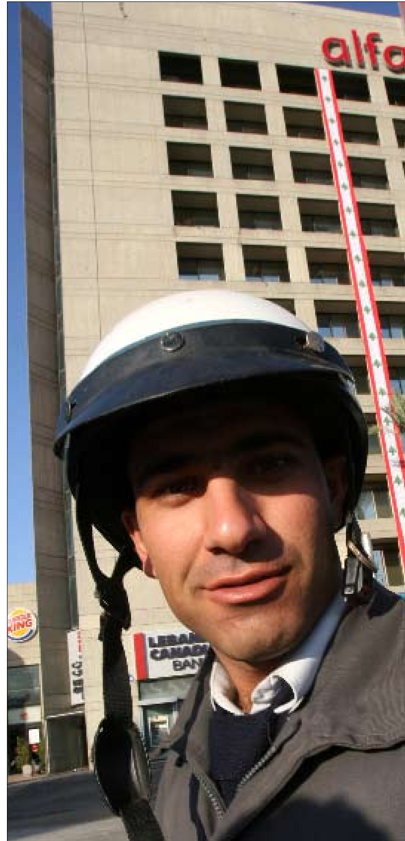
كان يخبرهم عما يجري داخل ألفا لحظة بلحظة (أرشيف)