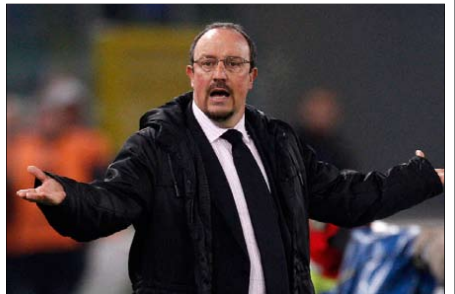
بينيتيز في مباراة إنتر أمام لاتسيو في الدوري الإيطالي

في المقابل، أشارت وكالة «أنسا» الإيطالية، إلى أن النجم البرازيلي السابق ليوناردو سيتولى الإشراف على تدريب الفريق خلفاً لبينيتيز في الأيام القليلة المقبلة، في الوقت