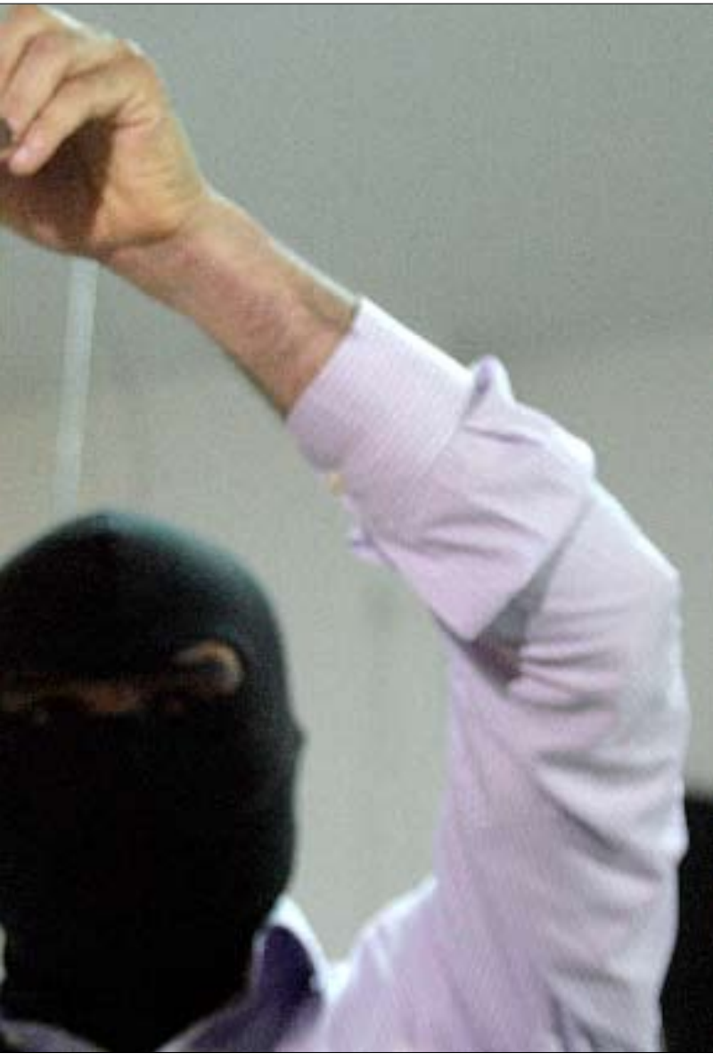
جهاز إسرائيلي ضبط مع أحد العملاء عام 2009 ولم تكشف ماهيته بعد