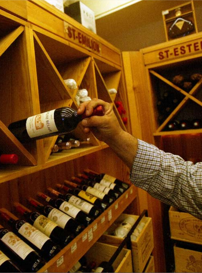
نصف إنتاج النبيذ اللبناني يصدر إلى الخارج

وإضافة إلى ذلك، مثلت عودة اللبنانيين من المهجر بعد أحداث