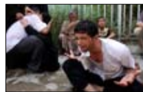
دموع mtv على مسيحي العراق 22:00 ■ mtv