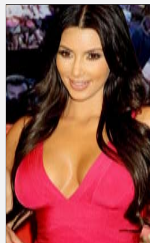
نيويورك - حنان الحاج

وقد بدأ بعض المغنين والنجوم إعلان برامجهم لحفلات رأس السنة. مثلاً، النجمة ريهانا ستحيي حفلة في Pure في «سبزارس بالاس» في «مدينة الخطيئة» لاس فيغاس. كذلك أعلنت نجمة تلفزيون الواقع كيم كارداشيان (الصورة) رعايتها لحفلة صاخبة في ملهى «تاو» في كازينو The Venetian في لاس فيغاس أيضاً. أما محبو الجاز والبلوز، فموعدهم مع سهرة مميزة مع ملك الجاز بي. بي. كينغ في منتجج «هاراه» في «عاصمة الخطيئة» الأخرى في شرق أميركا «أتلانتيك سيتي». وكذلك، سيحيي فنان الأوبرا اندريا بوتشيلي حفلة ساهرة في «باتومي» في ولاية جورجيا الأميركية. وإذا كنت من محبي توديع السنة بنوستالجيا وحنين إلى وقت مضى، فهناك فريق Yesterday - A tribute to the Beatles الشهير الذي سيحيي سهرة رأس السنة في كازينو «تروبيكانا» في لاس فيغاس على وقع أغان ذهبية لفريق «البيتلز» أحبها الناس ورددها مثل Eleanor، Yesterday، Rigby، Imagine، A day in the life