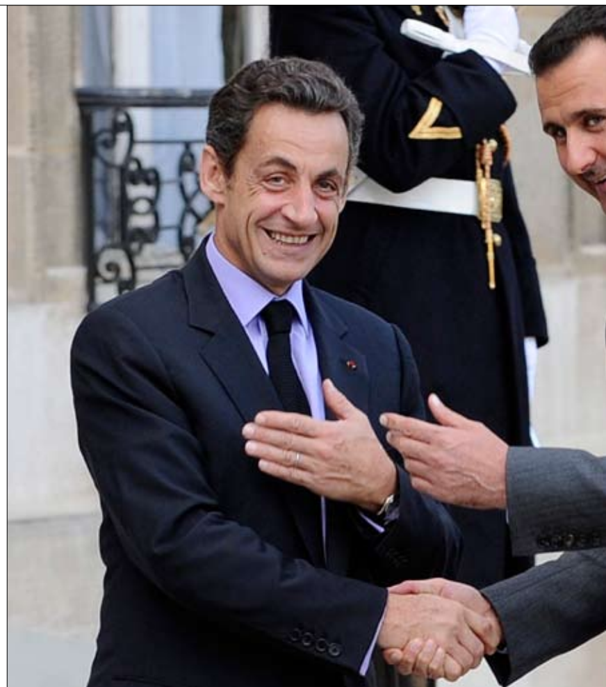
الأسد وساركوزي في الإليزيه