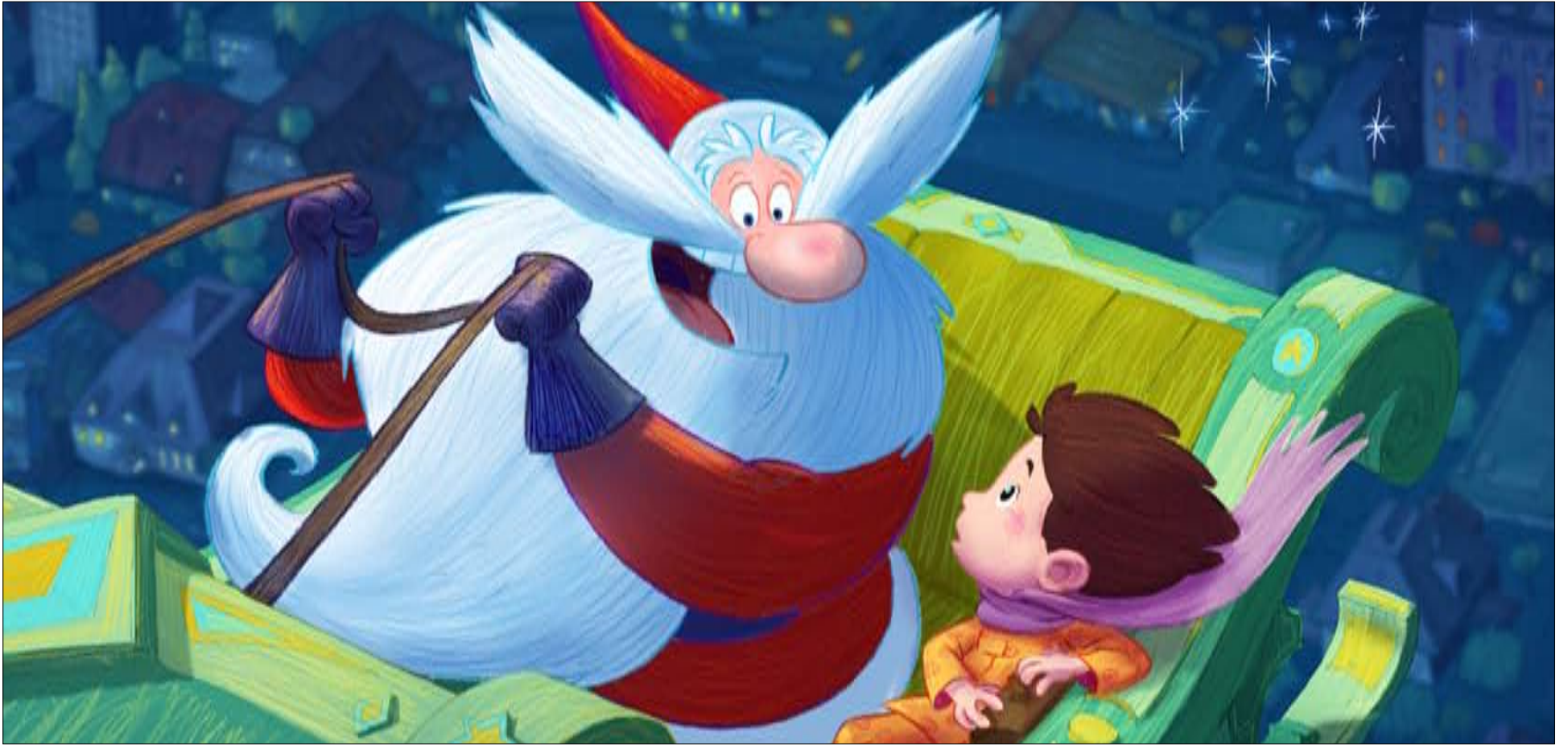
نقولا الصغير «تلميذ بابا نويل» النجيب، ولكن...