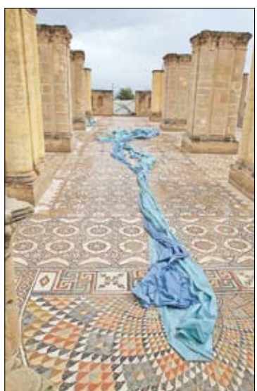
فسيفساء قصر هشام في أريحا

وفي الجهة الجنوبية من الحمام عُثِر على بركة سباحة بطول 20 متراً وعمق متر ونصف. وكان القصر قد زود بالمياه من نبعي الديوك والنويعة، أسفل