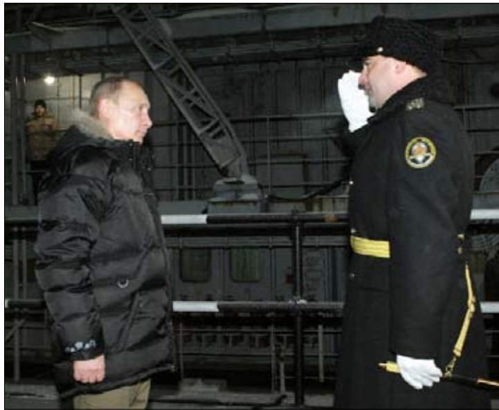
بوتين يتفقد غواصة نووية في سيفرودفينسك الأسبوع الماضي

في عام 2000 وصل فلاديمير بوتين إلى سدة الحكم في روسيا. وصل مقطب الجبين، كأنه يعلن إعادة ضبط الانفلات الذي رافق الانهيار، ووضع نصب عينيه هدفاً هو إعادة بناء القوة العسكرية.