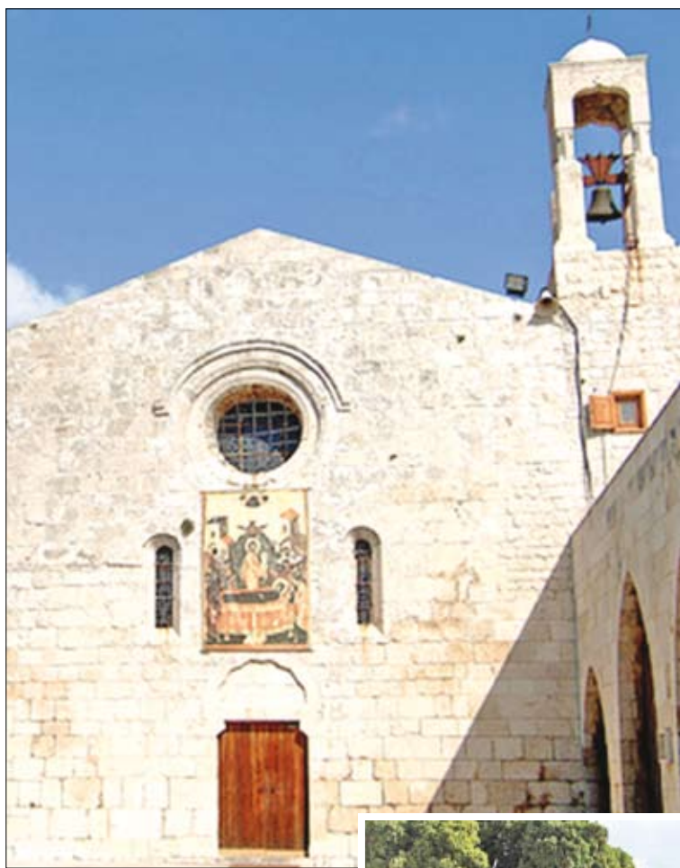
مدخل كنيسة سيدة البلمند الذي يعود تاريخ بنائه إلى السيستريين

ينفرد دير سيدة البلمند بهندسة السيستريية التي تتميز بالبساطة والصلابة