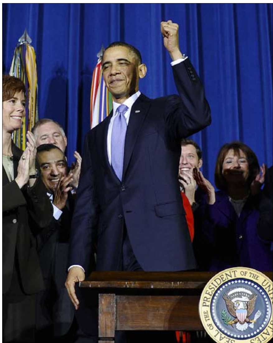
وقع أوباما على إبطال القانون مساء الأربعاء

هناك الكثير لفعله في ما يتعلق بالسؤال الأكبر عن الطريقة التي نعامل بها، كأمة، الأشخاص الذين نراهم مختلفين عنا