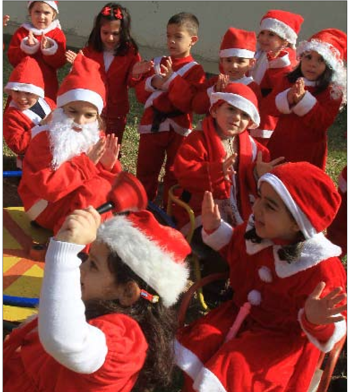
طالب الأهالي لا يقتصر أمر الهدايا على الأطفال

بابا نويل في صيدا. زارها، أمس، موزعاً هداياه على تلامذة المدارس، الذين غنوا للميلاد وللهدية خلف الباب. أما الكبار، فوزعوا اقتراحاتهم عليه، طالبين منه أن يمد الزعماء اللبنانيين بالنصائح، لعلمهم يتعظون، ولعل الميلاد يحمل «بركات» التسوية