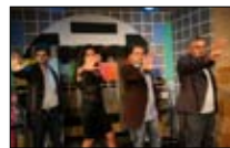
حلّوها... ليلة العيد 21:30 ■ «الجديد»