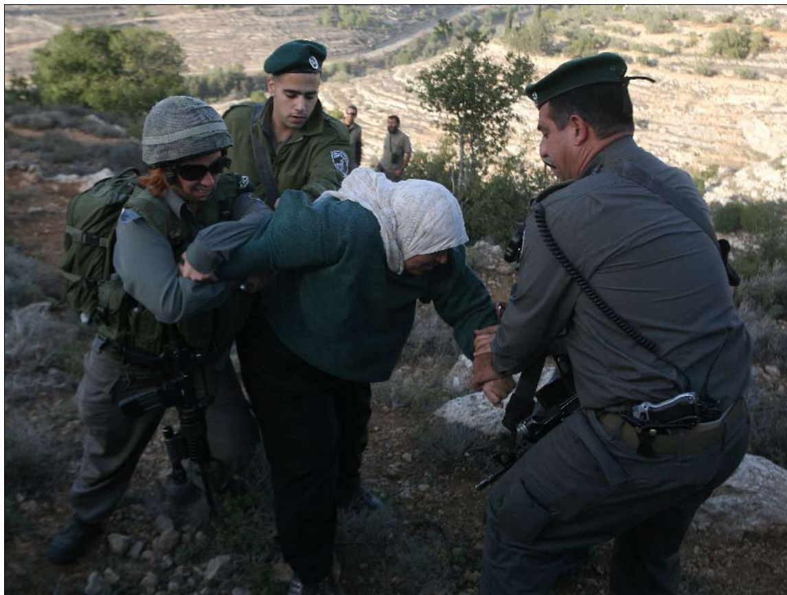
الجيش الإسرائيلي يعتقل فلسطينية خلال تظاهرة ضد الجدار العازل في الضفة أول من أمس

«السلام الآن»: نحو هيئة وحدة سكنية بوشر بناؤها من دون ترخيص في الضفة الغربية