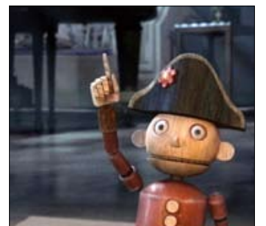
من «كسارة البندق»

Santa's Apprentice سينما سيتي (01/899993). أمير سويكو (1269). غراند كونكورد (01/343143).