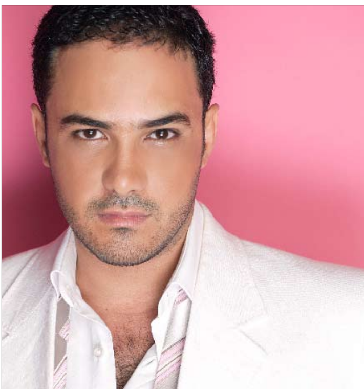
لم يتمكن محمد رجب من الحفاظ على النجاح الذي حققه عند إنطلاقته

يدرك الجميع أن تمتع أي ممثل بالموهبة لا يعني بالضرورة قدرته على تقديم أعمال ناجحة. هذه القاعدة يؤكدها النجم الشاب محمد رجب، الذي نجح خلال عشر سنوات في تكوين قاعدة جماهيرية جيدة والوصول إلى مرحلة البطولة المطلقة، وخصوصاً في السنوات الثلاث الأخيرة. هكذا برز الشاب في عدد من الأفلام من خلال دور البطل المساعد، وأبرز هذه الأعمال «ملاكى إسكندرية». وسرعان ما بدأ رجب مسيرته في البطولة المطلقة، لكن يمكن كل من شاهد أفلامه الأخيرة التي أدى فيها دور البطل، أن يلاحظ من دون عناء أن مستوى رجب يتراجع ولا يتقدم، إذ إنه اضطر إلى التكيف مع رؤية المنتج التجارية لا الفنية. هكذا حقق فيلم «فمن دسنة أشرار» نجاحاً سينمائياً وتلفزيونياً، وبقي مستوى أدائه متماسكاً في «كلاشينكوف». ولعل ما ساعد العاملين على النجاح هم الأبطال المشاركون إلى جانب رجب، مثل ياسمين عبد العزيز، ونيكول سابا، وخالد صالح، وغادة عادل... إلا أن خياره في فيلمه الثالث «المش مهندس حسن»، والرابع «محترم إلا