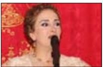
petit Jesus عند زاهي 21:30 ■ «المستقبل»