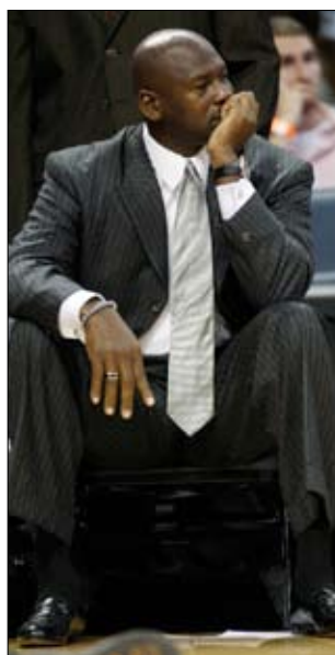
جوردان يتابع مباراة تشارلوت وتورننتو

غاب كارميلو انطوني عن دنفر بسبب وفاة شقيقته