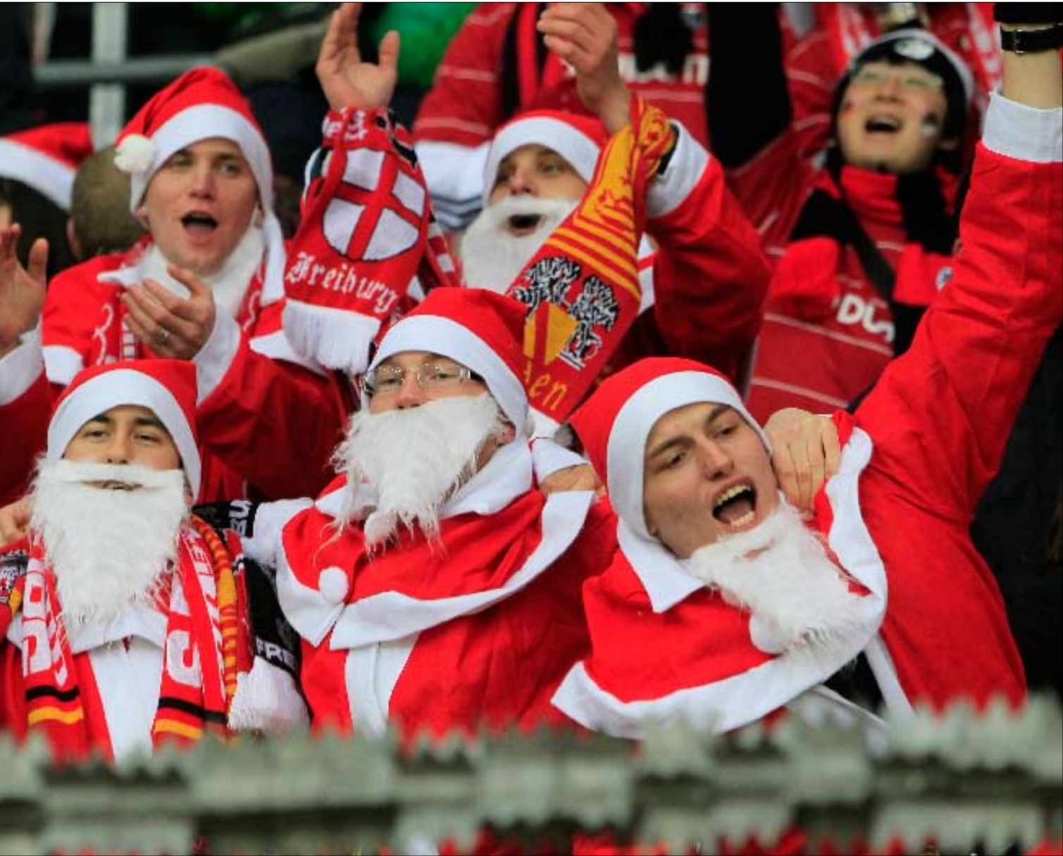
جمهير نادي فرايبورغ بلباس «بابا نويل» خلال مباراتهم أمام ليفركوزن في الدوري الألماني

وحده النجم الأرجنتيني ليونيل ميسي حظي بهدية استثنائية في عيد الميلاد من ناديه برشلونة تقديراً لجهوده الأخيرة، حيث قرر مدرب الفريق بيب غوارديولا منحه إجازة