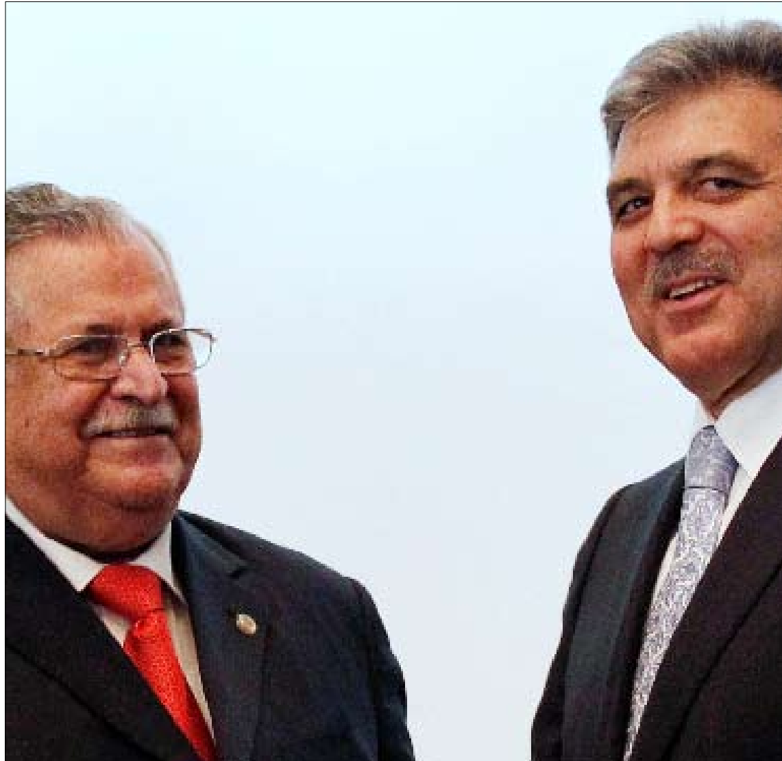
جلال الطالباني على خط الأزمة باقتراحه إقامة نظام متعدد اللغات في تركيا

قنبلة فجرها أكراد تركيا في مؤتمر موسّع لتجمعهم الأشمل «مؤتمر المجتمع الديمقراطي»، الذي يضمّ جميع أطراف المجتمع الكردي التركي، سياسياً من خلال حزب «السلام والديموقراطية»، واجتماعياً من خلال تمثيله عشرات منظمات المجتمع المدني والنقابات ورجال الأعمال والفنانين والمفكرين والأدباء... وبسرعة البرق، نسيت كل الأزمات الأخرى، ليعود جدول أعمال السجال السياسي محصوراً بـ«الانفصال الكردي»، وهو ما أدى إلى خروج الرؤوس الحامية من أوكارها، مع فتح دعوى لإغلاق حزب «السلام والديموقراطية» في المحكمة الدستورية، ودعوات لمقاضاة جميع من شاركوا في لقاء «مؤتمر المجتمع الديمقراطي» بديار بكر، وسط حملة سياسية معادية للأكراد توحدت فيها أحزاب المعارضة مع الحزب الحاكم. وجاء طرح «الحكم الذاتي الديمقراطي» الكردي كبلورة لـ«نظرية» أوجلان الشهيرة، عن الكونفدرالية الكردية العابرة للحدود التركية - السورية - العراقية - الإيرانية. بموجبها، سيبقى