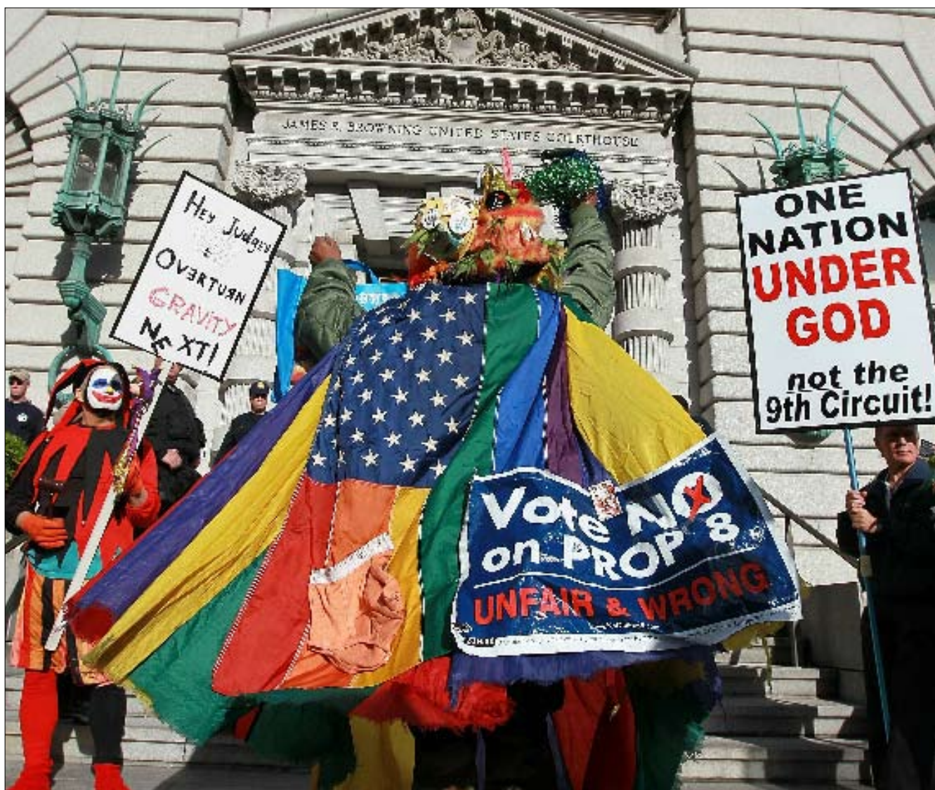
تظاهرة في كاليفورنيا اختلف فيها معارضو ومناصرو اعطاء المثليين حقوقهم (أ ب ف)

بلادهم، ثم الشجاعة للمخاطرة بمهنتهم، ترقياتهم، معاشاتهم التقاعدية، روايتهم، وفي بعض الأحيان حياتهم للوصول إلى هذا النهار. يمثل هؤلاء في أحيان عدة أغلبية صامتة من رجال ونساء مثليين ومثليات يريدون ببساطة أن ينتموا إلى عائلاتهم وبلادهم وكنائسهم ومجتمعاتهم التي يحبونها، والمساهمة فيها من دون أن يضطروا إلى الكذب بشأن حقيقتهم. هذا في النهاية، ليس من الحق في أن يكون المرء مثلياً، لكن الحق في خدمة أميركا، مثل كل تحركات الحقوق المدنية الكبرى، يعود الأمر في النهاية إلى العطاء وليس الأخذ.