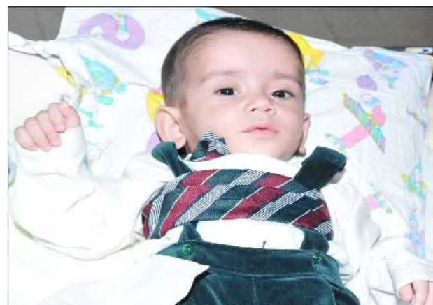
ما الذي يدفع ذويهم لتركه؟

مرة جديدة تُسجل القوى الأمنية حادثة العثور على طفل مرمر أمام جمعية خيرية أو مؤسسة دينية، وفيما كان أغلبية الأطفال الذين يعثر عليهم من الرضع وحديثي الولادة، فإن طفلاً تعدى السنة الأولى من العمر كان متروكاً في منطقة الحدث، وهو وفق معلومات وردت في ورقة تُركت معه يعاني مرض نقص الأوكسجين في الرأس. التحقيقات قائمة للتعرف إلى هوية ذوي الطفل، ومعرفة كيف ترك وحيداً أمام كنيسة. عممت المديرية العامة لقوى الأمن الداخلي، بناءً على إشارة القضاء المختص، صورة لطفل مجهول الهوية، عُثر عليه يوم الإثنين 10/11/2010 أمام