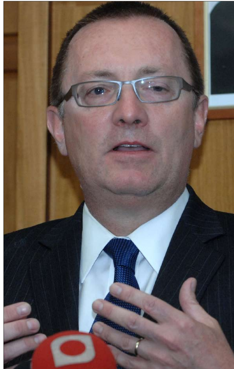
فيلتمان في بيروت: صوتوا مع المحكمة وسنحميكم!

في الأيام القليلة الماضية، استقبل الرئيس السوري كلاً من وليد جنبلاط ونبيه بري والرئيس عمر كرامي، بينما كانت بعض الشخصيات في المعارضة تلتقي في بيروت قياديين رفيعي المستوى من حزب الله، كان البحث في بيروت يدور حول المرحلة المقبلة، وكان في الأفق حديث عن احتمالات، وعن ترتيبات واستعدادات، لكن هذه المرة لم يتسرب الكثير مما حصل ومما يعد، ولم يشارك كل حلفاء حزب الله في المشاورات والدراسات والترتيبات التي جرى إعدادها للمقبل من الأيام، بل اكتفي بعدد منهم دون غيرهم. وسبكون لدى الأمين العام لحزب الله إطلالتان إعلاميتان، الأولى يوم الحادي عشر من شهر تشرين الثاني المقبل في يوم الشهيد، والأخرى لم يحدد موعدها بعد.