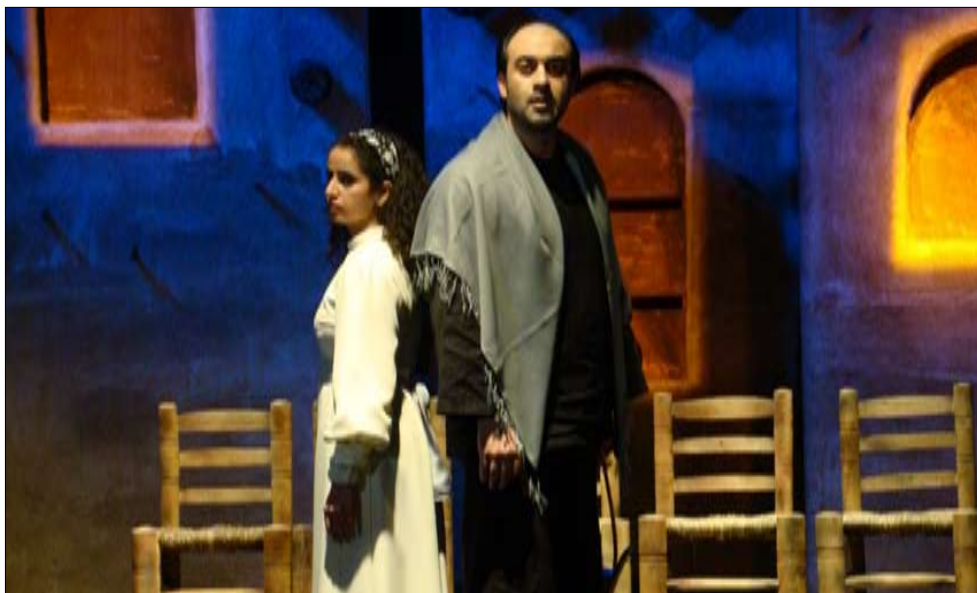
وانل ابو غزالة ولما الحكيم في العرض

تداعيات متعددة، توصل والد الشهيد مع نهاية العرض إلى المعتقل. يبني زيدان المسرحية على سؤال مفترض يستحيل حدوثة، لكنه يترك فرصة أمام المشاهد ليتخيل حال شهداء الوطن العربي. وقد تكون عودة العرض نحو آخر الحروب على الجبهات السورية نوعاً من الدلالة على توقف الزمن، والإحالة على إشكاليات لم تتغير، بل صارت أكثر تعقيداً. هكذا، يتجاوز أساليب المسرح العالمي، بما فيها الطريقة الأرسطية التي تجعل من العمل الدرامي موازاة مستقلة للحياة الواقعية، ويفصلها عن الجمهور حاجز وهمي.