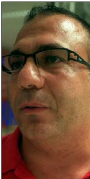
مدرب منتخب الصالات دوري زخور

الموافقة على منح إذاعة «البشائر» الحقوق الحصرية للبث الإذاعي لمباريات البطولات الرسمية للموسم الرياضي 2010 - 2011. أقيمت أمس ثلاث مباريات ضمن الدور التمهيدي الثاني لكأس لبنان، ففاز حركة الشباب على التقدم عنقون 6 - 4 بعد التعادل 3 - 3 في الوقت الأصلي على ملعب برج حمود، وفاز المحبة طرابلس على الاجتماعي 6 - 5 بركلات الترجيح بعد التعادل سلباً في الوقت الأصلي 1 - 1 في الوقت الإضافي على ملعب بلدية طرابلس. وفاز الإرشاد على الحكمة 2 - 1 على ملعب بحمدون، علماً أن الحكمة لعب المباراة بثمانية لاعبين وحارس لعدم وجود لاعبين كافين موقعين على كشوف النادي قبل انطلاق مسابقة الكأس.