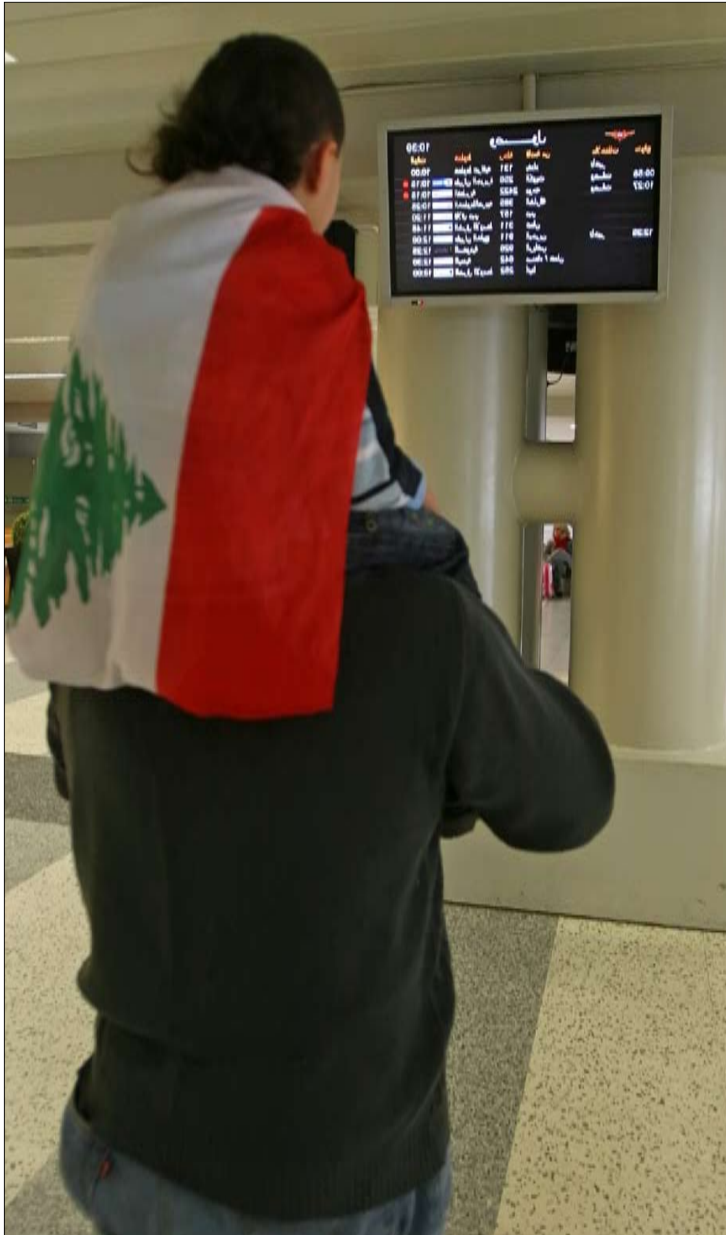
كان شركة «باك» لم تكتف بالأرباح الطائلة التي جنتها من المطار حتى الآن

قد يكون تسريب الوثيقة التي أرسلتها شركة «باك» إلى «الأخبار» ناجماً عن خطأ في تقدير مضمونها، أو بهدف إطلاق تهديد علني بأن أي قرار يؤدي إلى إخراج شركة «باك» من السوق الحرة في المطار سيكبد الخزينة العامة مبالغ طائلة، هي عبارة عن تعويضات مزعومة ستنتج عن تقصير مدة العقد الأساسي، أي 15 سنة، وهو تماماً ما سعت «الأخبار» إلى فضحه، إذ أشارت إلى وجود «لعبة» تقضي بتمديد عقد الشركة كل 4 سنوات، في تحايل فاضح على القوانين وقرارات هيئات الرقابة، ولا سيما ديوان المحاسبة.