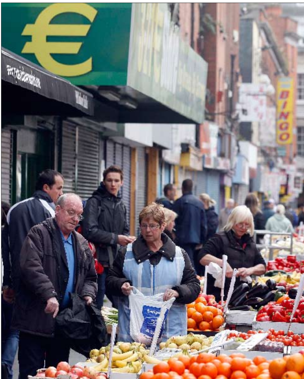
الأزمة انعكست على القدرة الشرائية للإيرلنديين

آخر. وتقول ليز، وهي مدرسة، «كنت أعيش وأصرف مرتين قيمة مدخولي الشهري». وتضيف «كنت أنقل أولادي إلى المدرسة بسيارة رباعية الدفع جديدة». تتنهد وتتابع «كان يكفي أن أسحب بطاقة مصرفي لأحصل على ما أريد».