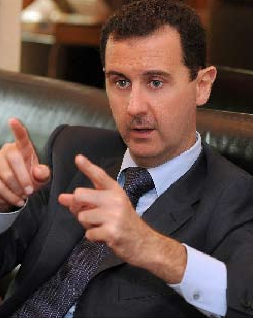
رعى الأسد الكرة بذكاء بين قدمي الحريري

الوصول إلى الجدران المسدودة، إذا حصل ذلك، فهي لا تود نهاية كهذه لسعد رفيق الحريري. وإذ يشير أحد المتابعين إلى الدقة السورية اللامتناهية في اختيار الكلمة المناسبة للمكان المناسب، يلفت إلى إبداء الرئيس الأسد في حديثه الصحافي