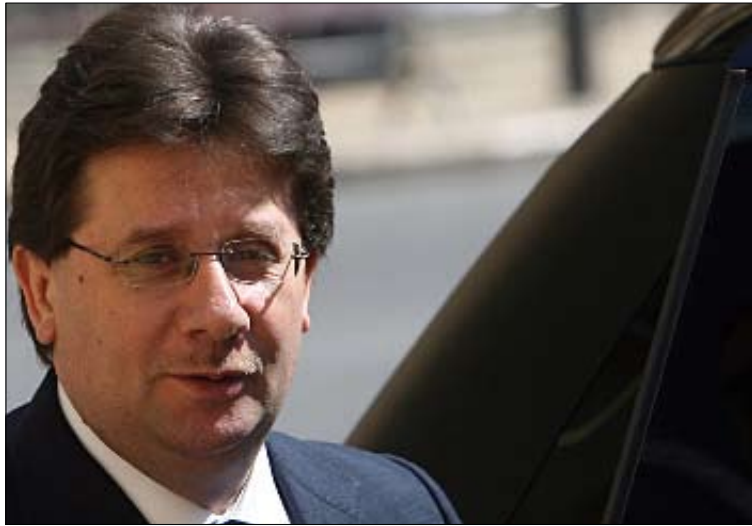
كنعان: لا نستطيع إقرار الموازنة قبل درس قانون قطع الحساب

وأوضح كنعان أن جلسات الاستماع في موضوع قطع الحساب تتصل بالموازنة، لكنها لا تؤخر أو تعطل إقرار أو إنجاز الموازنة، ولا علاقة لها بتأخير الموازنة، لا بل على العكس، فإن هذه الجلسات تسهم في التوصل إلى حلول وتحديد المسؤوليات، وإلى قانون قطع الحساب. في المقابل، تستمر أعمال لجنة المال، بالتوازي مع هذه الجلسات، في بحث مواد مشروع قانون موازنة عام 2010، وتسير اللجنة في خطى سريعة لإنجاز مشروع موازنة عام 2010، إلا أنه «لا نستطيع إقرار هذه الموازنة وتصديقها في الهيئة العامة قبل أن ندرس قانون قطع الحساب، لذلك نحن مهتمون، وخصوصاً بعد الموقف الذي صدر عن ديوان المحاسبة، بعملية دفع الأمور إلى الأمام ومعالجة هذا الخلل المحاسبي القائم منذ عام 1993 حتى اليوم».