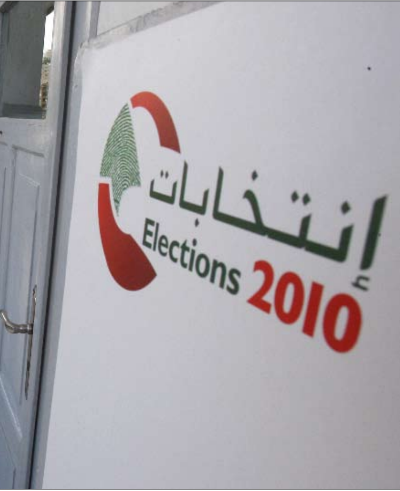
هل تؤدي الاستقالات إلى زيادة البلديات التي ستخضع لانتخابات جديدة