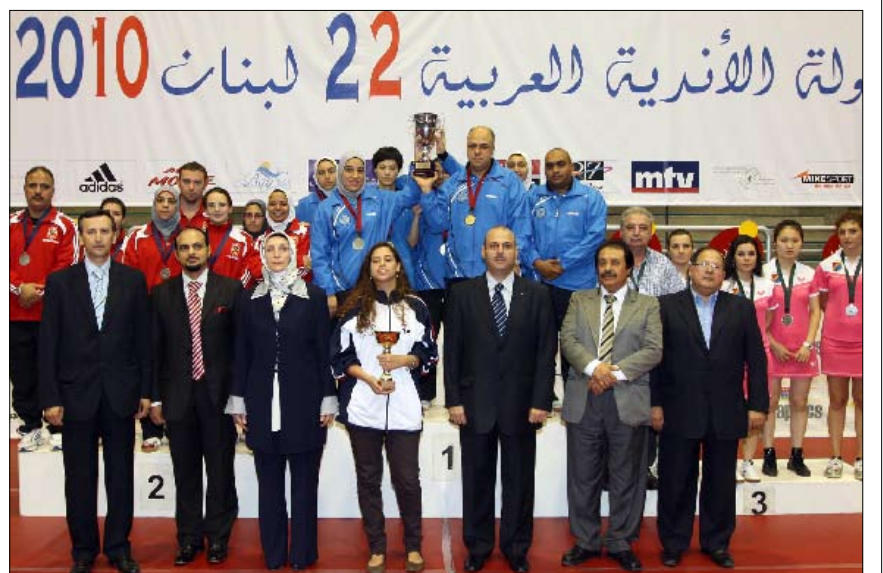
سيدات الإنتاج الحربي لحظة تتويجهن بكأس البطولة

وفي لقاء تحديد المركزين الثالث والرابع، أحزرت سيدات نادي هومنتمن (لبنان) المركز الثالث،