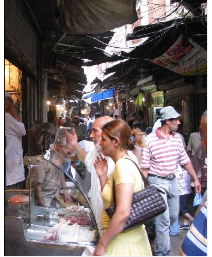
مجرد 500 ليرة تفرق في حسابات الناس هنا (الأخبار)

بعد البنزين والخبز، ها هي أسعار الخضار واللحوم وسائر المواد الغذائية ترتفع بطريقة جنونية. وحدها القدرة المعيشية للناس تنخفض، أما طرابلس التي كانت ملاذ الفقراء، فهي الأخرى تخترع أساليب للتأقلم