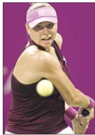
فيرا زفوناريفا

وضمن المجموعة ذاتها فازت الأسترالية سامانتا ستوسور الخامسة على الإيطالية فرانيسكا سكيافوني الرابعة 4-6 و 4-6. وحذت الروسية فيرا زفوناريفا المصنفة ثمانية جذو فوزنياكي، وحقت فوزاً سهلاً على الصربية يلينا يانكوفيتش السادسة 6-0 و 3-0 في الجولة الأولى من منافسات المجموعة البيضاء. (أ ف ب)