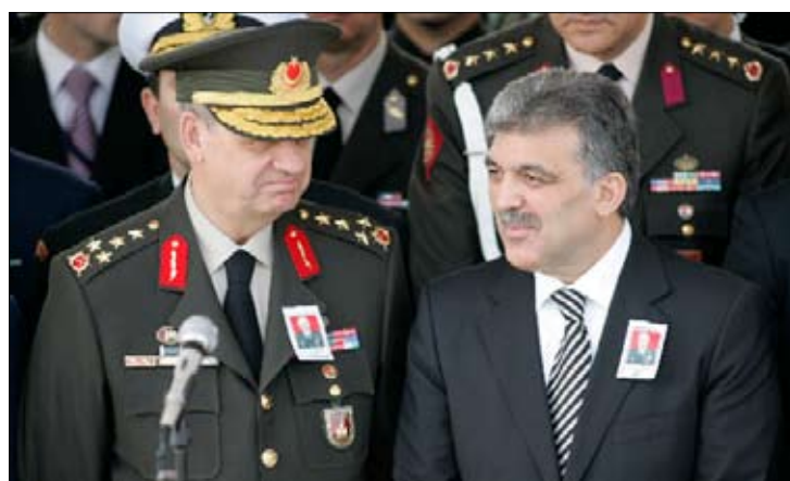
في عهد القائد السابق للجيش الكر باسبوغ فتح «الصندوق الأسود» للجيش