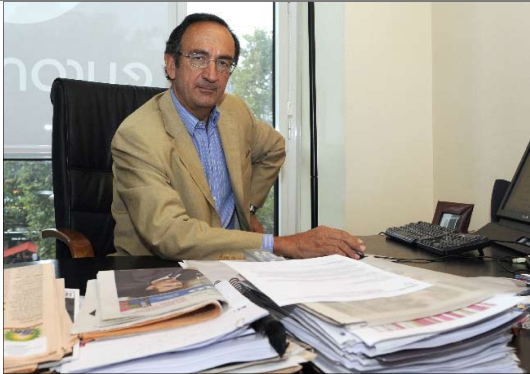
رئيس «أورونيوز» فيليب كايلا

«أورونيوز» الفارسية ستعتمد على 17 صحافياً من أصل إيراني معظمهم من حاملي الجنسيات الفرنسية والأوروبية المختلفة. وستبث على خمسة أقمار صناعية هي «نايل سات 101»، و«أراب سات - بدر 4» و «هوت بيرد»، و«أوروبيرد»، و«آسيا سات»... وكانت المحطة قد أطلقت صفحتها الفارسية على الموقع الإلكتروني منذ أسبوع، مستبقة بذلك الإطلاق التلفزيوني الرسمي اليوم عند الساعة الثامنة والنصف بتوقيت بيروت. يذكر أن الموقع سيضيف خدمة «النقل الحي» إلى الصفحة الفارسية أيضاً.