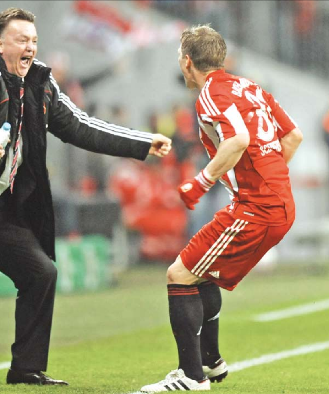
شفاينستايغر محتفلاً مع مديره لويس فان غال بعد تسجيله هدفه الثاني في مرمى بريمن

افتتح ريال مدريد الدور الـ32 من مسابقة كأس إسبانيا بتعادل سلبي مخيب للأمال مع مضيفه ريال مورسيا. فبرغم ضغط الفريق الملكي على مدار المباراة لم يستطع أن يهز الفريق الملكي شبك خصمه في ظل تعلق دفاع ريال مورسيا ومن ورائه