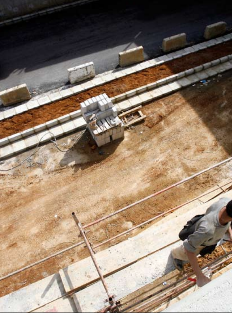
10 مليارات ليرة مرصودة لفروقات متعهدي الهيئة العليا للإغاثة

المهندسين وممثّلين عن الإدارات الرسمية، وهي تنطبق على أشغال مختلفة مثل الحفريات والتزفيت والإنشاءات... على أنه لا يمكن أن تطاول الفروق أكثر من 60% من المشروع، لتكون بمثابة تعويض عن أيّ خسائر ممكنة. على هذا الأساس بدأت الإدارات الرسمية المعنية تتلقى طلبات فروق الأسعار، مثل مجلس الإنماء والإعمار ووزارة الأشغال العامة ووزارة الطاقة والمياه وغير إدارات ومؤسسات عامة لزمّت تنفيذ أشغال بين 2002 و2004، فعلى سبيل المثال تبين أن مستحقات المتعهدين عن تزيينات أجراها مجلس الإنماء والإعمار بلغت 310 مليارات ليرة،