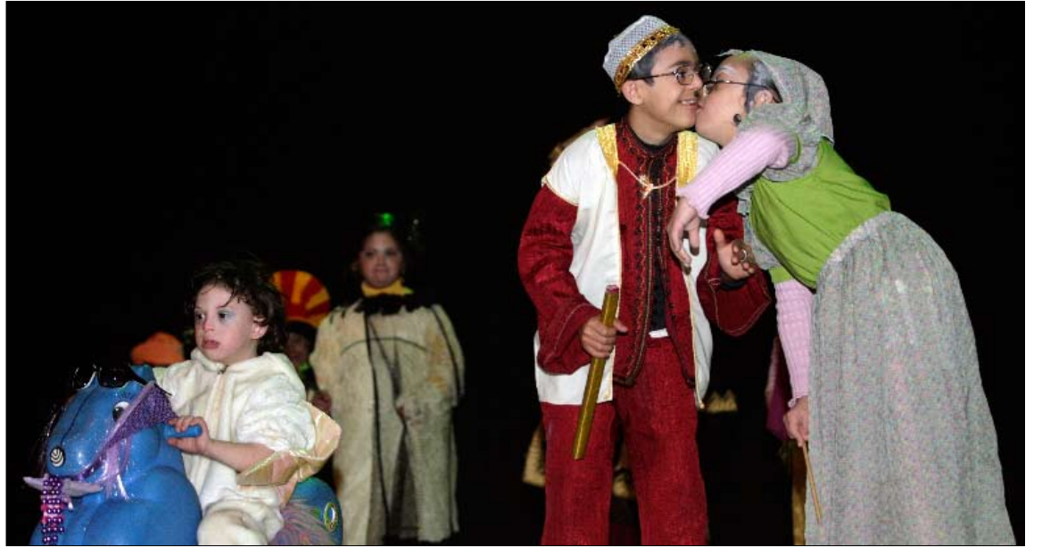
من مهرجان المواهب الخاصة للمعوقين