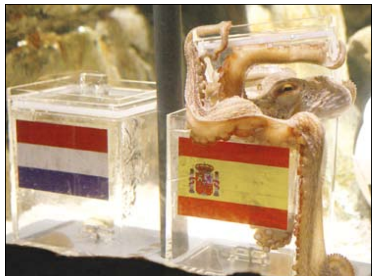
بول متوقفاً فوز إسبانيا على هولندا في نهائي مونداليات 2010 (أ ف ب)