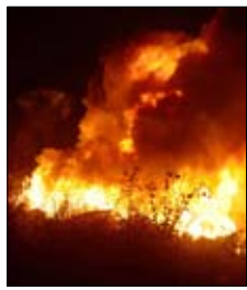
وعناصر الدفاع المدني حرائق شتت

عادت درجات الحرارة إلى الارتفاع وعادت معها الحرائق. فصباح أمس، شبّ حريق كبير في خراج بلدة الريحان أتى على عدد كبير من الأشجار الحرجية من صنوبر وسنديان. وقد بقي عناصر الدفاع المدني حتى ساعة متأخرة ليتمكنوا من إخماده. على صعيد آخر، أهدمت وحدات الجيش وعناصر الدفاع المدني حرائق شتت يوم أول من أمس في خراج بلدات عيتات ودير القمر ووادي الست وكفرقطة والكنيسة وعميق وبلحبي ومزرعة السيد وأدونيس وكروم العنب وتلعباس والقنبر. وقد قدرت المساحات المتضررة بنحو 187 دونماً من الأشجار المثمرة والحرجية والأعشاب اليابسة.