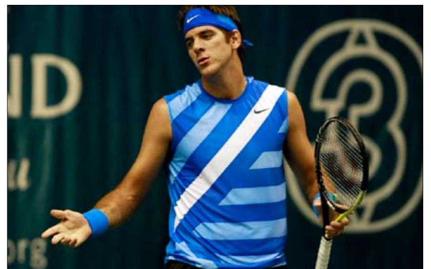
دل بوترو خانبا لخسارته إحدى النقاط خلال مباراته وروشو