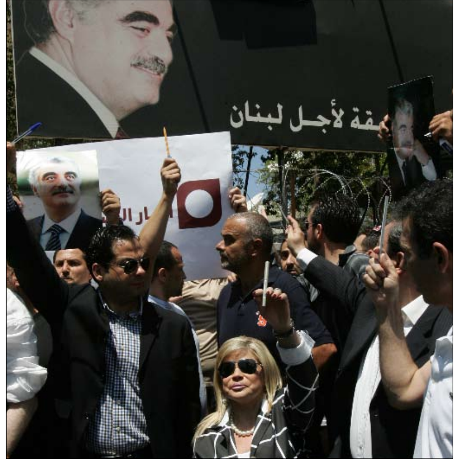
لم يزر الحريري مؤسساته الإعلامية المتضررة بفعل أحداث 7 أيار