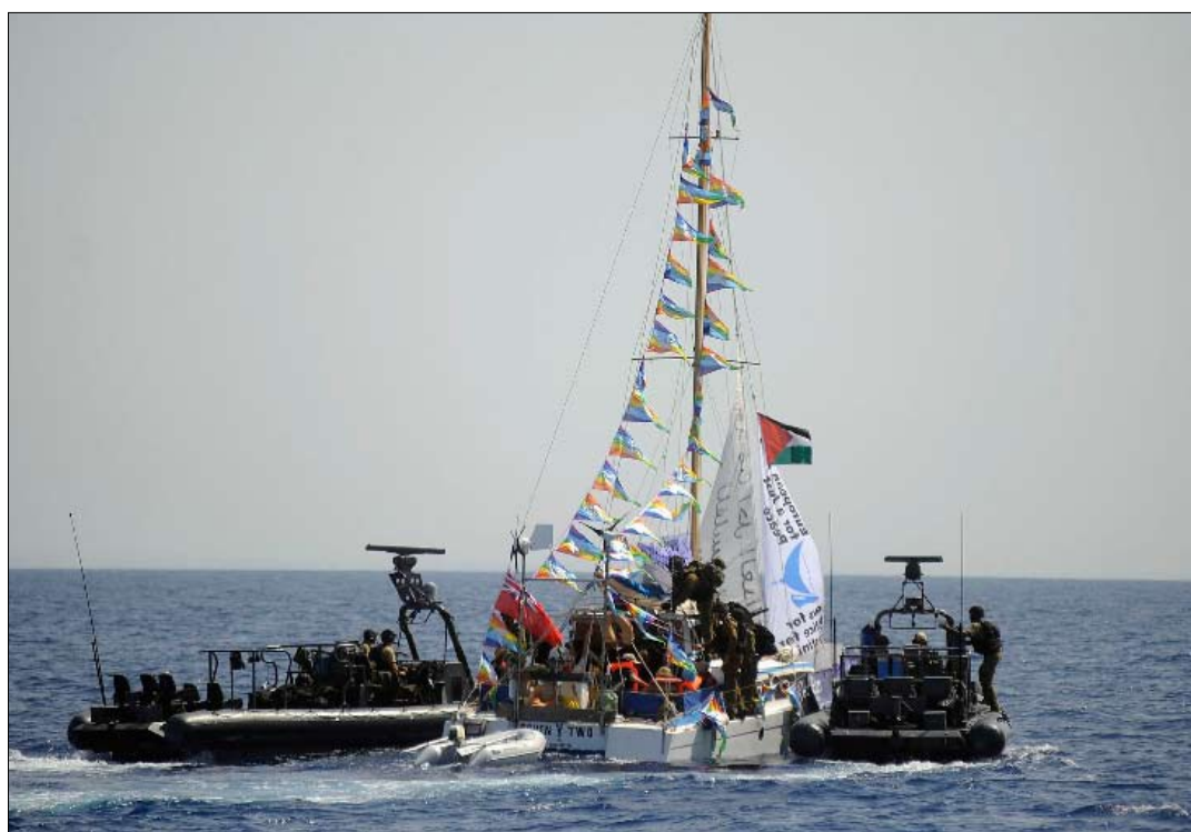
جنود اسرانيليون يحيطون بالقارب بعد الاستيلاء عليه

إلا أن الاتحاد الأوروبي اقترح على مجلس حقوق الإنسان أن «يرفع التقرير إلى لجنة» الخبراء التي ألفها الأمين العام للأمم المتحدة، بان كي مون، في نيويورك. ودعت ممثلة الاتحاد الأوروبي إسرائيل إلى «التعاون كلياً» مع تلك اللجنة.