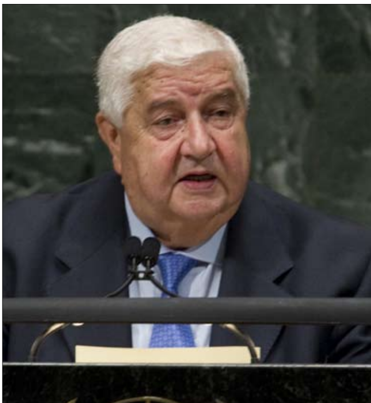
المعلم ملقياً كلمة سوريا أمام الجمعية العامة للأمم المتحدة أمس

ثم انتقل إلى الشأن العراقي، الذي «يبقى موضع اهتمام سوريا وقلقها لدى تردّي الأوضاع فيه، وموضع ارتياحنا لدى تقدم هذه الأوضاع». وشدد على الالتزام بوحدة وسيادة وعروبة واستقلال العراق البلد المسلم. ورحب بانسحاب الأميركيين من العراق، معرباً عن تطلعه لإمسك القوات العراقية بزمام الأمور لهذه الغاية. وأعرب عن دعم بلاده لجعل الشرق الأوسط منطقة مجردة من السلاح النووي بناءً على المبادرة التي قدمتها سوريا إلى مجلس الأمن عام 2003، مؤكداً