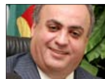
ونام وهاب الليلة أيضاً على الشاشة 20:30 ■ nbn