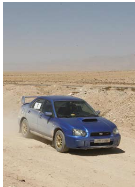
لقطة من منافسات العام الماضي

يشهد الرالي مراحل جديدة لإبراز مهارة السائقين