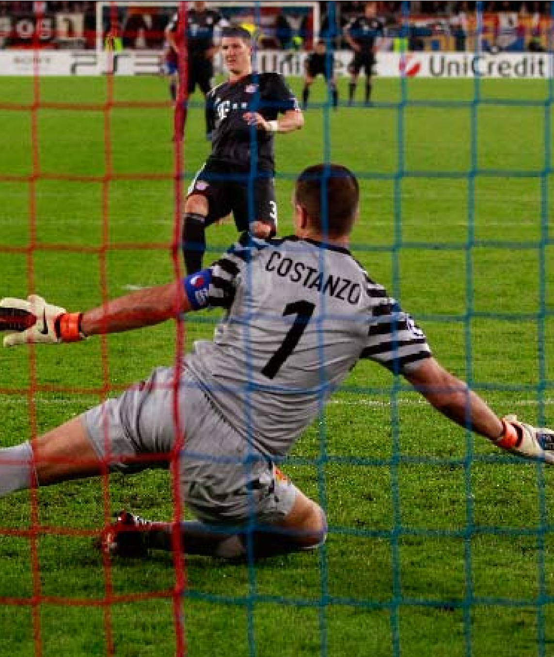
شفائينشتايفر مسجلاً هدف بايرن الأول

ابراهيموفيتش مسجل هدف التعادل لميلان في مرمى اياكس (الصورة الأولى) دي ماريا محقق الفوز لريال (الصورة الثانية)