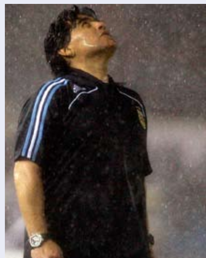
دييغو مارادونا (أرشيف)

من عزلته. أطلق كلماته بعد زيارته الرئيس الأرجنتيني الأسبق نيكستور كيرشنير: أتوق للعودة إلى تدريب الأرجنتين. أخطأ مارادونا هذه المرة، اعتقد لوهلة أنه بكسبه لدعم الرئيس يستطيع أن يكسب معركته الحالية. لكن هيهات، فهي صحيفة «البرافدا» الروسية تورد أمس أن الجماهير الأرجنتينية رفضت عودة مارادونا لقيادة «التانغو» بعد ندائه الأخير، مشيرة إلى أن 1 على 10 فقط يوافقون على عودة مارادونا في الاستفتاء الذي أجرته كبرى الشركات الإعلانية في البلاد. ها هي الصحف الأرجنتينية تواصل تهكمها على النجم الكبير، بوصفها إياه بال«أجدد»، وهو اللقب الذي كان يطلق عليه في الثمانينات، لا للتهكم عليه، بل بسبب شعره الكثيف. مارادونا إذاً في وجه العاصفة وحيداً، لكنه يبقى... مارادونا.