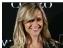
sweet home alabama 12:00 ■ mbc max