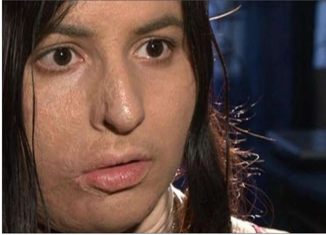
مشهد من الوثائقي