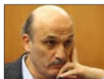
«الحكيم» عون و... عونيك! 21:00 ■ «أخبار المستقبل»