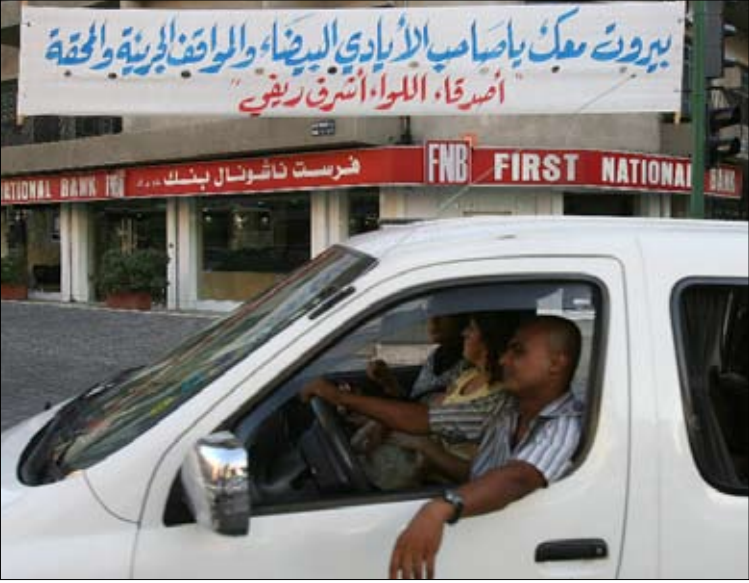
عَلقت في شوارع بيروت أمس لافتات داعمة للواء أشرف ريفي

حاول نواب الأكثرية، أمس، تفجير جلسة لجنة المال والموازنة بإصرارهم على عدم قانونية ما جرى في جلسة 16 أيلول التي أسقط فيها بند تمويل المحكمة. لكن جلسة أمس انتهت بإحالة الملف إلى الهيئة العامة وهيئة مكتب المجلس، وهو ما حاول الإشارة إليه النائب إبراهيم كنعان في بداية الجلسة. أما العماد ميشال عون، فأعاد فتح ملف فرع المعلومات وتجاوزاته