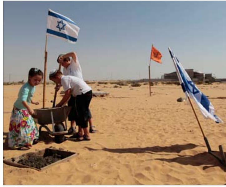
اطفال إسرائيليون يلعبون بعد وضع حجر الأساس لمدرسة في مستوطنة نافيه (أ ب)

فقد ذكرت «هآرتس» أنّ التباضي الذي يظهره المستوطنون لا ينبغي أن يفاجئ أحداً، وذكرت بالتباضي الذي أظهره إبان فترة رئاسة إيهود باراك في عام 2000 الذي بنى لهم في تلك الفترة نحو 4700 وحدة سكنية.