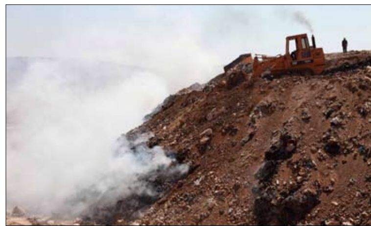
تكرر الانفجارات في المكب ناشرة دخاناً ساماً في المنطقة