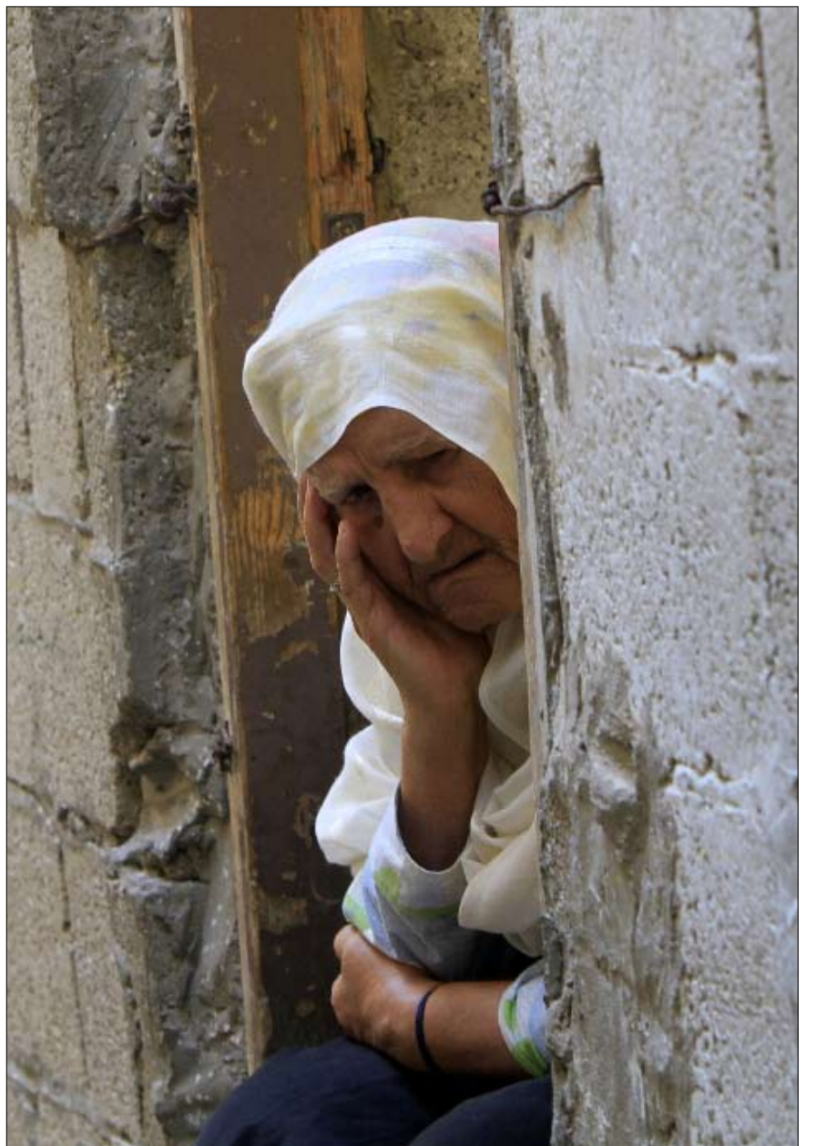
فلسطينية في مخيم البريج في غزة

بعد ذلك يعلن الجانب الفلسطيني أن قضية اللاجئين قد وجدت طريقها إلى الحل، وأن ملفها قد أُلغى نهائياً، وأنه ليست لدى الجانب