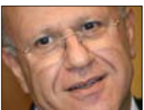
ماغي: هضامة بلا حدود 21:00 ■ OTV