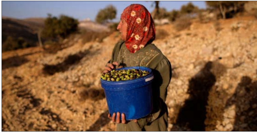
فلسطينية تحمل دلو زيتون في رام الله أول من أمس (محمد محيسن - أ ب)

ليبرمان يرى أن التوصل إلى اتفاق بين إسرائيل والفلسطينيين قد يستغرق عقوداً