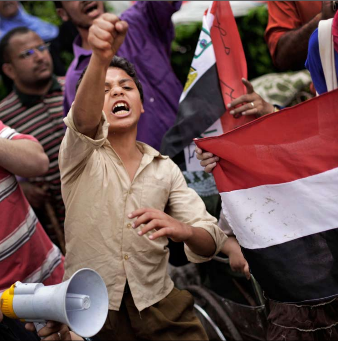
من تظاهرة للعمال والمؤقتين امام مبنى البرلمان في القاهرة الثلاثاء الفائت

وقد تبارى هذا النائب مع آخرين من نواب الحزب الوطني، وممثلي وزارة الداخلية، وأشياعهم من ثواب (منشقين) على بعض أحزاب المعارضة، مثل النائب رجب حميدة، في كيل الاتهامات لمعارضى السلطة في مصر بالعمل بالخارج، والتحريض على مواجهة التظاهرات السلمية لدعاة التغيير، بالرصاص الحي. وذلك تحت زعم مخلوق بأنهم «ممولون، يتاجرون بأحلام الوطن، ويريدون فوضى خلاقة»، كما قالتها كوندوليزا رايس. ثم، (وفي السكّة)، لا ينسى الشيخ رجب الذي كوّن ثروة هائلة من علاقاته بالنظام، «ردّ الجميل» للسلطة في أزمته، والتلويح بهراوة الدين للانتقام من خصومه وخصوم الحكم: «...إننا لن نضع أيدينا في أيدي نجسة... أو مع الذين لا يسجدون لله!». ثم يزايد على جوقه النظام ذاته، أعضاء الحزب «الوطني»، في التحريض على إهدار دم المعارضين، وبالذات الشباب منهم: «إنني أعيب على (وزارة) الداخلية أنها