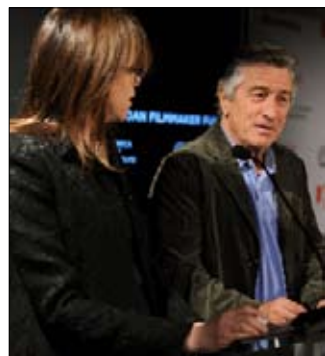
روبرت دي نيرو وجاين روزنثال

تغيب الأفلام العربية عن دورة هذا العام، رغم أمال بمشاركة شريط ميشيل خليفي «الزنديق». لكن غياب العدسات العربية، لا يعني غياب المنطقة عن فعاليات المهرجان، إذ حضر مصر من خلال فيلم الكندية ربي ندى «توقيت القاهرة»، والخليج العربي مع الشريط الأيسلندي «الكوكابين