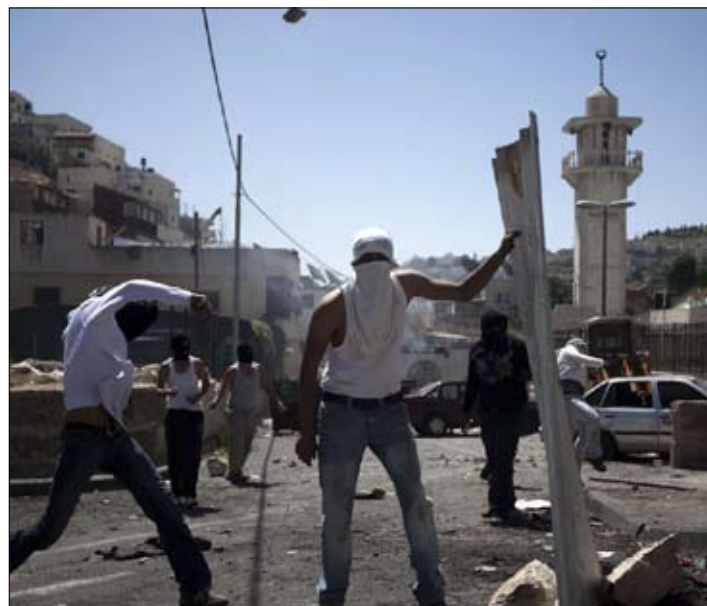
فلسطينيون يشاركون في المواجهات مع القوات الإسرائيلية في بلدة سلوان

استفاق أهالي سلوان في القدس المحتلة، أمس، على جولة جديدة من الصراع، وكأن أوامر الهدم التي تلوح في أفق عشرات بيوت الحي لا تكفي لإنهاك أهله. أمس تصاعدت تحديات أهل سلوان. كانوا على موعد مع مسيرة بنظمها اليمينيون المتطرفون في الحي، المستهدف أصلاً من قبل الجمعيات الاستيطانية لتهويده. هذا الاستفزاز بات تقليداً في سياسة اليمين المتطرف، بدعم من المؤسسة الرسمية والمستشار القضائي للحكومة. مسيرة ضمن مسيرات استفزازية تقم