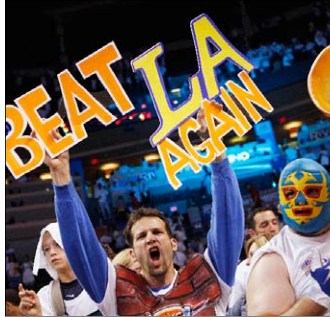
جمهور أوكلاهوما سيتي تاندر محتفلاً بالفوز على لوس أنجلوس لايكرز

وقدم سان انطونيو سبرزز رباعاً أخيراً قويا أمام ضيفه دالاس