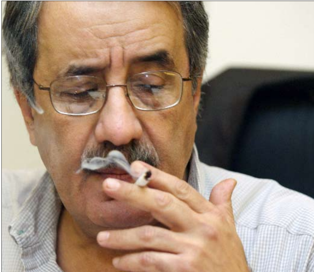
وزير الاتصالات شربل نحاس

أما السبب الثاني لهذا الهجوم على نحاس، فترده المصادر المنضوية تحت لواء المعارضة السابقة إلى الدور الذي يقوم به نحاس في «المناقشة الجدية والعلمية للبروحات المالية والاقتصادية التي يعرضها فريق تيار المستقبل في الحكومة».