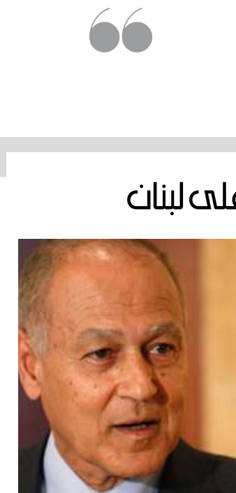
أبو الغيط في بيروت

وضعت مصادر في المعارضة السابقة الهجوم على نحاس في إطار الرد على معارضته سياسة «المستقبل» المالية