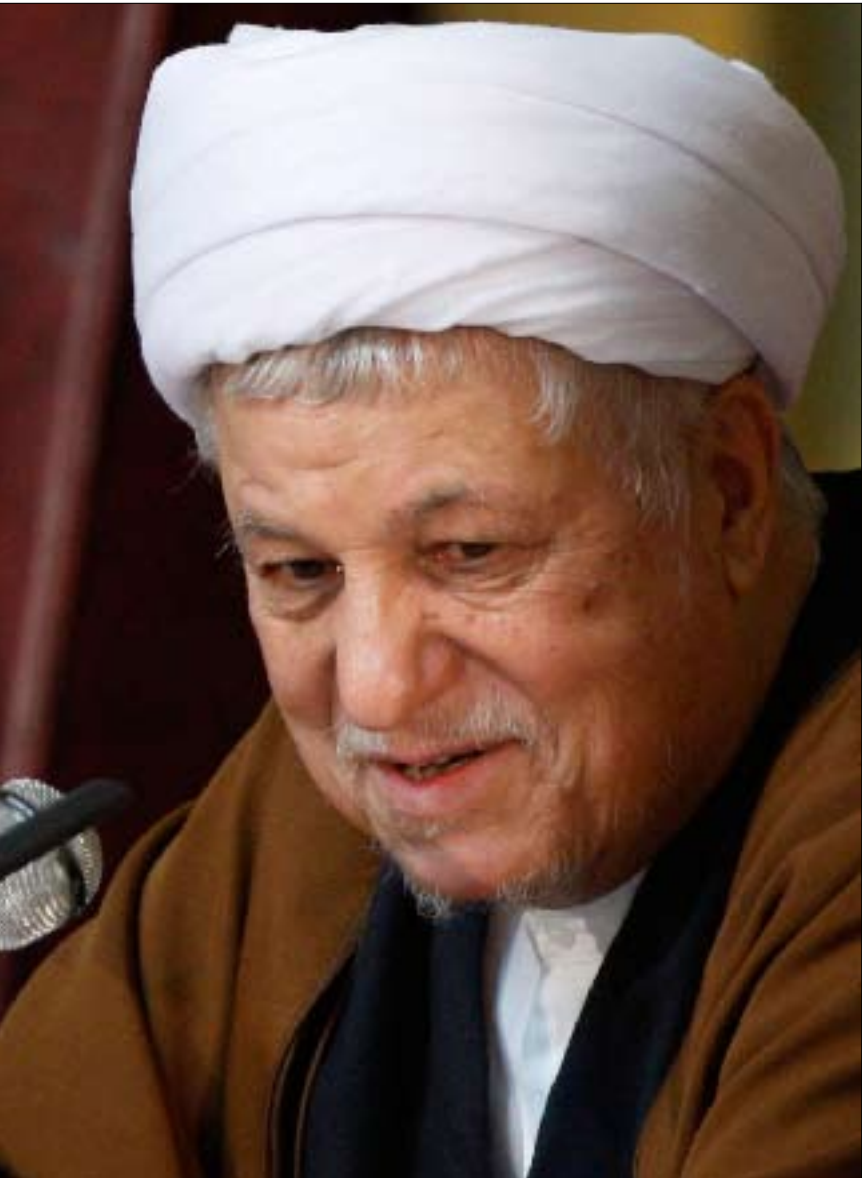
رئيس مجلس الخبراء أكبر هاشمي رفسنجاني (أرشيف)

مقربون من رفسنجاني يقولون إنه بلغ مرحلة، خلال فترة الاضطرابات،