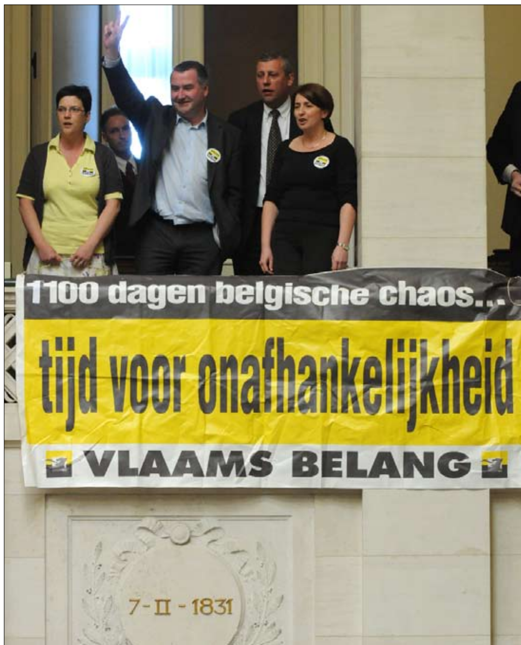
أعضاء في أحد أحزاب الفلامان بعد رفعهم لافتة تطالب بالاستقلال في مقر البرلمان البلجيكي

بين صفوف مواطنيها، إضافة إلى ازدياد أعداد المهاجرين، زادت من حدة المواجهات، التي وإن هي تبرزت تحت عنوان «لغوي»، فهي تعود إلى ما قبل بداية تاريخ بلجيكا الحديث الذي تُوِّرَّخه الكتب في عام 1930، وهو تاريخ حمل بذور نزاعات اليوم.