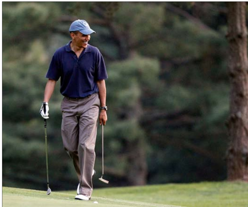
باراك أوباما وغلطة الشاطر

الرئاسية الأخيرة، وما تلاها من عمليات قمع ممنهج للمعارضة الإيرانية. لكن صلاحيتها شارفت على الانتهاء بعد التطورات «العاصفة» التي شهدتها الملف الإيراني مذاك. فمن يعرف التاريخ الإيراني جيداً يدرك أن التباينات على كيفية إدارة الدولة بين الأفرقاء المتنازعين لا تسحب بالضرورة على تصور الأمة الإيرانية لطبيعة التحديات الوجودية التي تجابهها. فعندما يصل الأمر إلى حد التلويح باستخدام السلاح النووي ضد إيران (كما فعل أوباما أخيراً) إذا لم تلتزم هذه الأخيرة بشروط «الإجماع الدولي» ضدها تنتفي تلقائياً مشاهد مطاردات الطلبة في شوارع طهران وأصفهان وتبريز، ولا يعود هناك من فرق يذكر بين معارض وموال، ويغدو مفهوماً جداً أن يخرج زعيم المعارضة الإصلاحية مير حسين موسوي بتصريحات أقل ما يقال فيها إنها تنسف كل ترتيبات الحقبة السابقة. تصريحات لو لم ينهها موسوي بالتذكير بدور ما للنظام في ما يحدث اليوم، لقلنا إنها صادرة عن أحمدى نجاد أو عن المرشد علي خامنئي، لا عن الرجل الذي أطلق «آخر الثورات الملونة» في مواجهة سلطتهما الدينية - العسكرية. ومما قاله موسوي: «الأمة الإيرانية بكاملها ستقاوم موحدة في وجه المخاطر الخارجية، لكنها لن تنسى من هو، في داخل البلاد، مسؤول عن هذا الوضع».