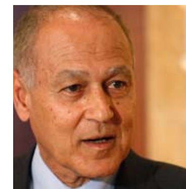
أبو الغيط في بيروت

حتى مساء أمس، كان من الصعب أن يتفق سياسيان على تفسير موحد للزيارة المفاجئة التي قام بها وزير الخارجية المصري، أحمد أبو الغيط إلى بيروت، حيث قضى فيها أقل من 10 ساعات، التقى فيها الرئيس نبيه بري وسعد الحريري، ووزير الخارجية علي الشامي. وتمحورت الأسئلة التي شغلت الأوساط السياسية حول ما إذا كان أبو الغيط قد نقل رسالة إسرائيلية إلى الحكومة اللبنانية. لكن، ما اتفق عليه المختطفون هو المفاجأة التي خلفتها «اللغة الجديدة» التي استخدمها أبو الغيط، سواء خلال حديثه عن إسرائيل واحتمال شن عدوان على لبنان، أو في الرسائل التي وجهها إلى سوريا. وذكر سياسي مقرب من رئيس الحكومة سعد الحريري لـ«الأخبار» أن أبو الغيط لفت خلال لقائه الحريري إلى احتمال أن تقوم إسرائيل بـ«مغامرة عدوانية ضد