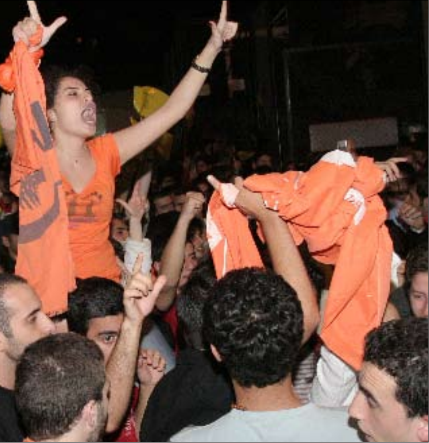
تشعر القاعدة العونية أن لديها هامشاً كبيراً من الحرية في الانتخابات البلدية

البرتقالي ويعودون إلى عائلاتهم ليتنافسوا هناك، مبعدين الحزب عن الخلافات الشخصية. وحيث فشل العونيون في الاتفاق وذهبوا إلى الانتخابات بالأحزاب عونتيتين، جمع الجنرال المتخاصمين ليتعهدوا أمامه بأن المجموعة العونية ستستعيد وحدتها فور إقفال صناديق الاقتراع، ولن يسمحوا لأحد بالإصطيد في الماء العكر.