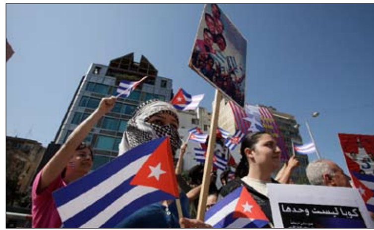
تزامن الاعتصام مع تحركات مماثلة في عواصم أوروبية عدة