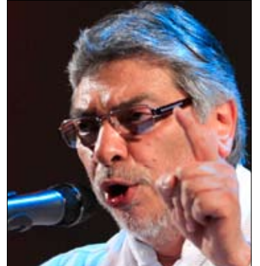
الرئيس لوغو خلال الاحتفال بذكرى تسلمه الرئاسة

أعلن رئيس الباراغواي فرناندو لوبو حالة الطوارئ في خمس محافظات في شمال البلاد على الحدود مع البرازيل وبوليفيا، إثر وقوع أربعة قتلى في كمين نفذ الأربعاء الماضي. ويرجح أن يكون منفذ الكمين «الجيش الشعبي الباراغواي» بعدما كشف عن بقايا مخيم تدريب في أحراج هذه المنطقة، التي تشتهر بتربية المواشي وإنتاج نبتة الحشيشة. ويقدر عدد أعضاء هذه المجموعة بمئة مقاتل، وقد قامت بأربع عمليات منذ عام 2001، كانت آخرها عملية خطف لأحد أكبر ملاكي الأراضي، دام ثلاثة أشهر،