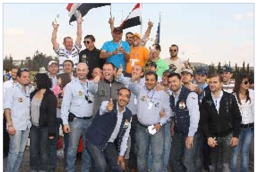
السائقون الفائزون مع المنظمين