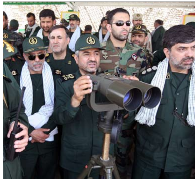
قائد الحرس الثوري محمد علي جعفري خلال مناورات في الخليج اول من امس