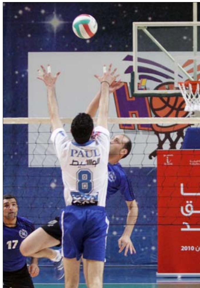
من لقاء البوشرية والجيش