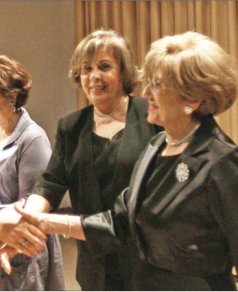
أربعة أشهر من التدريب حتى بتن جاهزات لممارسة العمل البلدي (مروان بو حيدر)

أطلقت الجمعية المسيحية للشابات في بيروت أمس الحملة الإعلامية لمشروع «المرأة والبلديات: منبر للمشاركة السياسية» تحت شعار «وانت مش ناقصك شي» وذلك بالتوازي مع تخريج 20 سيدة تدربن خلال أربعة أشهر على مهارات تمكنهن من ممارسة العمل السياسي والبلدي، نصفهن على الأقل سيخضن المعركة