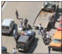
مالك يطارد النشالين lbc 21:45