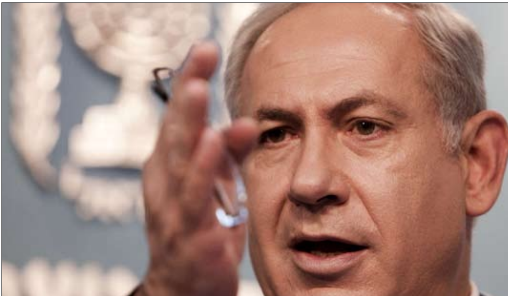
رئيس الوزراء الإسرائيلي بنيامين نتنياهو

التوزيع شركة اللوات 03 / 828381_01 / 666314_15