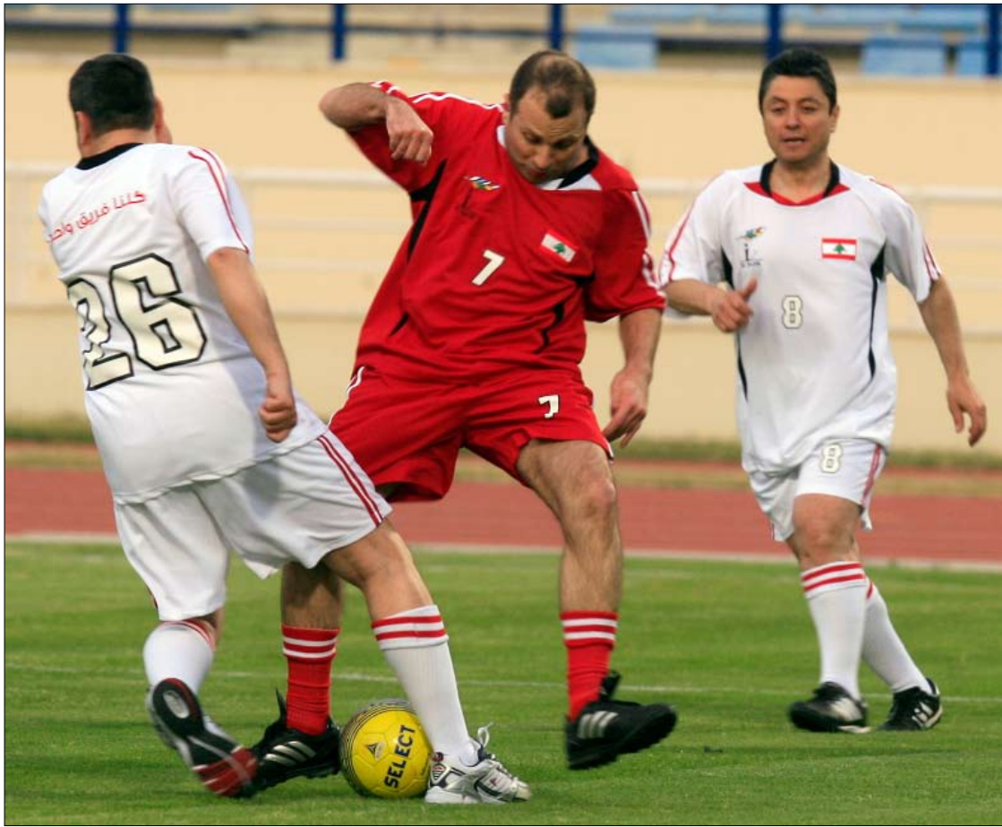
باسيل: مررت للرئيس الحريري الكثير من الكرات، لكنه لم يسجل هدفاً (هيثم الموسوي)

الوحيدة بوجه النائب آلان عون لتسديده الكرة بعدما أوقف اللعب. في هذه الأثناء، كان الرئيس ميشال سليمان باللباس الرسمي، يجلس في المنصة الرئيسية يتابع المباراة، متلفظاً ضحكة هنا وأخرى هناك، مواكباً المشاهد الدراماتيكية على أرض الملعب.