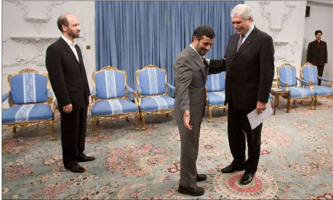
نجاد يستقبل وزير التنمية البرازيلي ميغيل جواو جورج فيلهو في طهران أمس

في هذه الأثناء، يحاول الرئيس البرازيلي لويس إيناسيو لولا دا سيلفيا بالتعاون مع رئيس الحكومة التركية رجب طيب أردوغان، الوصول إلى صيغة تحول دون إقرار عقوبات على إيران في مجلس الأمن. وقال وزير الخارجية البرازيلي، سيليسو أموري، على هامش قمة الأمن