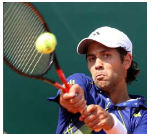
فرداسكو برتو إحدى كرات بينيتو

واصل اللاعبون الأبرز مشوارهم في دورة مونت كارلو الفرنسية في الدور الثاني، بينما كانت المفاجأة في دورة برشلونة خروج الفرنسية أرافان رضائي باكراً