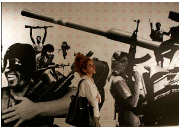
«... ولم يعودوا» وفي بحر من النسيان» معرض صور افتتح أمس (سبتمبر 2009)

هكذا، وقع السيد نصر الله والرئيس بري اتفاقاً انتخابياً «نموذجياً»، بتاريخ الثالث من نيسان الجاري، وذلك بعد سلسلة لقاءات مكثفة عقدها، كما العادة المعاوانان السياسيان لهما، أي الحاج حسين الخليل والنائب علي حسن خليل. اجتماعات كانت خلاصتها اتفاقاً مكتوباً يؤكد التحالف التام بين الحركة والحزب في كل المناطق التي سيخوضان فيها الانتخابات البلدية والاختيارية. أما خلاصة الاتفاق، الذي يقع في صفحة واحدة، حملت توقيع كل من السيد نصر الله والرئيس بري، فهي تقع في ثماني نقاط، من أبرزها: أن الأصل هو العمل الجاد للوصول إلى التزكية في كل البلديات المعنية بالتحالف. يجب مراعاة التمثيل الطائفي والعائلي في اللوائح. الاعتماد على نتائج انتخابات عام 2004 كمرجعية للأحجام وتوزيعها داخل المجالس البلدية. تثبيت حصص كلا الطرفين بموضوع رئاسة البلديات وعدم إجراء أي تعديل فيها. ضرورة تمثيل كلا الطرفين في أي بلدية لا حضور فيها لأحدهما وذلك بنسبة 20 في المئة على الأقل. ترك الحرية للمواطنين بموضوع المخاتير، ولا يجري التدخل إلا في المناطق التي ليس فيها بلديات، بل مخاتير فقط. تشكيل لجان مناطق برئاسة مسؤولي