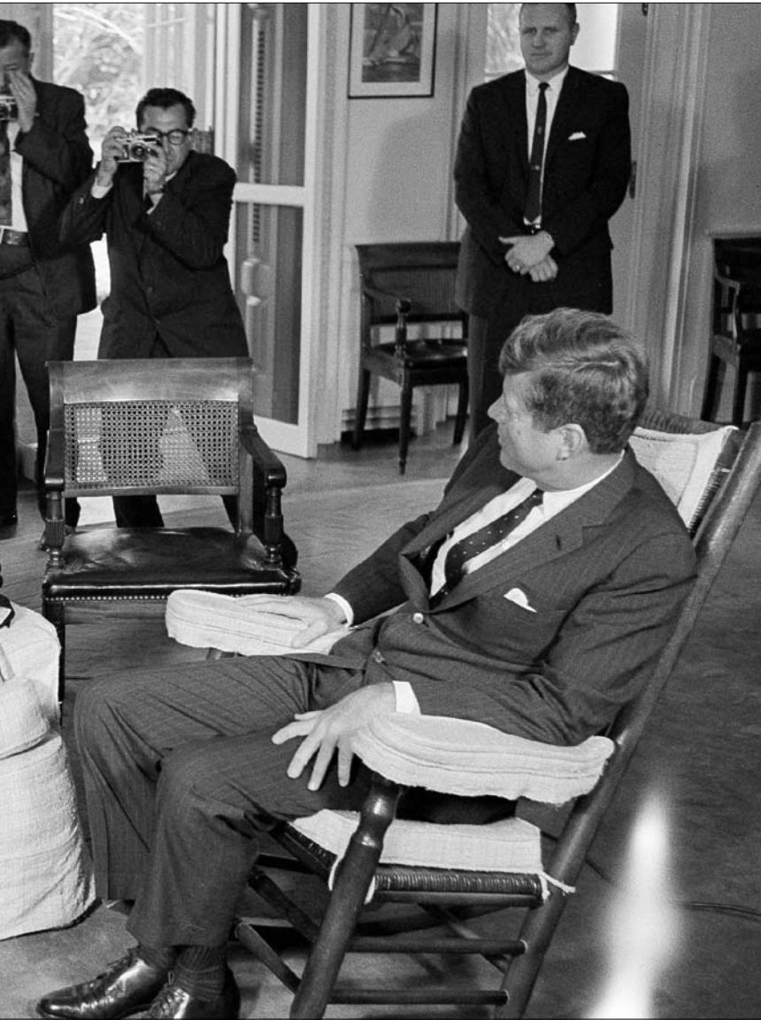
كينيدي أثناء استقباله وزير الخارجية السوفياتي اندريه غروميكو في العام 1962

باستثناء جون كينيدي، الذي حاول عبثاً منع الدولة العبرية من امتلاك السلاح النووي، فإن الحكومات الأميركية المتعاقبة، غطت على الدوام الموقف الإسرائيلي المندرج تحت «سياسة الغموض النووي». وبقي السلاح النووي الإسرائيلي السرّ الأكثر انكشافاً في العالم، مع صور قاعدة «سدوت ميخا» بعدسات أقمار التجسس الأميركية