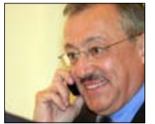
طنولي مستر فنتف «أخبار المستقبل» 21:00

تستعرض حلقة اليوم من برنامج «ملاعب» الإنجاز الذي حققته بعثة العراق في الدراجات الهوائية بإحرازها الميدالية البرونزية للفرق في بطولة آسيا. وهي أول ميدالية للعراق في هذه البطولة منذ 25 عاماً. ويتخلل الحلقة لقاء مع القيمين على «الاتحاد العراقي للدراجات الهوائية».