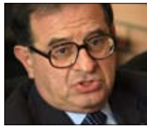
بقرادوني يتذكّر (الحرب) nbn 21:00