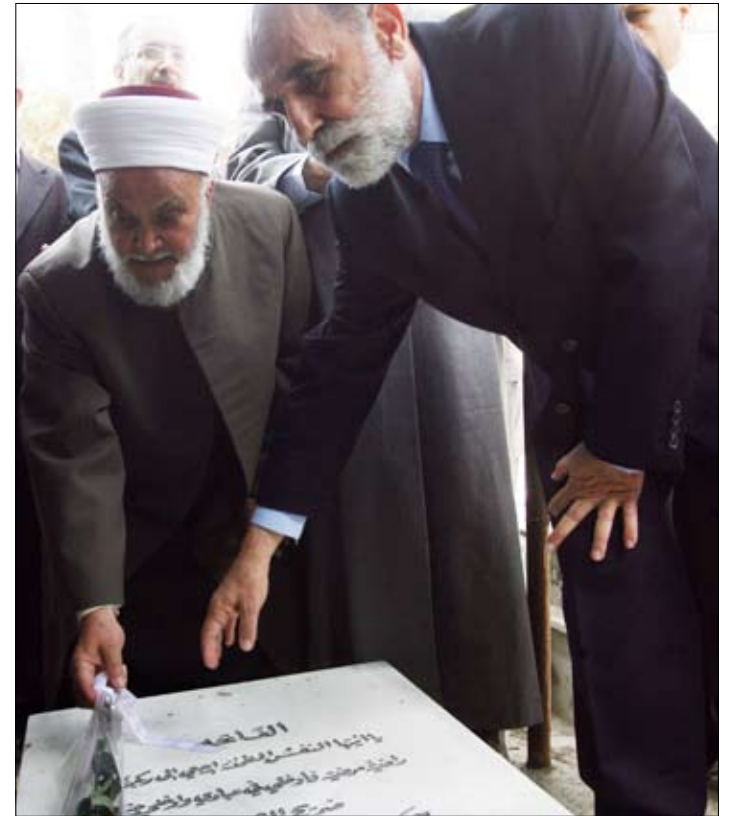
لم يبق من ذكرى الحرب إلا المقابر التي تحمل ضحاياها (مروان بو حيدر)

«لكل الشهداء، والمعوقين، ومن استبيحت بيوتهم وأرزاقهم وذكرياتهم. نستميحهم عذراً». «هذا ليس إعلاناً. لكنه، نص اعتذار تلت، أمس، الهيئة الوطنية لدعم الوحدة ورفض الاحتلال على أضرحة شهداء الحرب في ستة مدافن في بيروت