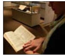
يا زمان الوصل في «صقلية» الجزيرة الوثائقية 20:00