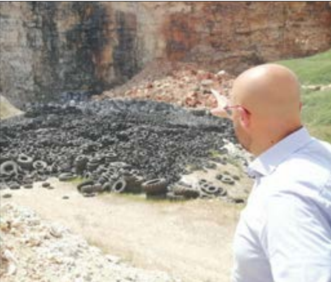
إعادة التدوير تعموها صحهيات في السياسات الرسمية (الأخبار)