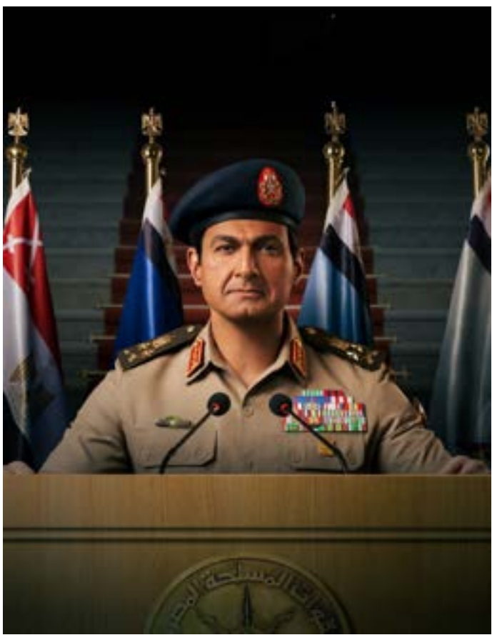
عمام شمبات *

يتماش مسلسل «الاختيار 3: القرار» مع سرديّة رائجة الثورة مؤامرة كادت أن تسقط الدولة، استدعت تدخل المخلص، لمجاهة المخاطر. هكذا تشرح لنا صحف القاهرة ويحتفي نقّادها بالعمل. كان مسلسل «هجمة مرتدة» (رمضان الماضي) قد تناول حراك ما قبل يناير والشهور الأولى من الثورة، وحصل رسالة أساسية: الثورة فعل تامري، قادته