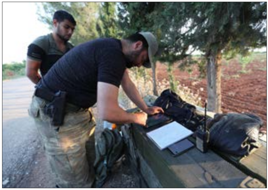
يشهد ريف اللاذقية الشمالي الشرقي معارك شرسة وأعدت من جهات سهل الغاب

وسترافق هذا التحرك مع تكثيف العمليات على محاور أقصى ريف اللاذقية شمالي الشرقي، والتي تتيج السيطرة عليها أفضلية عسكرية في أي تحرك محتمل نحو جسر الشغور. وتتميز المعارك على هذا المحور بطبيعة مختلفة عن جهات سهل الغاب، إذ يشهد وجوداً وازناً لمسلحي تنظيم «حراس الدين» والفصائل «القاعدية» المنضوية معه ضمن «غرفة عمليات... وحزب المؤمن». وتختلف آلية إدارة تلك الفصائل للمعارك، وطبيعة التزام مسلحيها القتال، عن الصيغة التشاركية بين «جيش العزة» و«الجبهة الوطنية للتحريب» و«هيئة تحرير الشام». ويسهم ذلك، ريثما بالطبيعة الجغرافية القاسية للمنطقة، في جعل المعارك أكثر شراسة وتعقيداً مما شهده الريف الحموي حتى