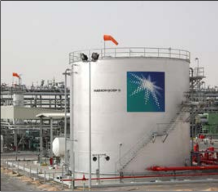
الخطّ المستهدف بنقل خمسة ملايين برميل نفط يومياً على النقل (ف ب)

وقطع الغبار، وورش التركيب والتفخيخ، وأماكن الفحص وتجهيز منصات عربات الإطلاق، وكذلك مرافق التدريب لتنفيذ العمليات الإرهابية» في صنعاء، وهو ما نفته «أنصار الله» حينها، مؤكّدة أن الردّ عليه «سيكون عملياً». وما هو الردّ يتجلّى بالفعل اليوم، ليثبت تواصل الخطّ التصاعدي لعمليات تطوير القدرات العسكرية لدى القوات المسلحة اليمنية، التي أكدت في بيانها أمس «جاهزيتها لتنفيذ عمليات نوعية أخرى في حال استمرار العدوان في ارتكاب الجرائم وانتهاك السيادة الوطنية». وهو ما شدّد عليه أيضاً الناطق باسم «انصار الله»، رئيس وفدّها التفاوضي محمد عبد السلام، بقوله إنه «في مواجهة هذا الاستهتار من قبل تحالف العدوان، وما يمارسه من إرهاب منظم وبغطاء أميركي دولي، فلا خيار أمام شعبنا العزيز إلا الدفاع عن نفسه»، مشيراً إلى أنّ