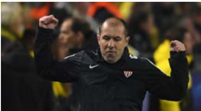
النادي منذ زمن

الموسم التاريخي لأياكس وضع النادي أمام احتمالين، البناء على نجاح هذا الموسم والمضي قدماً في السنوات المقبلة، أو التخلي عن أبرز نجوم الفريق والاستثمار في أموالهم لشراء مواهب أخرى بأسعار أقل. أمرٌ قد يفتح الاحتمالية أمام عودة العملاق الهولندي من جديد، أو السير على خطى القديسين، أي نادي ساوثهامبتون، فيعود إلى المنافسة محلياً فقط، ومحاولة بناء منظومة قوية من البداية.