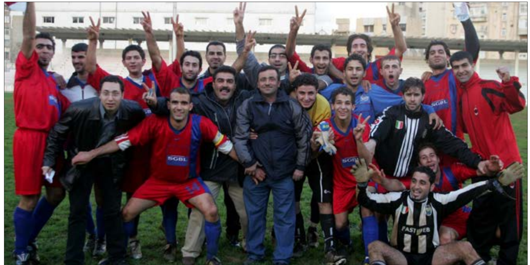
النادي منذ زمن