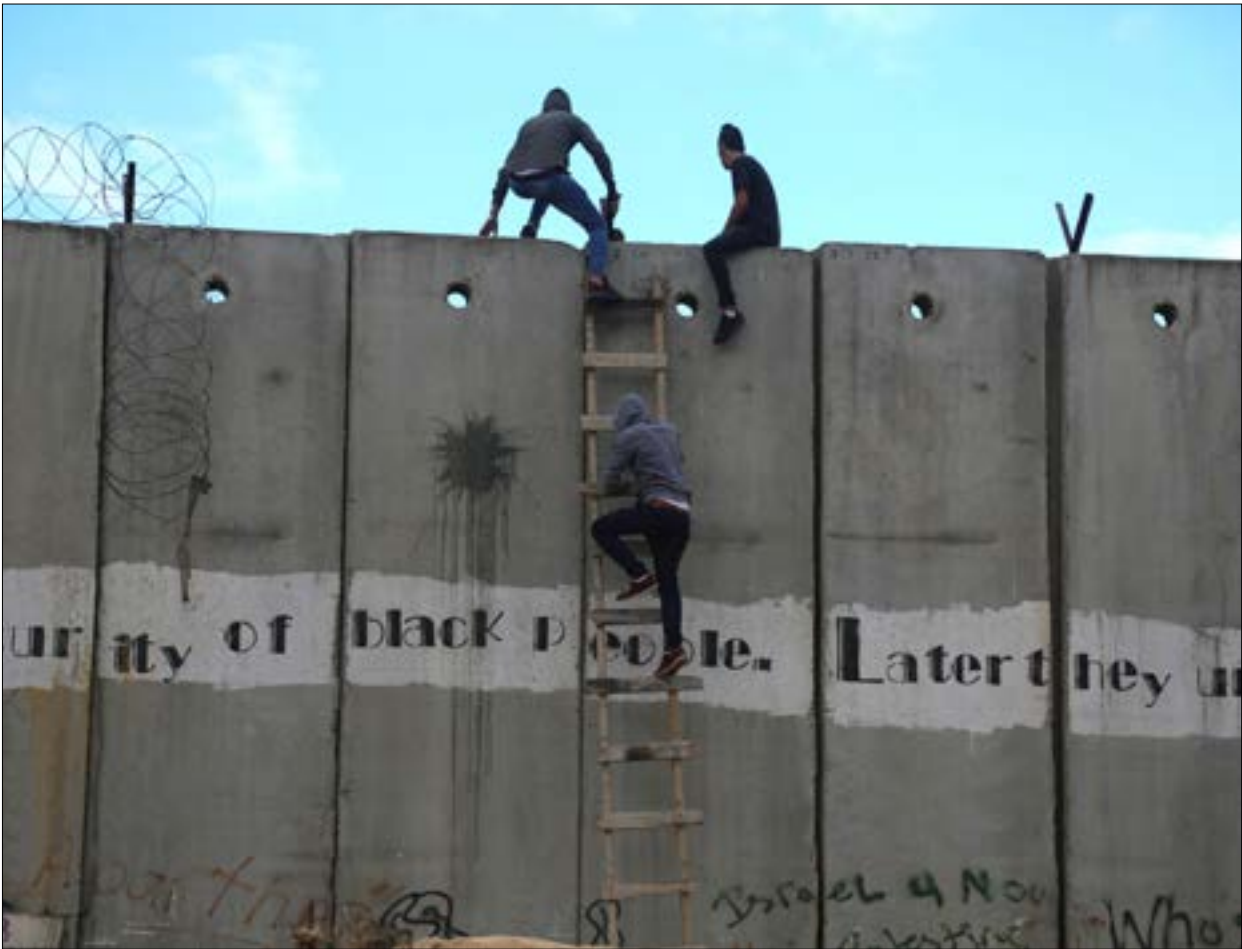
كان الشعب الفلسطيني ولا يزال السد امام المنزمية والخونة الذين يتربصون الانتكاه إلى التحالف الصلبي مع الكيان الصهيوني

اليهودية على جزء من أرض فلسطين، إلى منطلق للسيطرة على كاملها، يقول: «ستحشد في الدولة أكبر عدد ممكن من اليهود... لا أشك في أن جيشنا سيكون واحدا من أكثر الجيوش تميراً في العالم، وعندئذ أنا متأكد أنه ما من شيء سيمنعنا من الاستيطان في كل الأجزاء الباقية من الأرض، إما من طريق الاتفاق والتفاهم المتبادل مع جيراننا العرب، وإما بطرق أخرى». هكذا، يتضح على نحو ملموس أن الموافقة الفلسطينية والعربية على قرار التقسيم لم تكن لتنفذ ما بقي من فلسطين، بل يكن هناك بديل منها بسبب طبيعة الفلسطينيين بكداء يعادل عدد