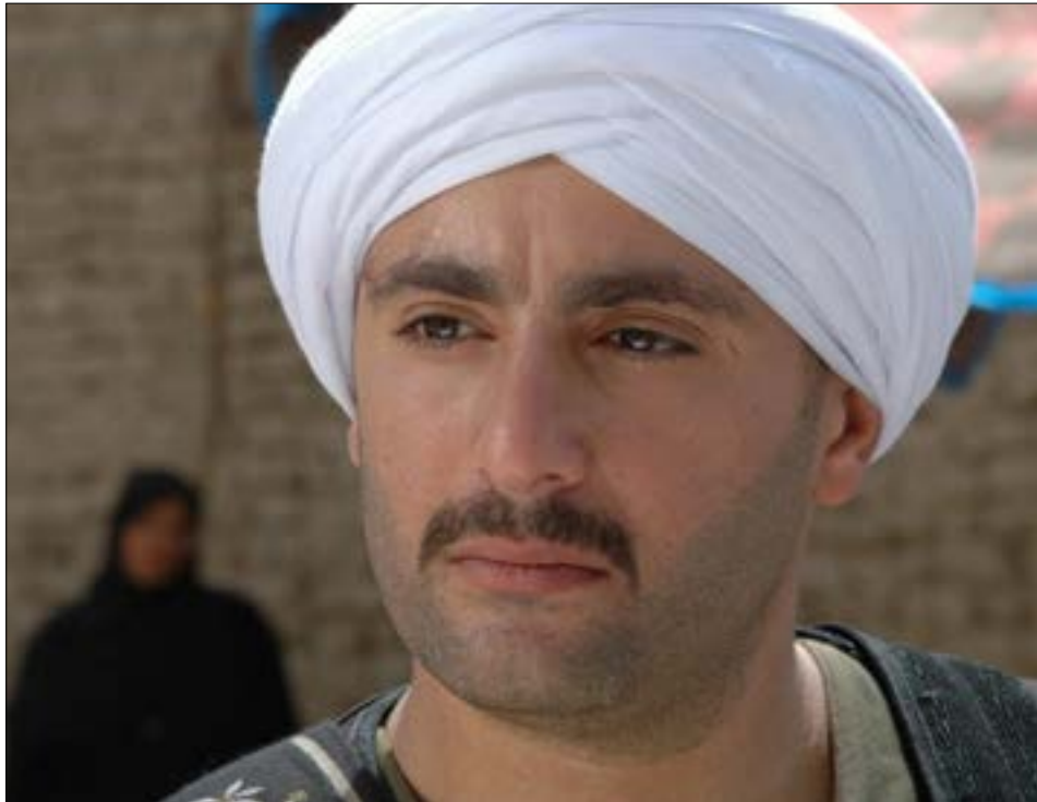
أحمد السقا في «ولد الغلابة»