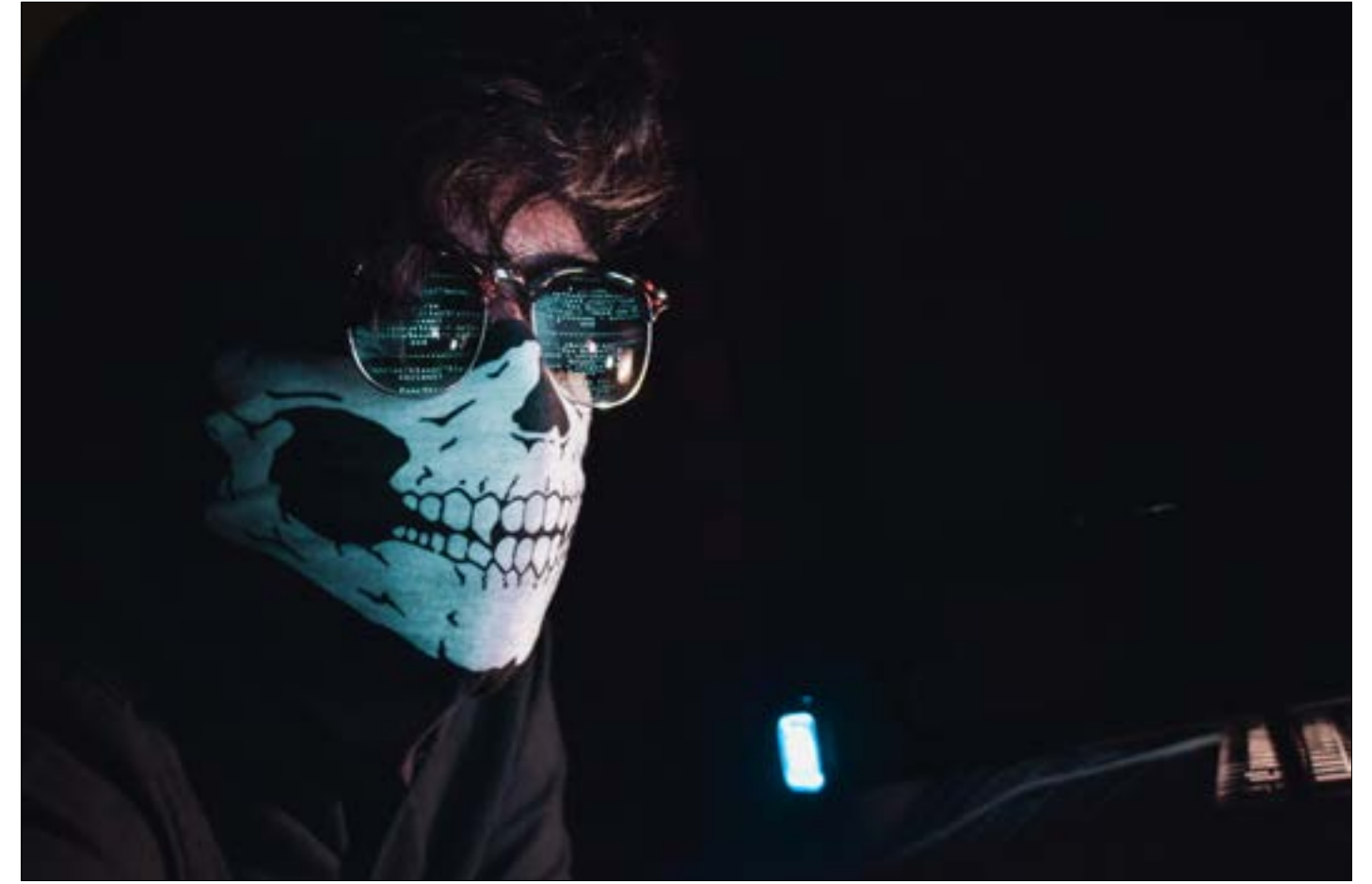
طلبت شركة «واتساب»، من مستخدمي التطبيق، تحديده، زامعة أن ذلك يحل المشكلة

المستهدفة يُعدّ «إنجازاً رائعاً»، على حد قوله، لافتاً إلى أن هذا ربما استخدم عدة مرات قبل اكتشافه، في وقت متأخر من يوم الأحد الماضي، بينما كان مهندسو تطبيق واتساب الملوك من شركة فايبيوك يسابقون الوقت لإغلاق الثغرة، استهدف هاتف محام يعمل في مجال حقوق الإنسان مقيم في المملكة المتحدة، باستخدام الطريقة نفسها.