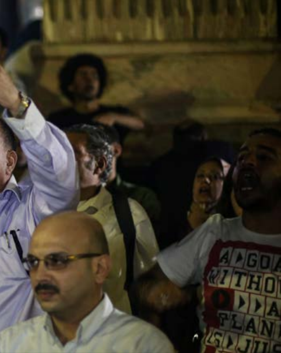
استمادت نقابة الصحفيين ذكريات «ثورة 25 يناير، ضد مبارك

... وأما «كاتالوغ» محمد مرسي فسيفكّر انتقال مصر من الوصاية القطرية إلى الوصاية السعودية، وحينها لن يعجب أحد إن تكرر معها سيناريو «العزلة القطرية»، في حال قررت في يوم من الأيام أن تتحرر من قيد «طويل العمر»... أو ربما خليفته الجاري إعداده للملك.