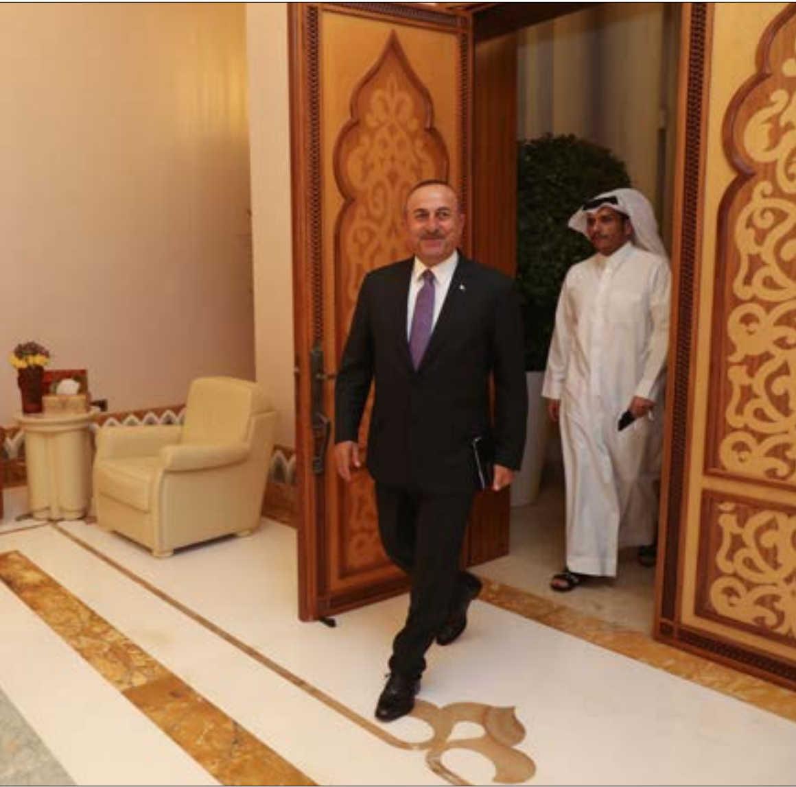
مولود جاويش أوغلو، القطريون إخواننا ونحن هنا تضامناً معهم

أكد إبراهيم كاليين، المتحدث باسم الرئيس التركي رجب طيب أردوغان، أن «أولويتنا الرئيسية في إطار جهودنا مع كل من قطر والسعودية والدول الخليجية الأخرى هي حل هذه الأزمة من طريق المفاوضات، لا تصعيدها»، لافتاً إلى أن «علينا اليوم التصدي