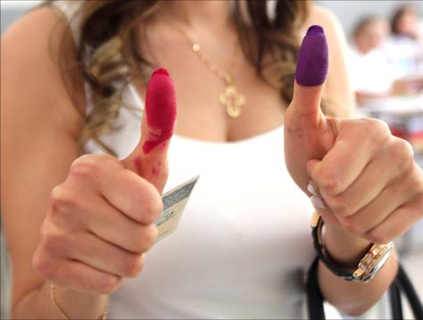
ستكون مراكز الاقتراع متصلة بشبكة إلكترونية، للفرز، ولنمّن الناخب من الاقتراع أكثر من مرة (هيلم الموسوي)