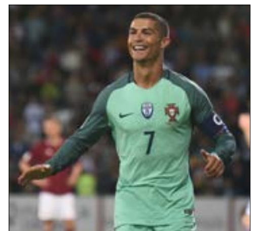
علق رونالدو على اتهامه: «ضميري مرتاح دائماً»

لا تزال قضية التهريب الضريبي المتهم بها نجم ريال مدريد البرتغالي كريستيانو رونالدو تحتل العناوين الأولى لدى الصحافة الرياضية في العالم، لتعيد التذكير بقضايا التهريب التي يعاني منها نجوم العالم في مختلف المجالات. ومثلما كان متوقعاً، دافع «سي آر 7» عن نفسه بالقول إنه «مرتاح الضمير» غداة اتهامه من قبل القضاء الإسباني في قضية تهريب ضريبي بقيمة 14,7 مليون يورو، بينما أبدى فريقه ريال مدريد ثقته ب«البراءة التامة» لقائد منتخب البرتغال. وفي أول تعليق له على القضية،